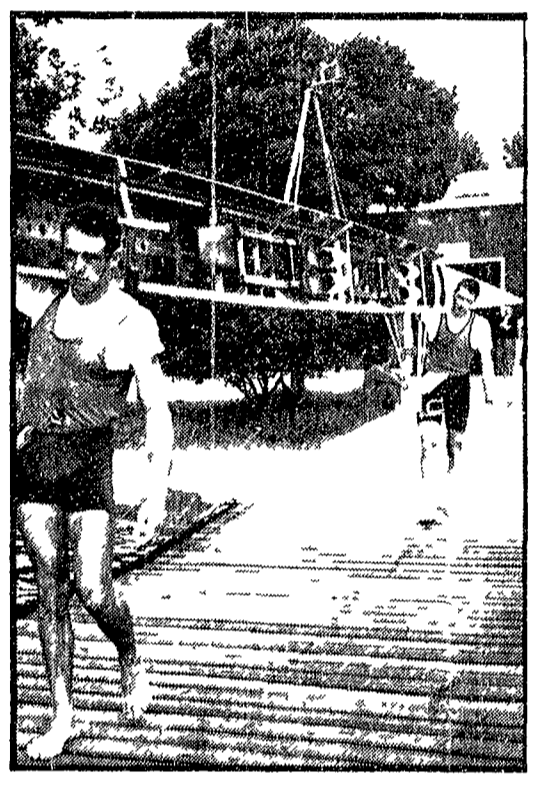
ROSSETTO e BARAN sono le maggiori speranze per una medaglia nel «due con»