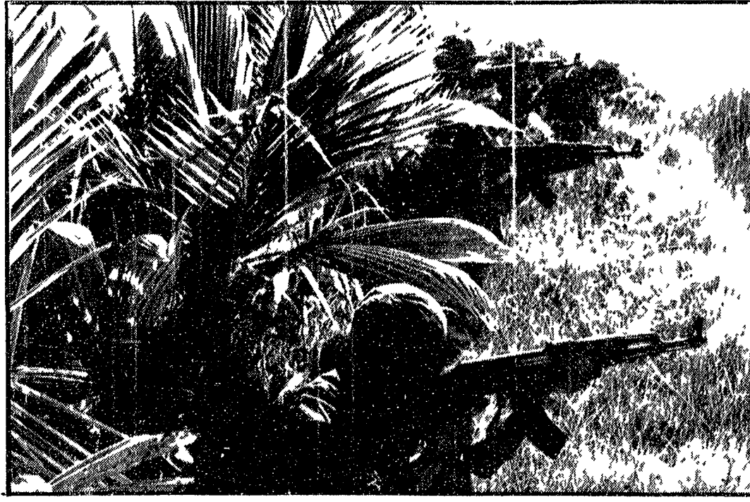
VIETNAM DEL SUD - Partigiani vietnamiti ripresi durante un'azione sulle pianure centrali

La Repubblica Democratica del Vietnam fu il frutto di una rivoluzione nazionale e sociale che la dove il colonialismo occidentale aveva lasciato una spaventosa eredità di sottosviluppo, di arretratezza, di sfruttamento, di odio. La Repubblica Democratica del Vietnam fu il frutto di una rivoluzione nazionale e sociale che la dove il colonialismo occidentale aveva lasciato una spaventosa eredità di sottosviluppo, di arretratezza, di sfruttamento, di odio.