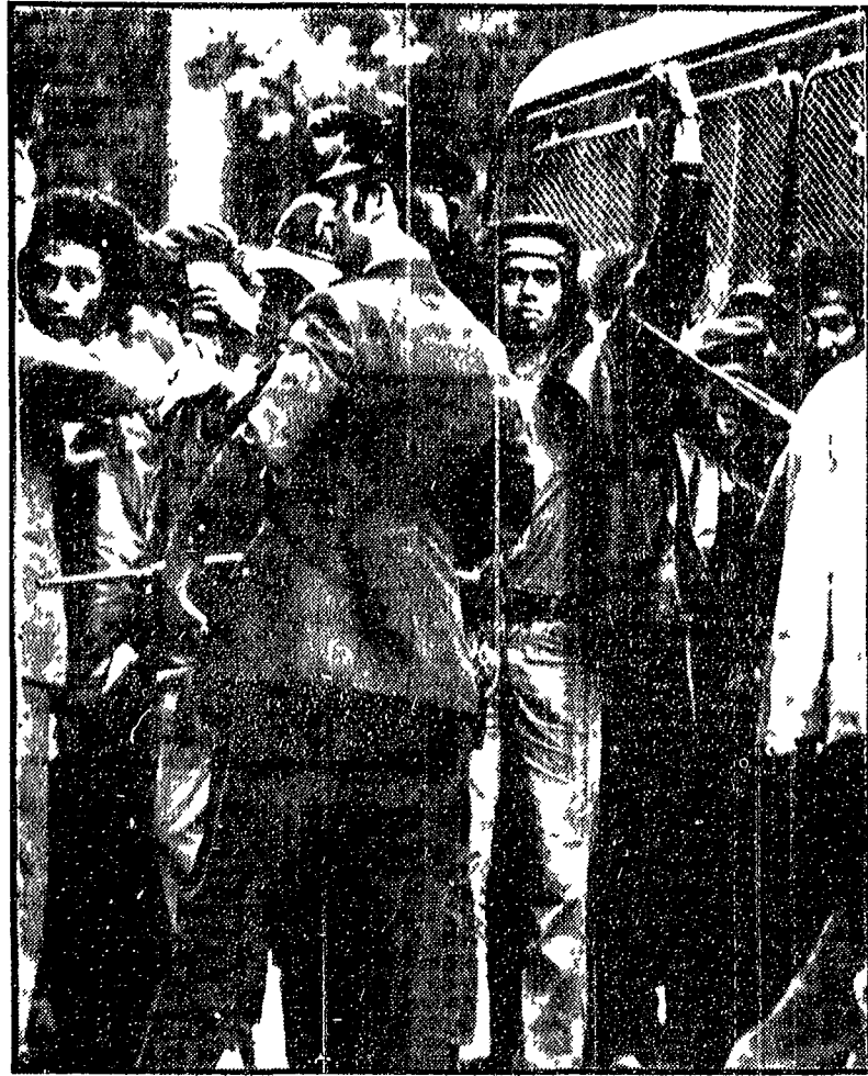
Il presidente indonesiano Suharto ha fatto annunciare che la sua visita in Olanda, già sospesa lunedì, subirà un rinvio di un altro giorno e sarà limitata a un giorno solo, invece, per « motivi di sicurezza »...