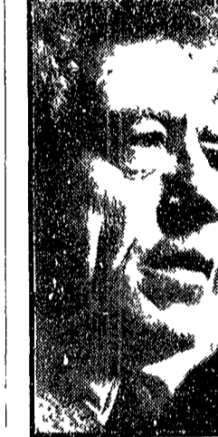
Nell'ultima settimana di ottobre si aprirà a Roma una grande mostra dello scultore Alberto Giacometti (1901-1966). La mostra, che è organizzata dalla Galleria Nazionale d'arte...

In allestimento a Villa Medici una grande mostra antologica che si aprirà alla fine di ottobre