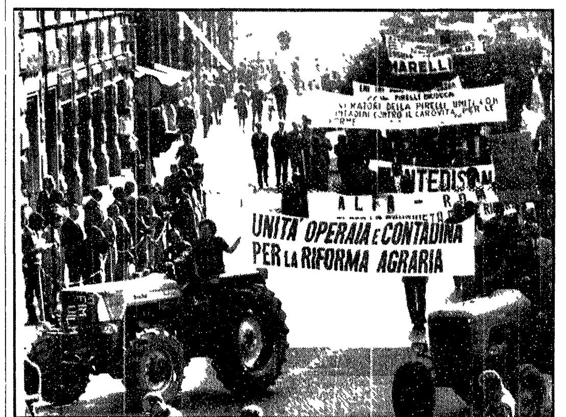
Trattori alla testa di migliaia di manifestanti ieri per le vie di Milano. Operai e contadini — si calcola ve ne fossero non meno di 10 mila — hanno detto no alla distruzione della frutta e hanno rivendicato una nuova politica agraria. E' stata distribuita frutta gratuitamente, nelle strade e sui mezzi pubblici ed, in serata, si sono svolti incontri di fronte alle fabbriche. A PAGINA 4