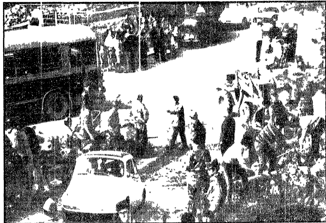
Soldati e giovani volontari al lavoro in una via di Voltri

Acquisanta e Masone: due paesi devastati come da un terremoto - «Cari signori, qui il castigo di Dio non c'entra» - Il lavoro delle organizzazioni unitarie popolari - Le proposte dei comunisti liguri - I sindacati chiedono un incontro con Colombo