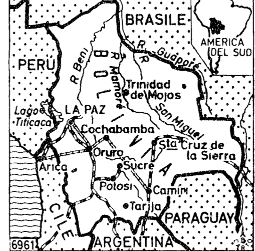
LA PAZ 13. Il ministero dell'Interno boliviano ha comunicato che...