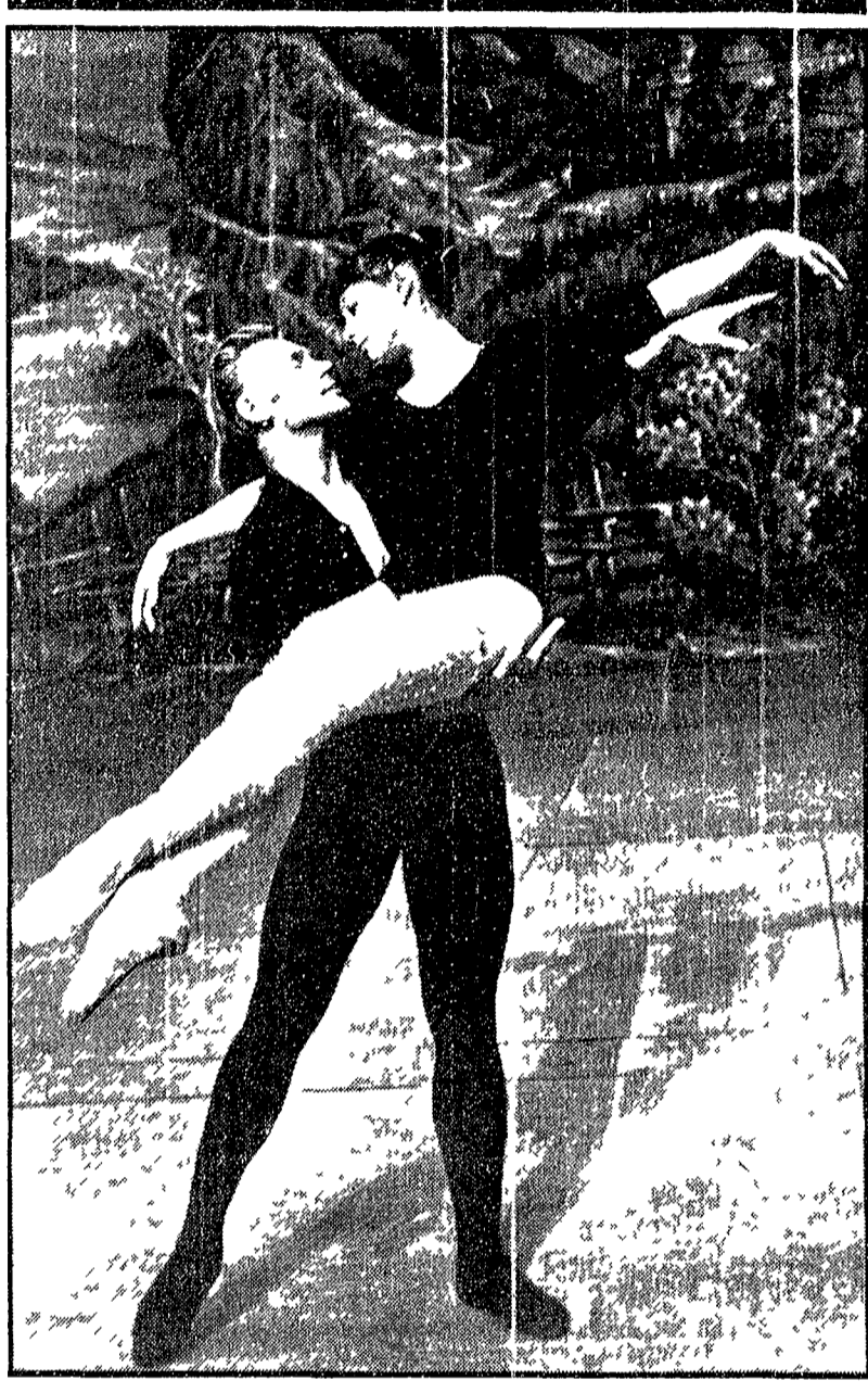
Grande attesa a Roma e Teatro dell'Opera durante la prima del «Lago dei cigni» di Ciaikowski che va in scena domani sera nella interpretazione della compagnia di balletto del Bolscioi di Mosca...