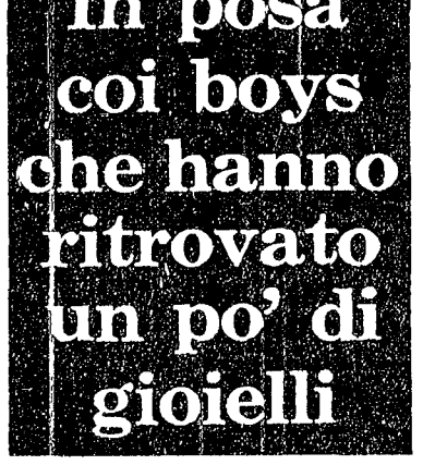
La sfarzosa parata dei gemelli di Sofia Loren, con i ragazzi che hanno ritrovato i gioielli

In posa coi boys che hanno ritrovato un po' di gioielli