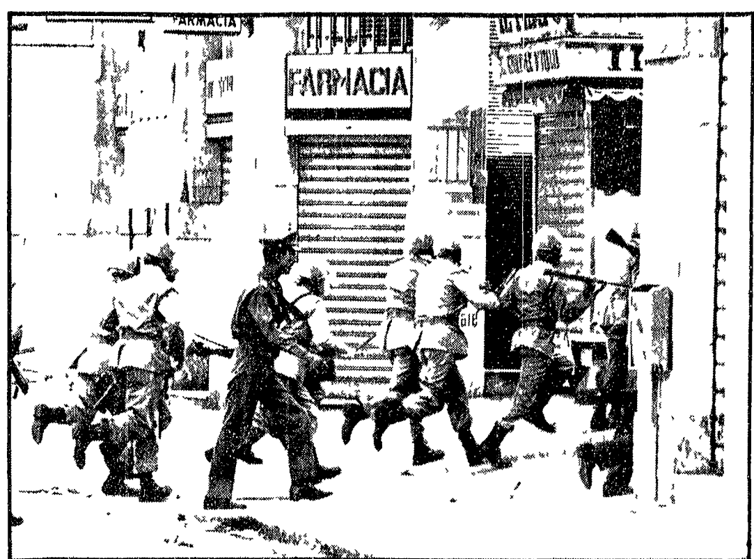
Un momento degli scontri a Reggio Calabria

« Il provvedimento di chiusura del servizio di pulizia è stato interrotto da tre mesi a questa parte. A tale proposito bisogna rilevare che molti dei maggiori imprenditori edili sono stati tra i promotori dell'attività. « Alle officine OMI CA negli orari presentati stamane regolarmente il lavoro è stato interrotto per la mancanza di energia elettrica per cui l'attività produttiva è stata sospesa. Si lavora solo in alcuni cantieri.