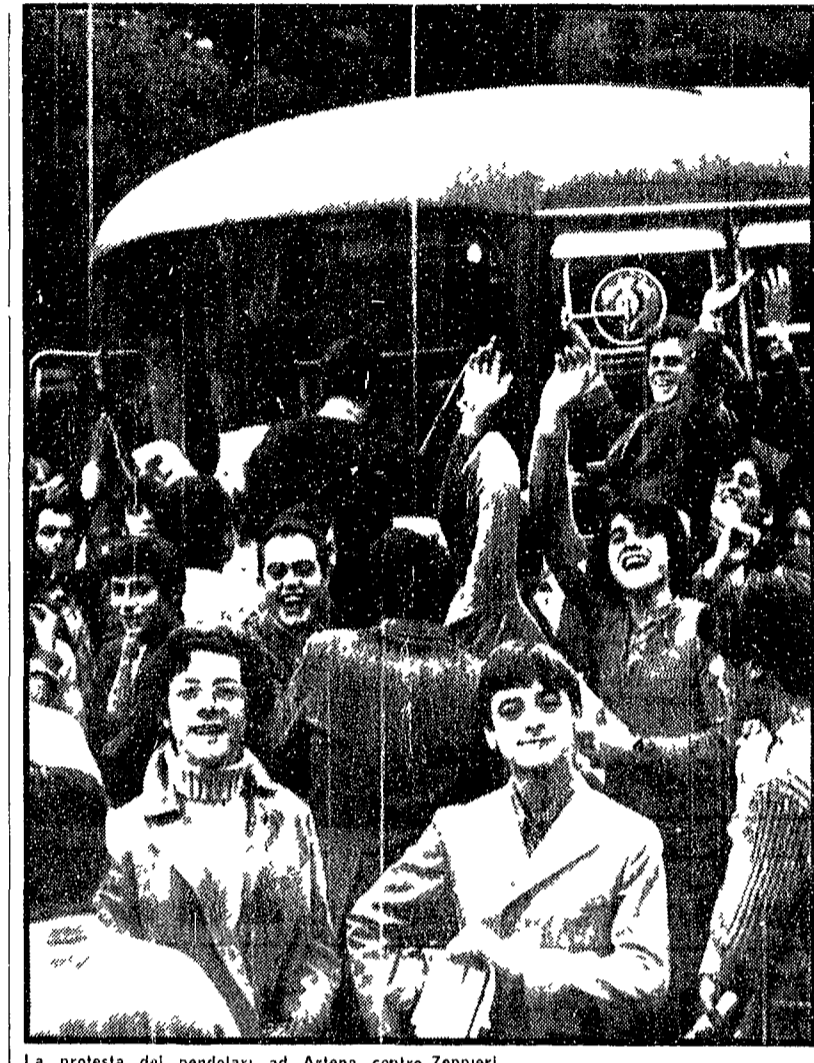
La protesta dei pendolari ad Ardena contro Zeppieri

«Il problema di fondo — come ha dichiarato lo stesso presidente della Stefer Luigi Invernizzi — deve essere affrontato e risolto globalmente. La stessa chiusura del centro storico — ha proseguito — alla quale si dovrà arrivare non dà la soluzione di fondo del grave problema. Secondo il presidente della Stefer che nella propria dichiarazione ha ricordato la necessità di un'indagine globale di compiere interventi di riassetto urbanistico e di riorganizzazione della rete metropolitana. La soluzione di fondo risiede nella realizzazione della metropolitana di Ostia e della metropolitana Termini-Laurentina.