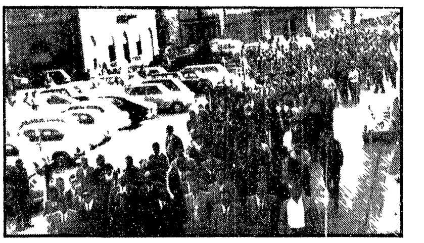
A Pontedera sfilano in corteo migliaia di cittadini e di lavoratori della Piaggio

apnea COME FRA da prevede... credendo come sostiene... Il quotidiano bolognese... Friebraccio