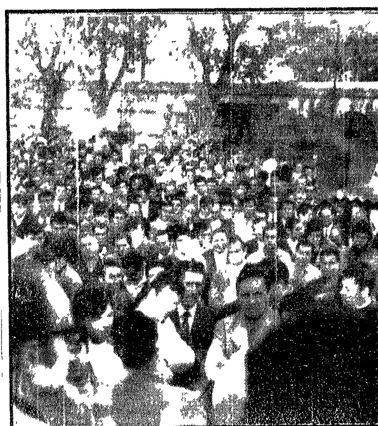
Gli operai dell'Alfa Romeo riuniti in assemblea

Qualifiche, cottimi e ambiente di lavoro al centro della lotta articolata - Ritmi di lavoro insopportabili - Astensione dei metalmeccanici di Porto Torres