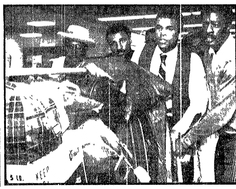
Clay e Quarry in combattimento.

ATLANTA, 20 Ritorna Cassius Clay il nuovo appuntamento con le dodici corde per il più grande campione della boxe moderna è fissato per il 26 ottobre ad Atlanta (Georgia) contro Jerry Quarry. In caso di vittoria Clay potrà combattere nuovamente per la corona mondiale. Mohammed Ali come si fa anche chiamare è inattivo da tre anni nel corso di i quali la cronaca si è spesso occupata di lui per motivi che il più delle volte esulavano dallo sport. Il campione olimpico di Roma che è nato nel 1942 aveva conquistato la corona mondiale il 25 febbraio 1964 sconfiggendo Sonny Liston per ko al settimo round. L'aveva poi conservata ri