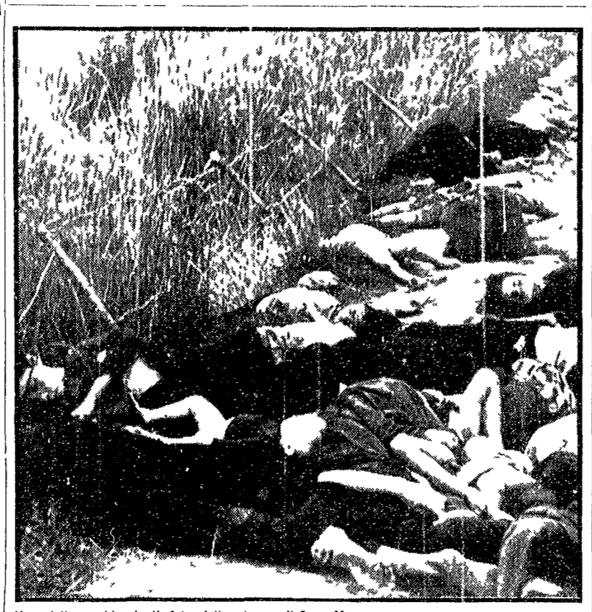
Una delle agghiaccianti foto della strage di Song My

La prossima settimana «vertice» fra Sadat, Nimeiri e Gheddafi - Amman: nuovi scontri fra giordani e guerriglieri - Un comunicato della commissione interaraba sulle misure per evitare conflitti fra la Resistenza e le forze reali - Damasco: le notizie sulla crisi in Siria definite «una manovra imperialista»