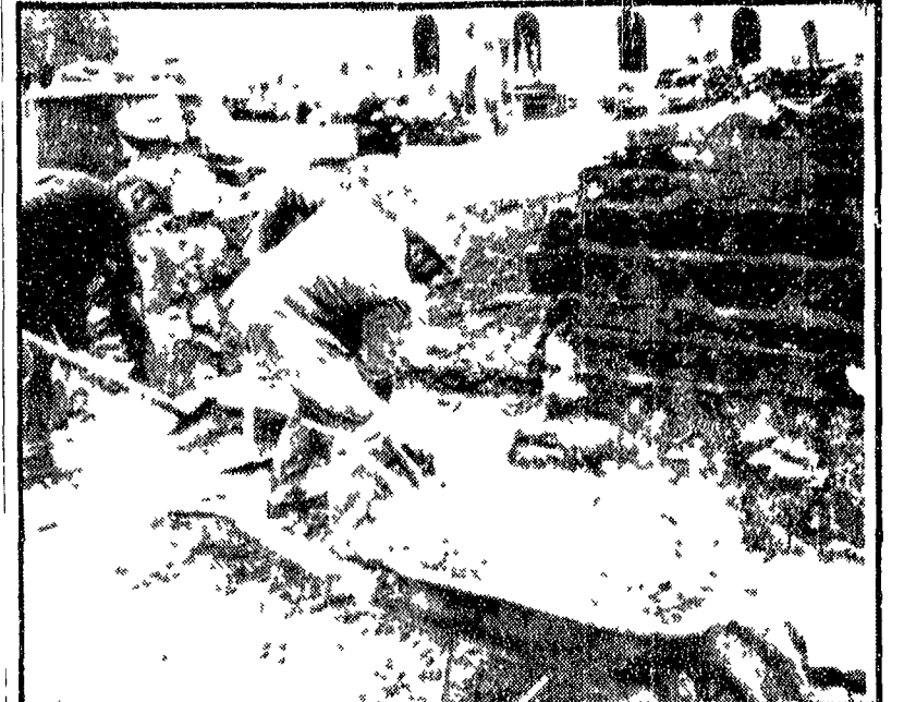
COLOMBY LES DEUX EGLISES - L'ingresso del cimitero dove oggi sarà sepolto De Gaulle viene allargato per permettere l'accesso alle migliaia di persone che parteciperanno ai funerali