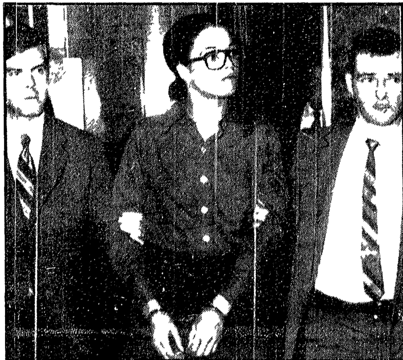
NEW YORK — Angela Davis fotografata al momento del suo arresto nell'ottobre scorso

Un gran giuri californiano l'ha infatti ritenuta responsabile solo di aver acquistato delle armi — «Mi hanno arrestato solo perché sono comunista» — Incriminato uno dei segretari del PCUSA