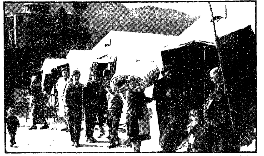
MIGNANO MONTELUONGO Un'immagine che riporta ai tempi della guerra, quando il paese fu raso al suolo dai bombardamenti. Oggi si è vuotato ancora, ma solo 130 tende sono tutti i soccorsi inviati

Le scosse si ripetono al ritmo di dieci al giorno - Raso al suolo l'abitato come durante la guerra - Le poche case in piedi tutte lesionate - L'esodo in massa della popolazione senza più risorse - Aspettano ancora l'indennizzo del sisma del '62: sono arrivate 130 tende - L'origine del fenomeno