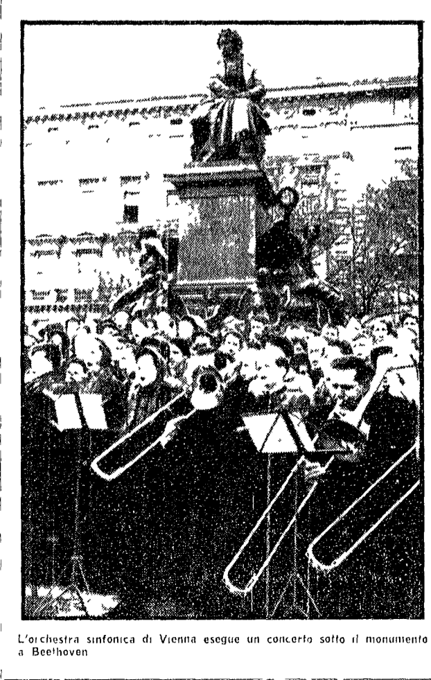
L'orchestra sinfonica di Vienna esegue un concerto sotto il monumento a Beethoven