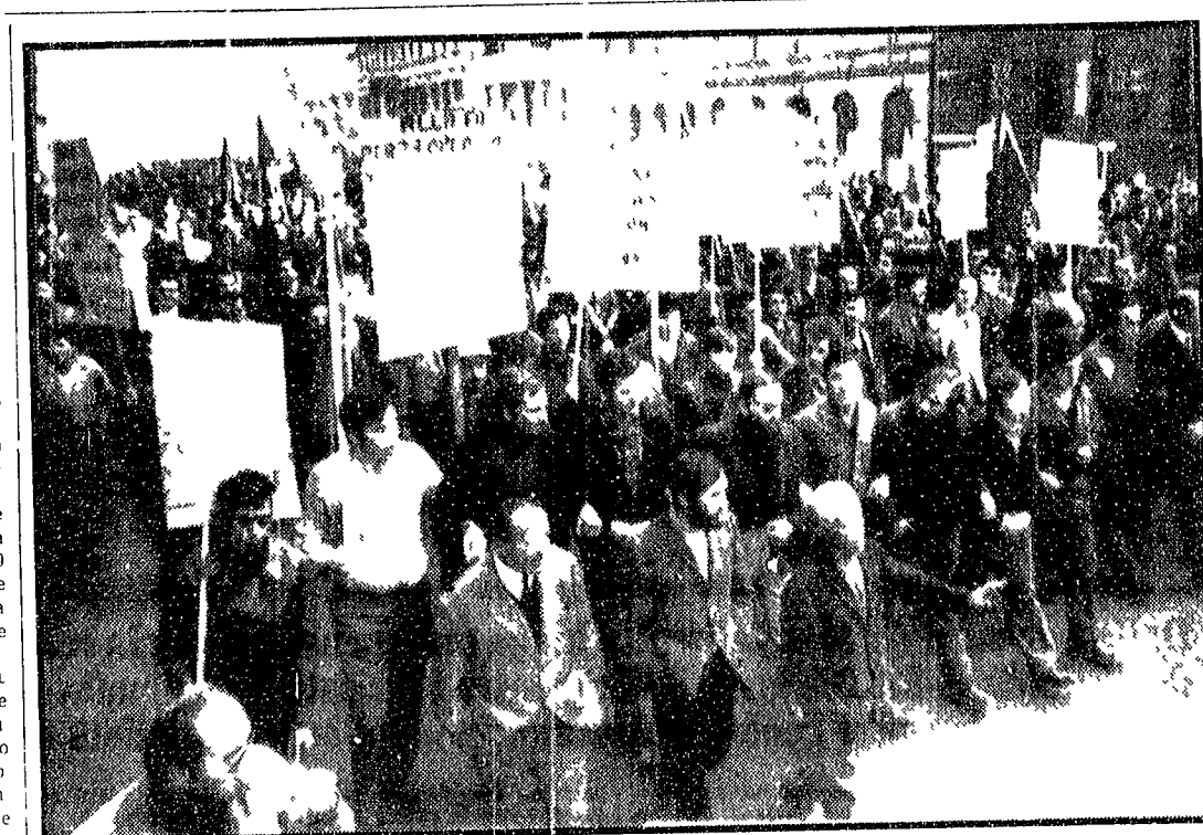
Protestano i lavoratori della Falk. I metallurgici del gruppo Falk (che ha stabilimenti a Sesto San Giovanni, Arcore, Dongio, Novato, Mezzola, Brescia) hanno manifestato nella mattinata di ieri per le strade di Milano...

«Non lasceremo spazio all'avventurismo e alla reazione» - Il padrone americano della Good Year travolge un operaio con la propria auto - Rappresaglia all'Italsider di Taranto: 45 sospesi - Astensioni nel Sulcis - Si prepara la giornata di lotta in Puglia, Lucania e Irpinia - Sciopero generale deciso a Palermo