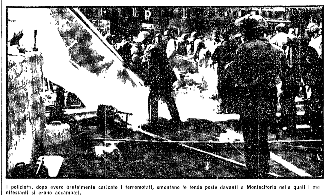
I poliziotti, dopo avere brutalmente caricato i terremotati, smontano le tende poste davanti a Montecitorio nelle quali i manifestanti si erano accampati.

La Camera ha parlato a lungo di un provvedimento di carattere straordinario, di carattere eccezionale, di carattere straordinario. Il provvedimento è stato approvato con un voto di 350 contro 150.