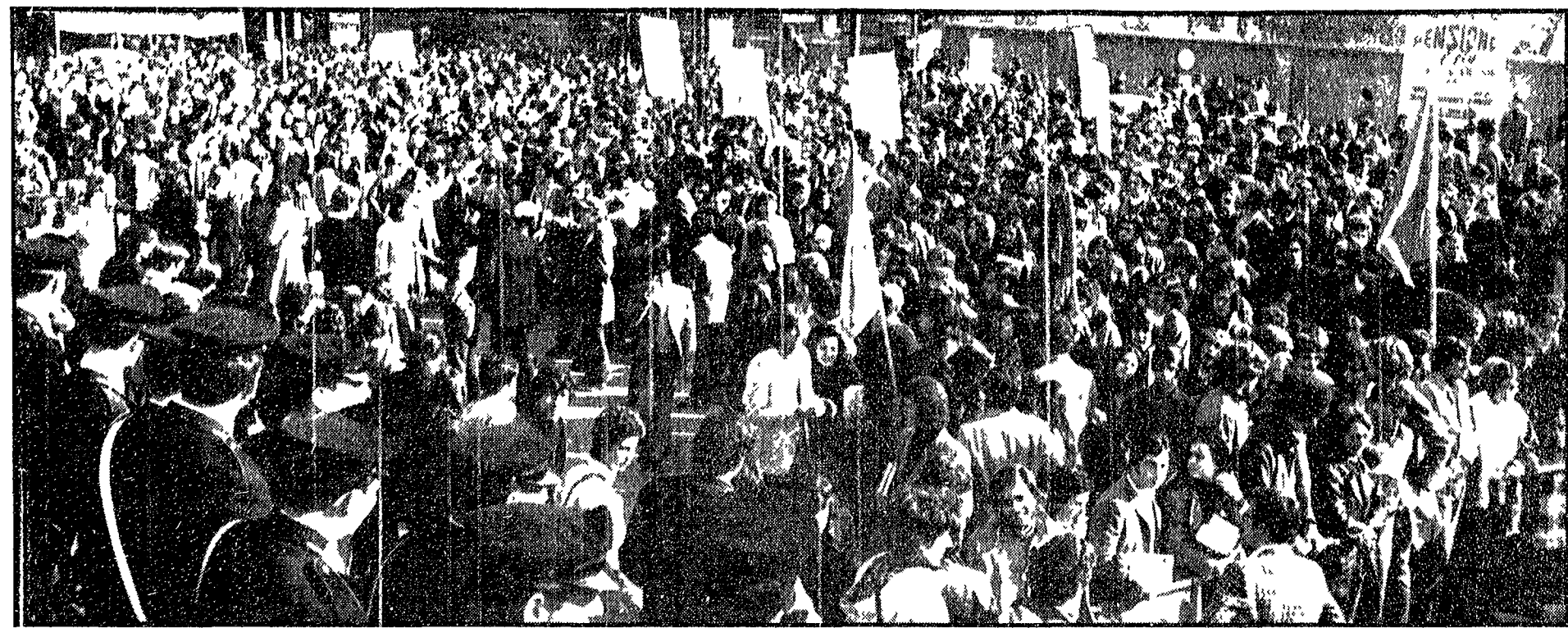
Il corteo dei giovani durante la manifestazione dinanzi al ministero della Pubblica Istruzione a Roma

La protesta davanti al ministero della Pubblica Istruzione e al liceo «Tasso» - Vivace assemblea a Lettere in serata - Domani nuova manifestazione dal Colosseo - Iniziative anche a Bologna, Bari e Parma - La polizia sgombera una scuola a Napoli - Comunicato della FGCI nazionale