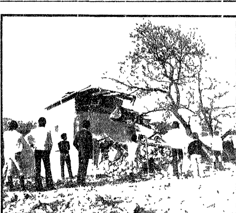
Le ruspe demoliscono le baracche... NELLA FOTO le ruspe mentre abbondono una casetta