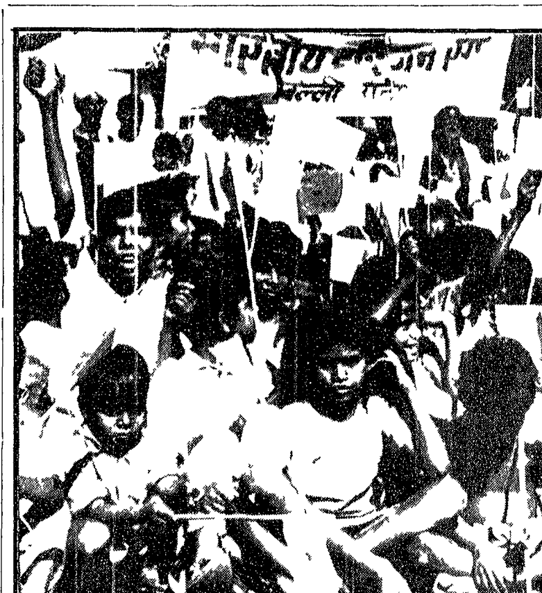
« DATECI PANE, DATECI VESTITI » Un corteo di bambini sfilato a New Delhi in occasione della giornata internazionale dell'infanzia in una manifestazione destinata a dare evidenza drammatica agli ingenti problemi della società indiana