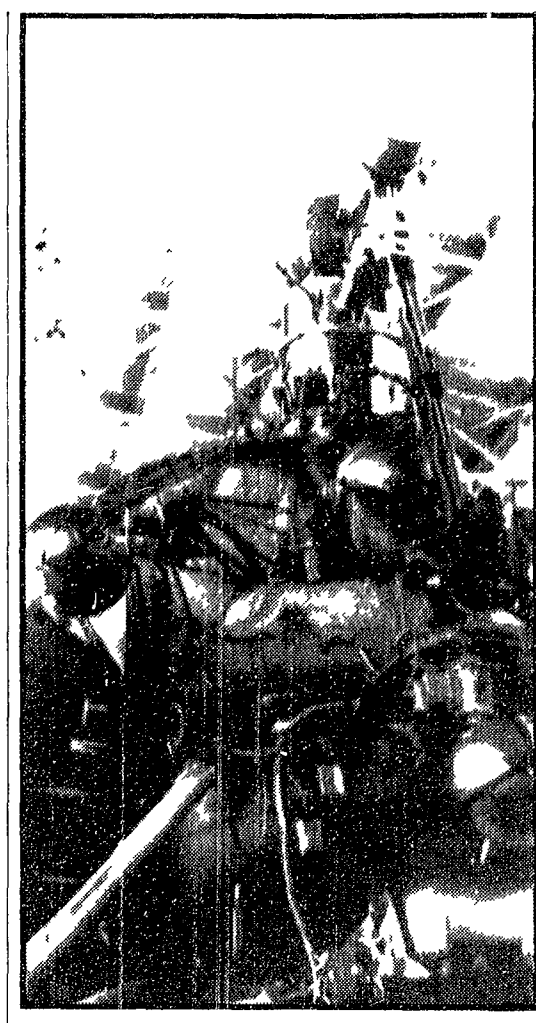
Lunik 16 la sonda spaziale sovietica che ha preceduto l'impresa di Lunik 17

Poi il braccio con il piezoelettrico contenente i contatti a bordo. La stazione riprende poi la Terra il 13 settembre 1970. L'URSS ha conquistato la Luna senza precedenti. Lunik 17 — Un periplo di viaggio cosmico.