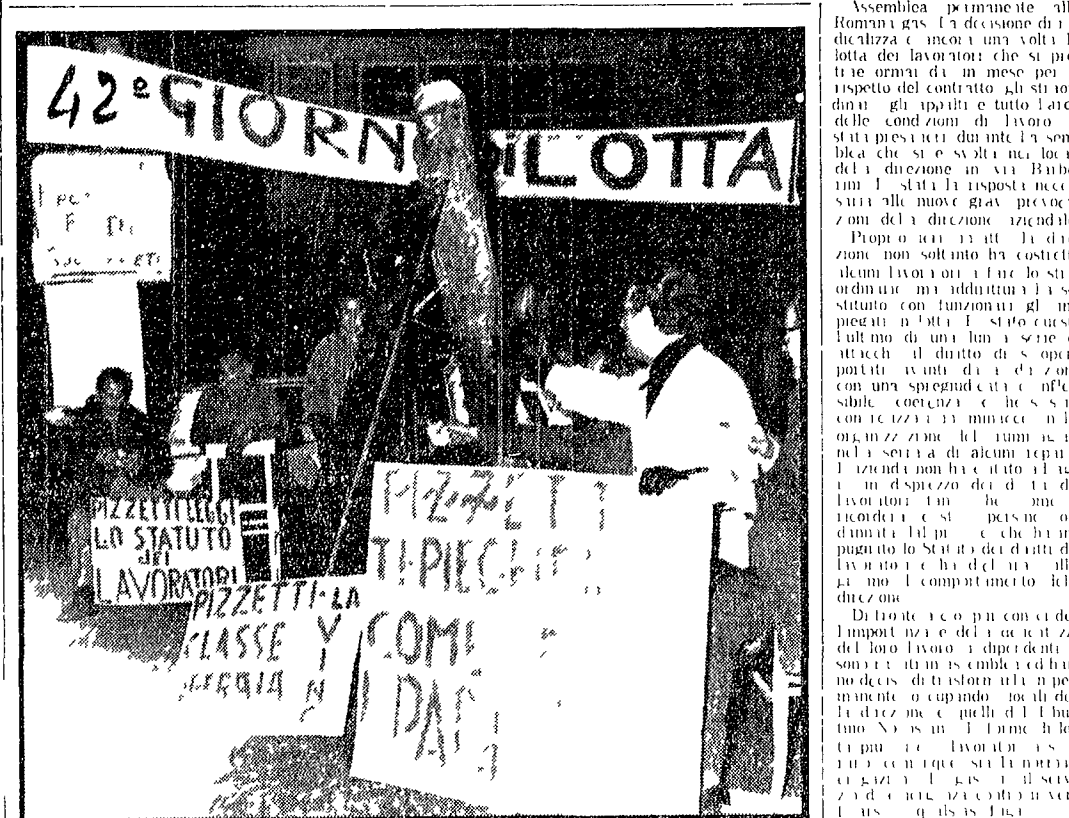
Si estende la solidarietà con gli operai in lotta

La decisione dei lavoratori per le continue provocazioni della direzione — Oggi bloccato il centro produttivo all'Ostiene — Questa mattina un incontro fra le parti