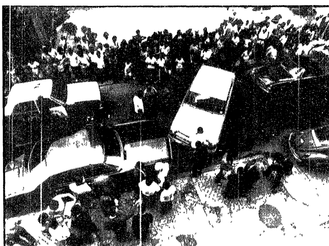
Gigantesca caccia all'uomo a Rio de Janeiro. Ventimila uomini, fra soldati e poliziotti, stanno allungando la più vasta caccia all'uomo che abbia conosciuto lo stato di Rio de Janeiro nel tentativo, fin qui vano, di rintracciare i rapitori dello ambasciatore svizzero Bucher. I rapitori avrebbero chiesto la liberazione di 70 detenuti politici in cambio della libertà di Bucher. I rapitori chiedono anche che il governo metta fine alle torture dei prigionieri che adesso mullano e uccidono.

Il congresso dei poligrafici CGIL ha precisato la linea di lotta per il prossimo anno. Le rivendicazioni principali sono: aumento del salario, miglioramento delle condizioni di lavoro, lotta contro la disoccupazione.