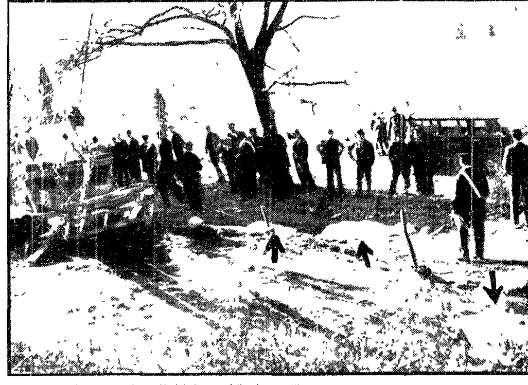
La teleferica schiantata a terra. Visibili i corpi delle cinque vittime