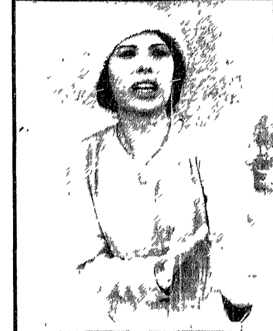
La cantante Rosanna Fratello ha esordito quest'anno nel cinema, vestendo i panni della moglie di Sacco...