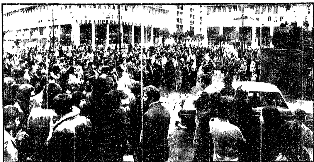
Una forte manifestazione antifascista si è svolta ieri mattina in piazza S. Giovanni Bosco per iniziativa del PCI, DC, PSU, PSI e PSIUP. Hanno ascoltato le parole degli oratori migliaia di persone, convenute nella piazza del popolare quartiere di Cinecittà per esprimere il loro sdegno contro la vile provocazione tentata da gruppi leppisti missini e per esprimere la loro protesta contro il regime franchista e il processo di Burgos.