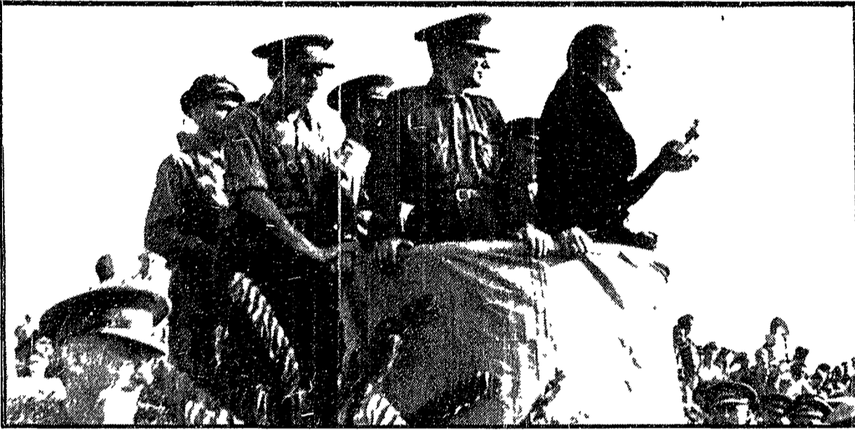
A SINISTRA: Dolores Ibarruri, oggi presidente del Partito comunista spagnolo, parla da un palco improvvisato agli uomini delle Brigate Internazionali. Alla sua sinistra è il generale Walter (Karol) Swierczewski.

Appello alla lotta ed alla solidarietà con i patrioti baschi - In Spagna si sono ormai create le condizioni di una nuova unità contro la dittatura L'esperienza della Catalogna e gli obiettivi del Partito Comunista Spagnolo - L'impegno di oggi e quello degli anni della guerra civile - I saldi legami con i comunisti italiani - Ricordo di un incontro con Togliatti nel marzo del '39 - «Un uomo di grande capacità politica, un conoscitore delle masse»