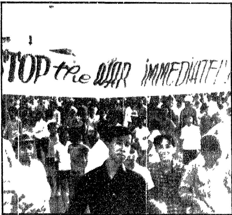
A Qui Nhon, dopo l'uccisione di uno studente

La forte azione era stata deplorata dal TUC - Non sono usciti i giornali, bloccati i porti, rimasti inattivi molti reparti delle industrie automobilistiche - «Una decisione collettiva della base operaia in difesa dei fondamentali diritti sindacali»; così il presidente del Comitato organizzatore, il compagno Halpin, ha definito la «giornata d'azione» che si ripeterà il 12 gennaio