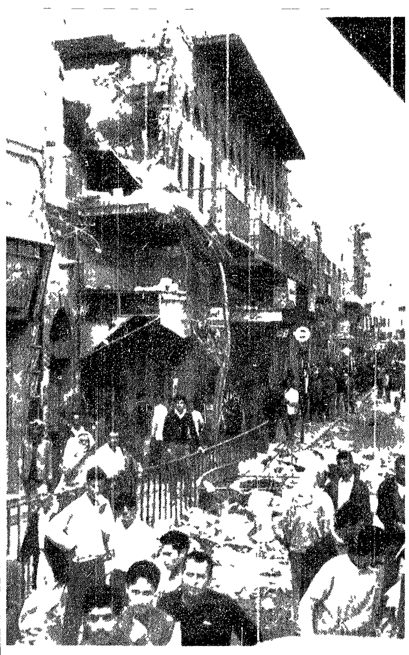
AMMAN — Una strada della città dopo l'attacco delle truppe reali ai feddayn