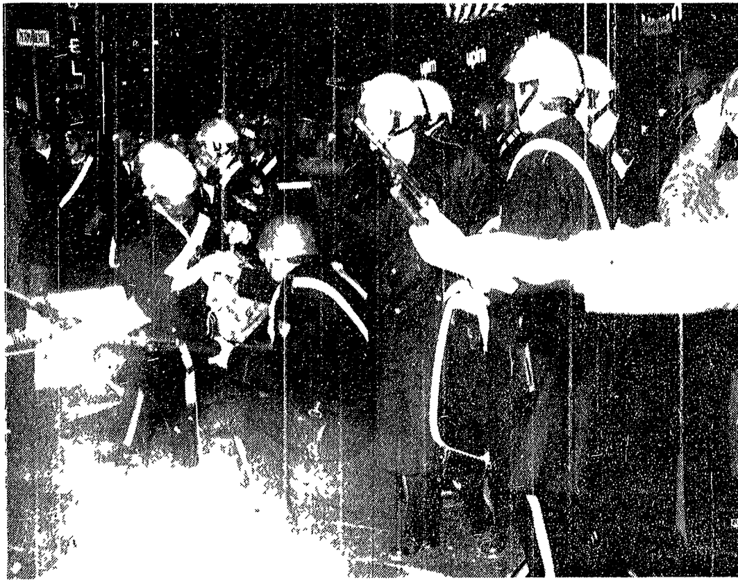
I carabinieri si preparano alla carica in via Torino. Un gruppo che segue le bandiere anarchiche ha appena imboccato la strada. Dai tre scappano i lacrimogeni. È sabato sera, le vie del centro sono affollate di gente che si troverà coinvolta negli incidenti

Le testimonianze di una dirigente democristiana e di un passante ferito da un colpo di arma da fuoco - Le contrastanti versioni dei sanitari