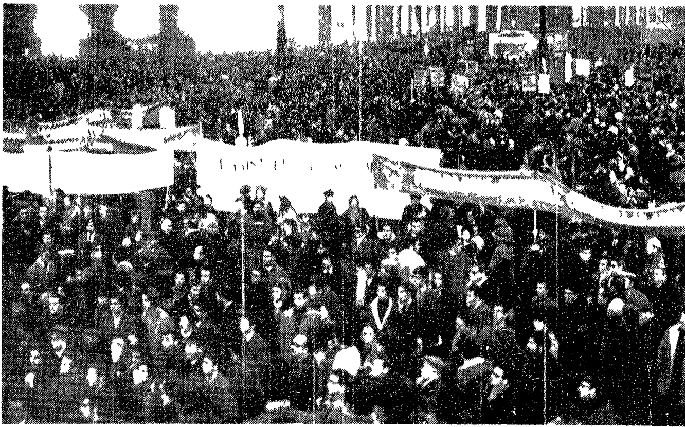
Questa è un'immagine della piazza del Duomo di Milano nel momento culminante della grande manifestazione unitaria antifascista e antifascista. Una folla straordinaria in grande e civile corteo un comizio di massa. Poco dopo scatterà il meccanismo della provocazione.

E ora di far luce, di colpire e di sciogliere le associazioni le formazioni di destra, espressamente vietate dalla Costituzione, le quali dichiarano esse stesse di star fuori e di voler sovvertire l'ordine costituzionale e ora di disperdere i centri delle manovre provocatorie e avventuristiche annidati nell'apparato statale.