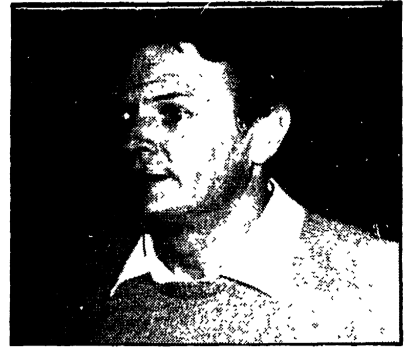
MILANO — Era un corriere dei trafugatori di capitali all'estero l'uomo che l'altra mattina è stato rapinato di ben 127 milioni, una goccia del fiume d'oro che parte per la Svizzera. Nonostante le sue proteste, oramai non vi sono più dubbi: il Colombo (nella foto) non era d'altronde al suo primo viaggio. Forse proprio perché conosciuto come « uomo-cassaforte » di miliardari senza scrupoli, è stato atteso al varco dai rapinatori. A PAGINA 5