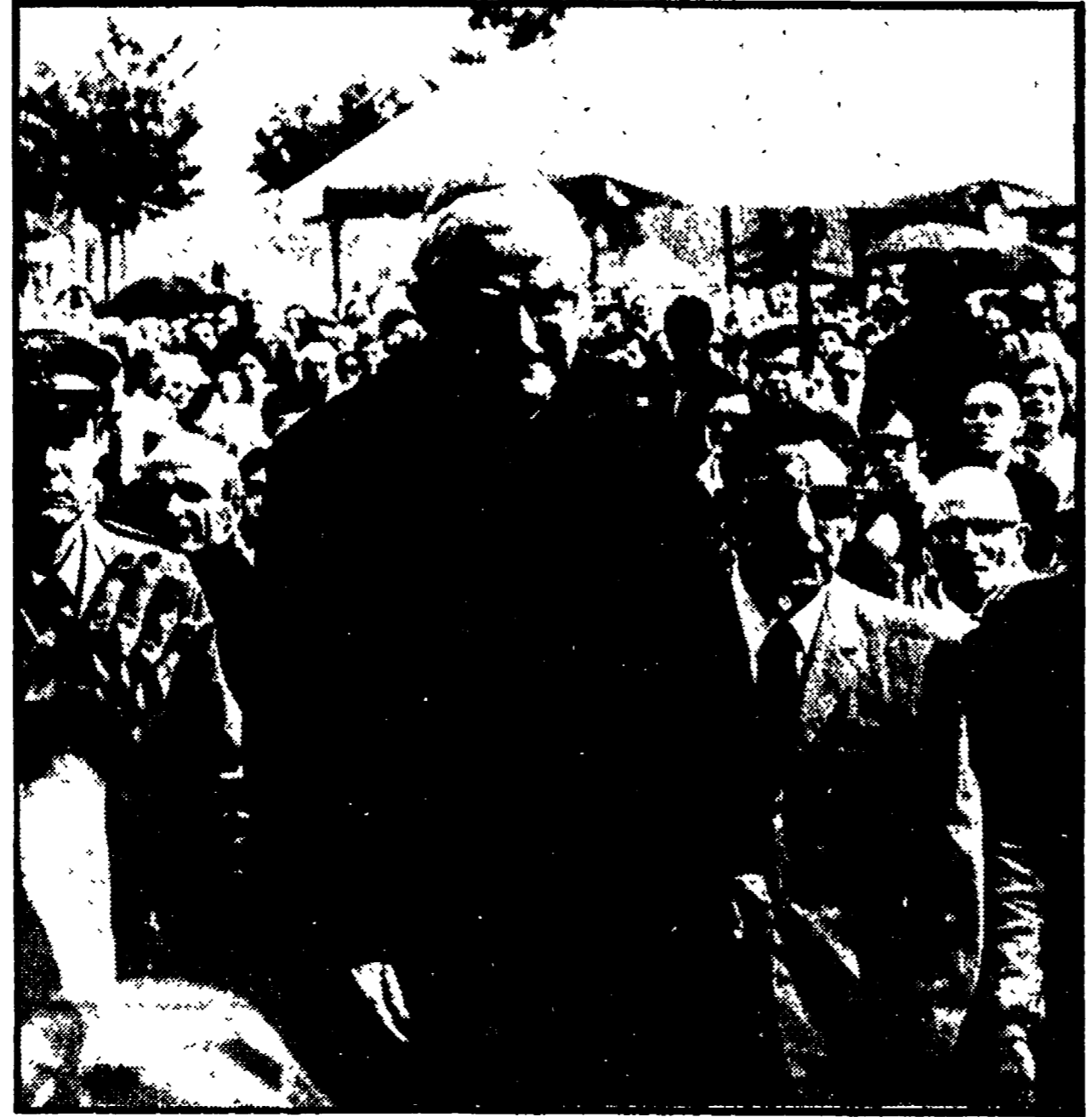
Il cardinale Florit, accompagnato dalla forza pubblica, alla «riapertura» della chiesa parrocchiale dell'Isolotto

Sono stati interrogati ieri Consigli e Protti, due imputati laici - Le pressioni contro Don Mazzi e la comunità - Il ruolo di mons. Panerai - Rinnovata la richiesta della difesa di ascoltare l'arcivescovo