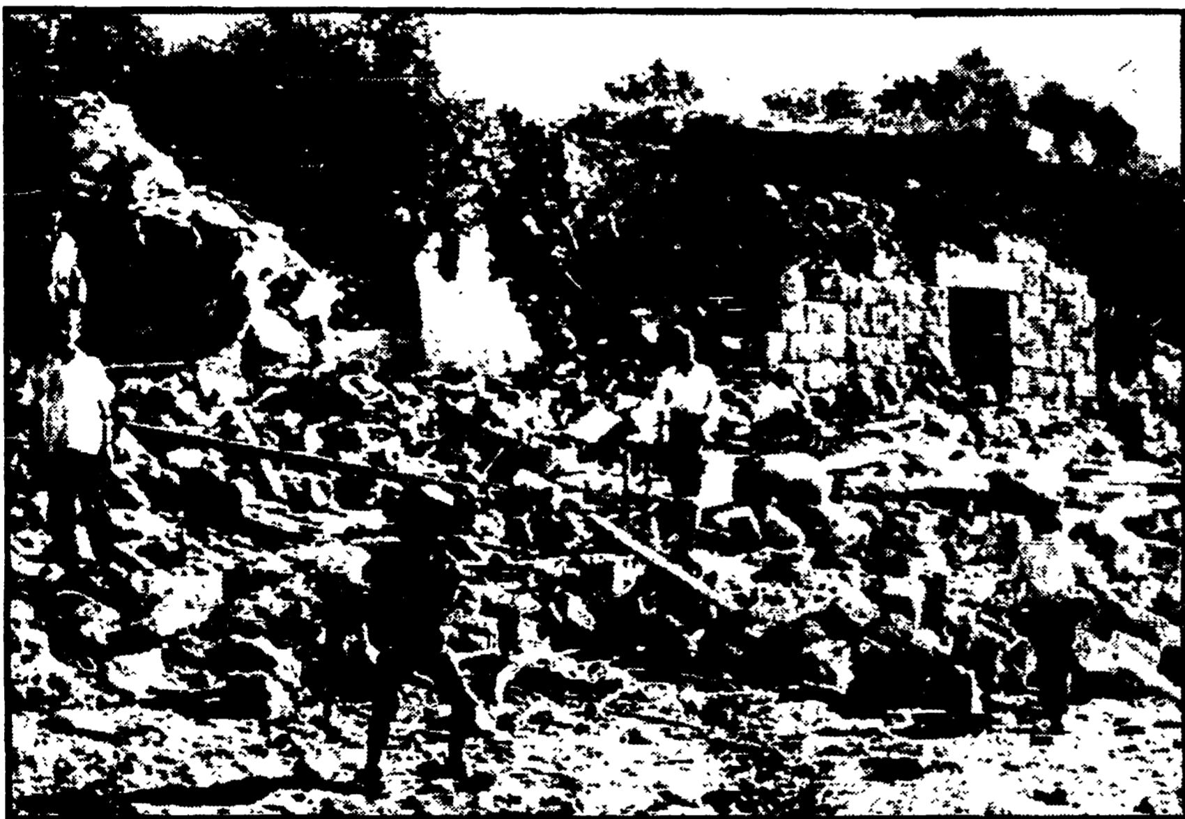
TEL AVIV — Sparatorie sul Giordano e nelle alture del Golan. Razzi sparati dai guerriglieri palestinesi sono caduti nella città di Beisban, situata nella valle del Giordano. Secondo un portavoce di Tel Aviv, essi hanno provocato solo danni materiali. Le truppe israeliane hanno risposto al fuoco. I razzi sono stati sparati dal territorio a est del Giordano e dopo l'attacco — secondo quanto hanno detto gli israeliani — forze giordane sono state viste rastrellare la zona da cui avevano agito i guerriglieri. L'altra sparatoria è avvenuta, in due riprese, nella « terra di nessuno » del Golan dove una pattuglia israeliana si è scontrata per due volte con un gruppo partigiano. La pattuglia non avrebbe subito perdite. Nella foto: le case del villaggio di Yarun, nel Libano meridionale, dopo l'attacco israeliano.

l'incertezza è la nota dominante dello scontro postelettorale all'interno del quadripartito. E questo vale soprattutto per la DC, che domani si troverà dinanzi alla prima sanatoria politica con la riunione della Direzione dedicata all'esame dei risultati del 13 giugno ed alla situazione politica nei quali essi si collocano.