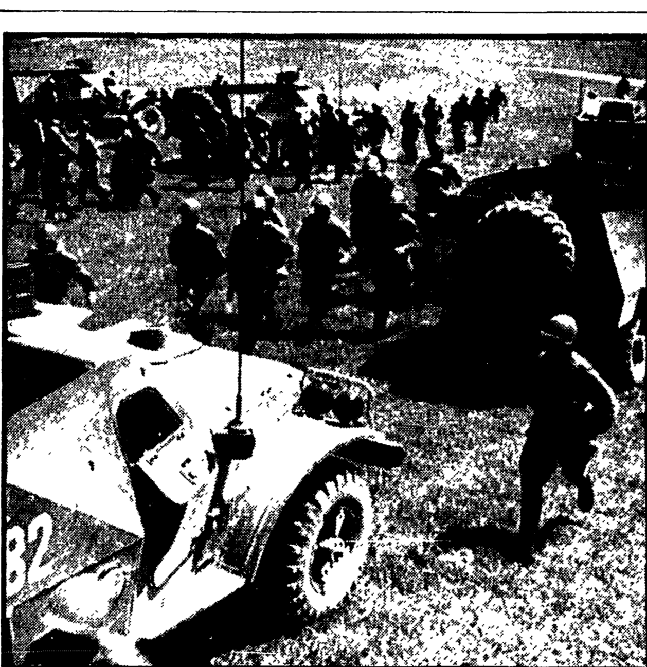
MANOVRE MILITARI IN URSS. Sono in corso nell'Unione Sovietica delle esercitazioni militari a largo raggio che vedono impegnati reparti dell'esercito ed unità della marina in operazioni di attacco, trasporto e sganciamento simulato.

TEL AVIV, 22. Il ministro degli Esteri israeliano Abba Eban ha smentito le notizie, apparse sulla stampa di Tel Aviv, secondo le quali sarebbe prossima una ripresa delle relazioni fra Israele e l'Unione Sovietica.