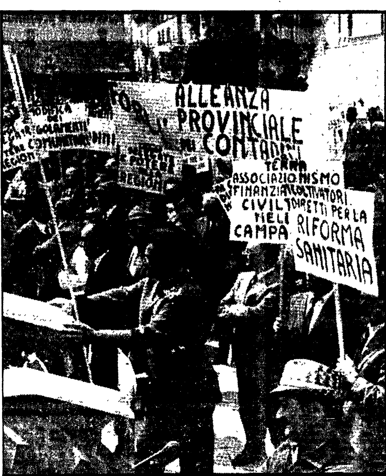
LA LOTTA IN EMILIA. In Emilia gli agrari hanno richiesto quasi ovunque la trattativa. La forte lotta che si è sviluppata in questi giorni ha costretto il padronato ad abbandonare le pregiudiziali...