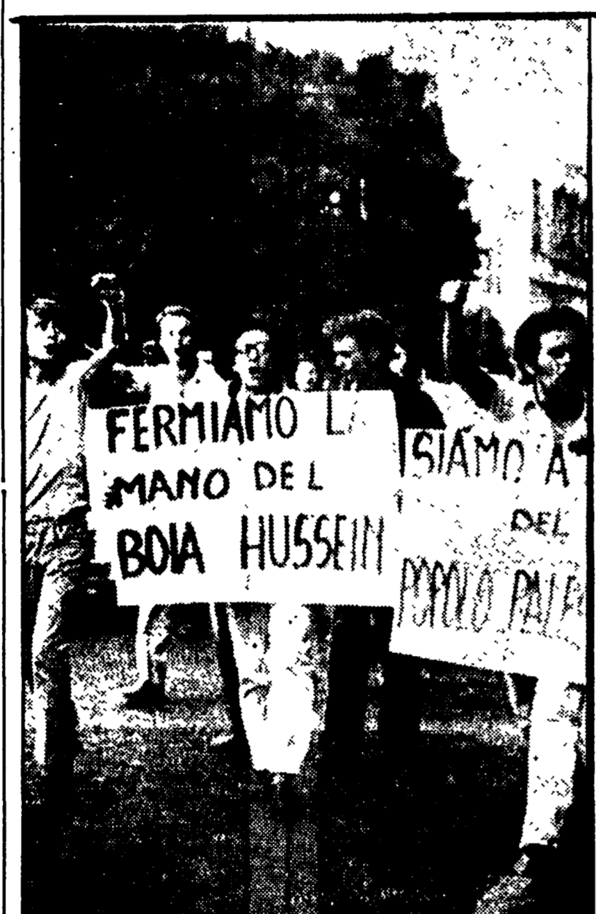
Una recente manifestazione di giovani comunisti romani davanti all'ambasciata giordana