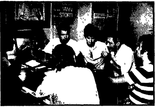
Lavoratori del cantiere Belli mentre spiegano i motivi della loro lotta: i padroni vogliono instaurare un clima di autoritarismo e repressione