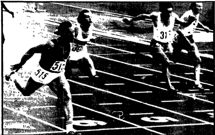
HELINSKI — L'arrivo della finale dei 100 metri piani vinta dal sovietico Borzov (il primo a sinistra)

Meno gente di ieri allo stadio olimpico oggi per la seconda giornata dei campionati europei di atletica leggera. Evidentemente dopo la sbornia colossale di ieri i finlandesi hanno voluto dormire un po' più a lungo questo pomeriggio. La temperatura è di 17 gradi e l'umidità non scarsa del 75 per cento. Il cielo è ancora più luminoso di ieri, spirano venti trasversali con componenti leggermente favorevoli ai concorrenti femminili e maschili impegnati nelle semifinali del cento metri. Merito della Dionisi superando alla prima prova i 4,80 che i 5 m si è agevolmente qualificato per la gara vera e propria del salto in alto. La Simeoni si qualifica per la semifinale del salto in alto. La Simeoni si qualifica per la semifinale del salto in alto. La Simeoni si qualifica per la semifinale del salto in alto.