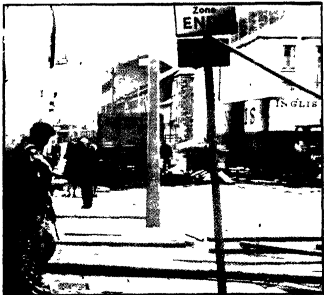
BELFAST — Un aspetto desolato della città dopo i violenti disordini e le stragi. Un soldato inglese di guardia nei pressi di una panetteria, nella zona del mercato di Belfast

I morti sono ormai ventidue - Nove ore di sparatoria nei pressi di Eliza Street - Un panificio occupato da un « commando » dell'IRA - Immensi i danni all'economia della regione - L'assurdità della « linea dura » adottata da Londra - L'ex direttore del « New Statesman » paragona la situazione irlandese alle repressioni imperialistiche classiche - Fischiate a Londra il ministro degli Esteri dell'Eire - Dramei quasi tremila i profughi