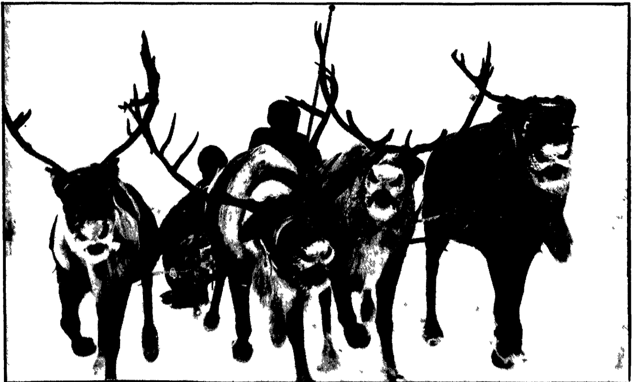
MIRNI (Jacuzia) — La corsa in slitta