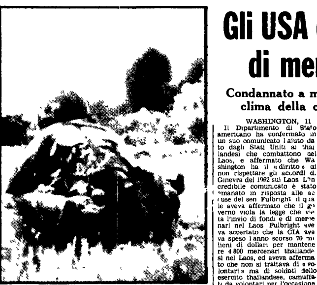
CAMBODIA - Una ennesima operazione « terra bruciata » delle truppe dei fantoccio vietnamiti. Cambogia. Nella foto un soldato assiste agli effetti delle bombe e del napalm su un inerme villaggio.

« Washington si arroga il « diritto » di violare gli accordi di Ginevra » - Il Dipartimento di Stato americano ha confermato in un comunicato l'aiuto dato dagli Stati Uniti ai vietnamiti che combattono nel Laos.