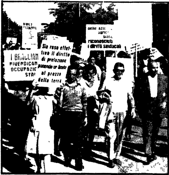
Manifestazione di braccianti e contadini emiliani

Vasta mobilitazione in tutta la provincia - Astensioni generali dal lavoro in numerosi comuni - La solidarietà degli operai, degli artigiani e dei commercianti - Maldestri tentativi degli agrari di prendere ancora tempo