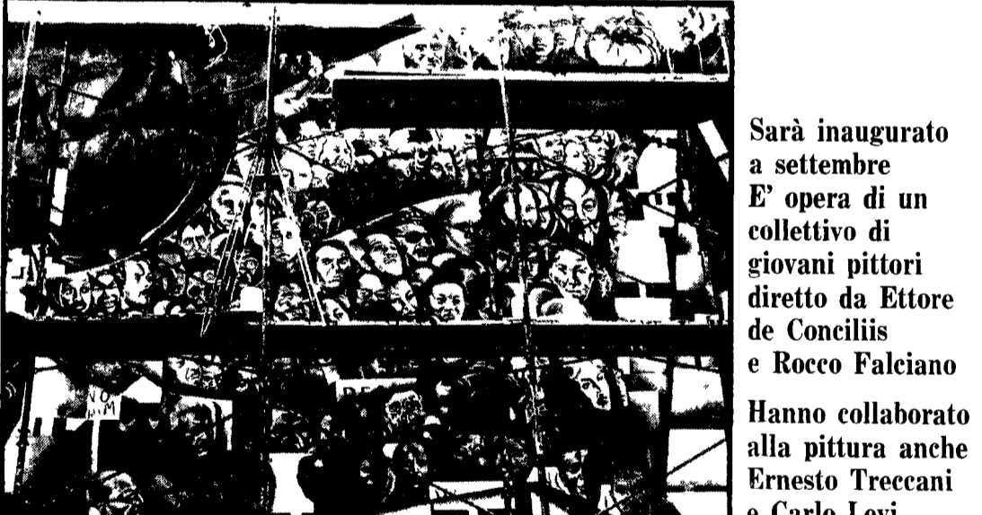
Un particolare della pittura murale realizzata a Fiano Romano