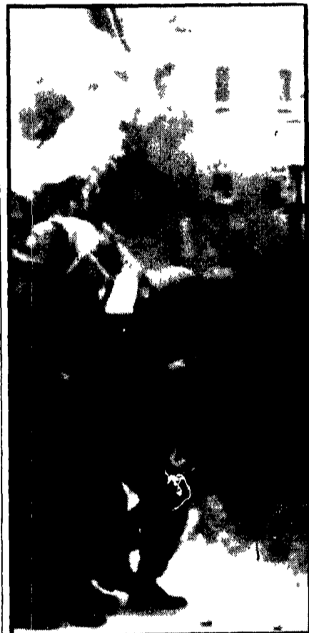
BELFAST - Due soldati inglesi si riparano mentre una bomba esplose ai loro piedi