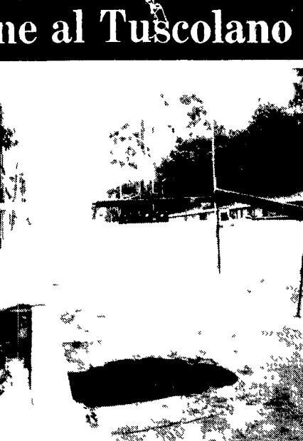
Voragine al Tuscolano. Una voragine larga alcuni metri si è aperta improvvisamente ieri pomeriggio in via Umberide, al quartiere Tuscolano, all'altezza dello stabile conflagrato dal numero 54. Per fortuna il fondo stradale ha ceduto in un momento in cui la strada era quasi deserta. Alcuni passanti si sono accorti di quanto era accaduto e hanno avvertito i vigili urbane o un nuovo sopralluogo.