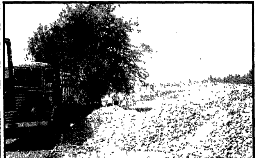
La capitale europea della frutta è diventata anche la capitale della distruzione di pere e pesche. Sotto i cingoli dei trattori non sono finite a tonnellate malgrado gli impegni assunti dal governo per evitare questo assurdo massacro...

Importante convegno nella città emiliana presenti assessori di numerose amministrazioni, rappresentanti del governo, il direttore dell'AIMA - Tonnellate di pesche e pere mandate al macero per non calare i prezzi