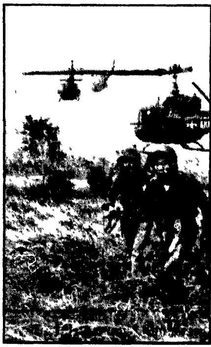
Un'azione di soldati del Sud-Vietnam trasportati con elicotteri americani

guerra civile rappresentano ormai una minoranza. Specialmente al livello dei generali e maggiori e in parte dei colonnelli. Tra i generali della « casta » dei « compagni d'armi » di Franco — quasi tutti nella riserva — va appena più in là della presenza ai funerali dei colleghi. I militari « casti » che hanno studiato che hanno in questi giorni le nuove teorie che militari che aspirano a una « testa pensante » e possibile che in Spagna si produca un conflitto di carattere sovversivo e ha solo menzionato l'eventualità di un intervento dell'esercito nel caso che « dall'esterno » sia messa in pericolo « l'integrità del territorio nazionale ».