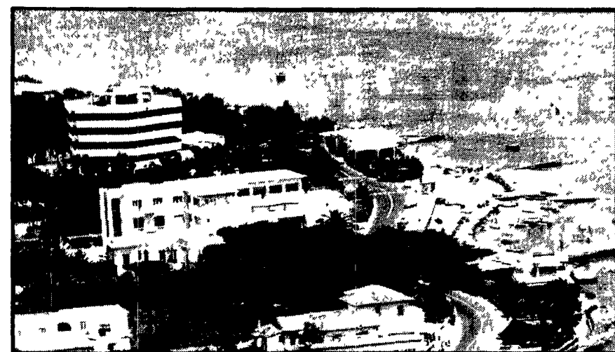
Complessi alberghieri e ville hanno letteralmente invaso il Circeo compromettendo irrimediabilmente un prezioso patrimonio naturale

Pesanti responsabilità delle autorità locali e di governo - Le denunce dei comunisti - Trecento ville fuorilegge - L'azienda demaniale di Stato «contribuisce» alla distruzione del patrimonio