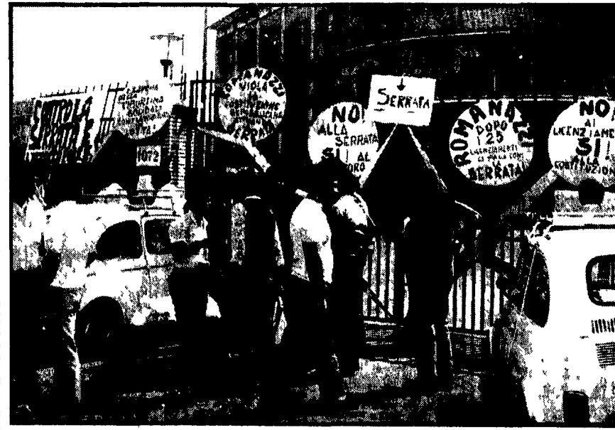
Lavoratori delle Romanazzi davanti alla fabbrica, l'azienda non ha ancora revocato la provocatoria serrata

Mentre domani le fabbriche occupate (Metalfer, Aerostica, Filodotti Cartier)