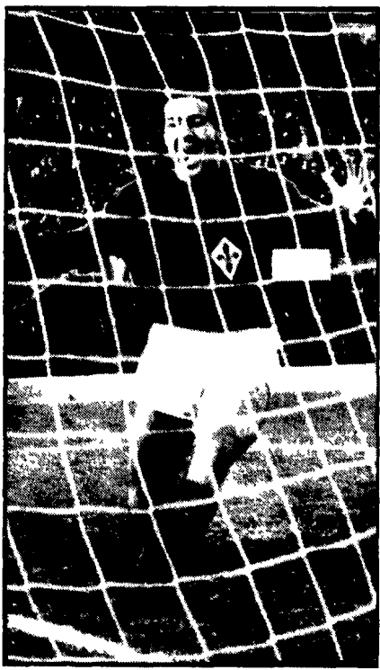
Chiarugi rischia di essere estromesso per il suo individualismo

Negli altri quattro gironi infine la situazione appare più fluida