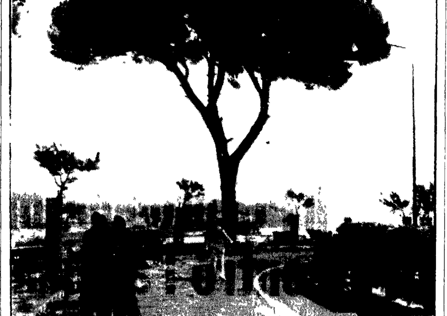
LA FINE DEL «PINO DI NAPOLI»

Genova 7. Il Consiglio comunale di Genova si riunirà nuovamente il 20 settembre per l'elezione del Sindaco. La seduta di ieri protrattasi fino a notte fonda è finita conclusa con una nulla di fatto.