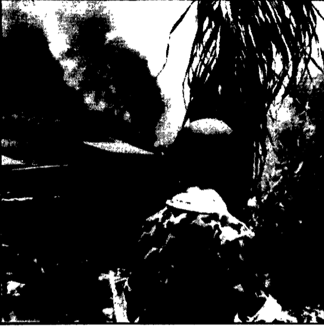
Truppe del governo fantoccia cambogiano sparano sulle case di un villaggio, già in fiamme a causa dei bombardamenti aerei americani.

SAIGON, 7. Una nuova incursione dei bombardieri USA nel Vietnam del Nord — la cinquantasesta dal 1° gennaio di quest'anno, secondo ammissioni del comando americano — è stata effettuata oggi da un ricognitore RF-4 e due caccia-bombardieri F-4, di scorta al primo. I tre apparecchi sono penetrati nel territorio della RDV per 82 chilometri, sganciando un intero carico di bombe contro una postazione radar che si trovava inquadri. Naturalmente, con un'operazione che sarebbe risultata non si riferisce ad avvenimenti tragici, il comando americano ha dato notizia del nuovo atto di pirateria definendolo una « reazione protettiva ». Nel paese è stato chiarito, tuttavia, che bisogna distinguere gli aerei USA di addebi, a « proteggere » nello spazio aereo nordvietnamita.