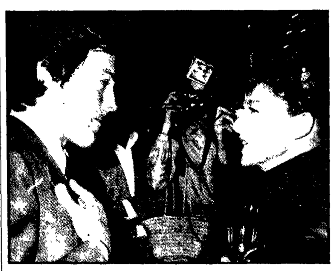
PARIGI — Cordiale incontro tra Katharine Hepburn e Alain Delon durante un ricevimento in un noto hotel del Faubourg Saint Honoré a Parigi, in occasione della presentazione al giornalisti della capitale francese del film «Le Troiane» di Cecy Annans.