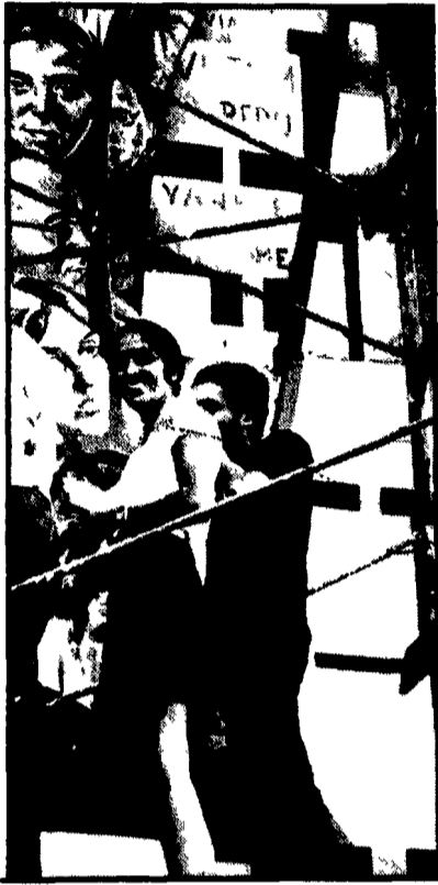
FIANO — Joan Baez accanto al suo ritratto