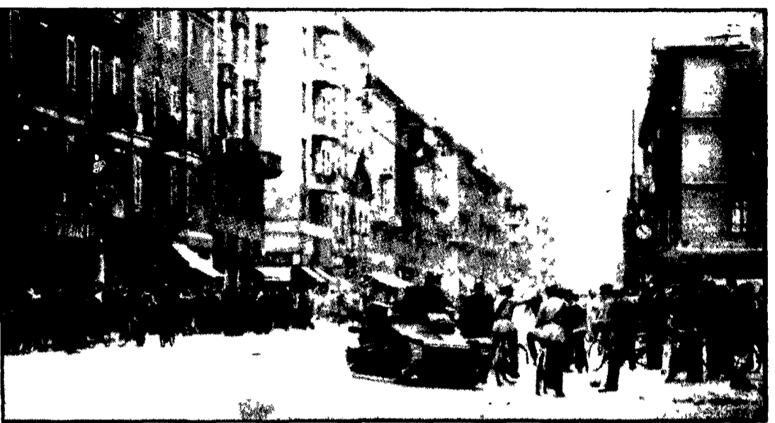
In corso Buenos Aires, a Milano, il 9 settembre 1943 folla e soldati nel clima caldo creato dall'annuncio dell'armistizio