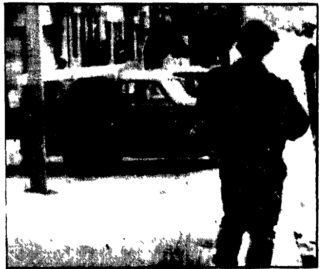
A poche ore di distanza dalla clamorosa fuga di 111 «Tupamaros» dal carcere di Montevideo...