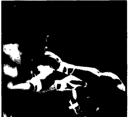
Emilio Griffith, battuto sabato sera dal pugilato, l'argentino Carlos Monzon...

Ma chi può prevedere il rendimento di Rivera e sovrattutto quali sono le cause del suo declino?