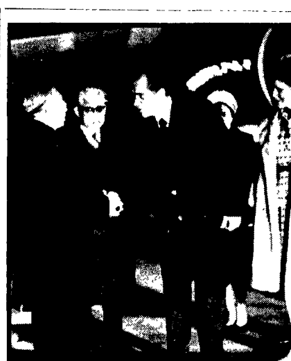
Imperatore del Giappone, dopo essersi incontrato con Nixon ad Anchorage (Alaska), è giunto ieri in Danimarca, accolto da re Federico e dalla regina Ingrid.

La posizione statunitense suscita stupore e preoccupazione scrive l'organo del partito religioso Hatzofe. A sua volta, il Donor scrive che Israele ha espresso la sua delusione e il suo disappunto per la soluzione svolta dal governo americano circa la risoluzione votata dal Consiglio di Sicurezza.