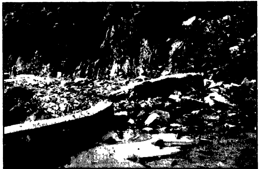
Disastroso inizio d'autunno nel Cagliaritano: sono bastati tre giorni di pioggia perché centri e campagna, già disastrati da precedenti alluvioni, sono stati in parte ricoperti da frane e rovine. In alto: frane e rovine di case a Serrabus. In basso: frane e rovine di case a Serrabus. In basso: frane e rovine di case a Serrabus.

Particolarmente colpite le zone del Serrabus - Case crollate, frane, fiumi straripanti, colture distrutte - Da tre giorni temporali ininterrotti