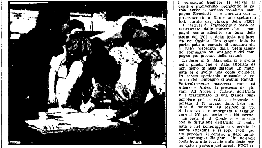
Cittadini firmano la petizione contro il carovita durante la manifestazione che si è svolta alla Nuova Magliana

Adesione di massa alla petizione contro il carovita - Superato l'obiettivo della diffusione con trentacinquemila e trecentocinquanta copie - Nuovi successi nel tesseraamento e nella sottoscrizione - In città e in provincia si sono tenute 24 feste dell'Unità