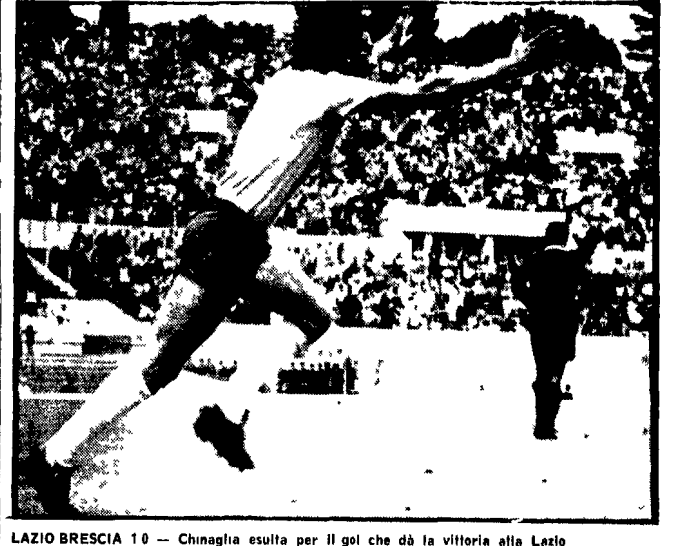
LAZIO BRESCIA 10 - Chingaglia esulta per il gol che dà la vittoria alla Lazio