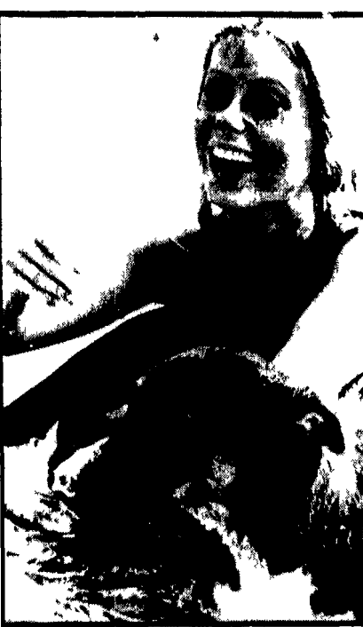
Catherine Deneuve sta interpretando in questi giorni sulle coste sardi il film «Melampo» diretto da Marco Ferreri. Nel film, la Deneuve sostiene il ruolo di una donna follemente innamorata, al punto di acciacciare alle bizzarre manie del suo uomo (Marcello Mastroianni) che la porta addirittura al guinzaglio, come un animale domestico. Ed ecco Catherine, nella foto, con il cane Melampo, un quadrupede che fa parte del cast e che, peccato, sembra malgini, è un po' la controfigura della bella attrice francese.