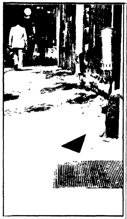
La freccia indica il tombino attraverso il quale i ladri hanno raggiunto gli uffici della Confindustria

Gli sconosciuti sono penetrati nell'edificio attraverso un chiusino per lo scarico del carbone - Neutralizzato un complesso congegno d'allarme - Scippo in via Luisa di Savoia - Donna rapinata a Tivoli