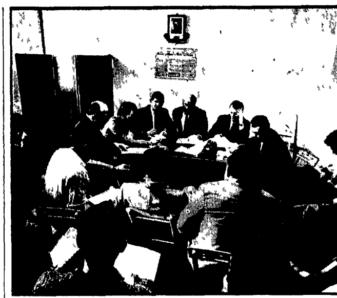
Un momento di una delle riunioni che si sono svolte nei giorni scorsi a Milano, Torino e Roma fra delegati delle fabbriche Pirelli-Dunlop inglesi e delegati della Pirelli-Biococca, per decidere azioni unitarie contro i programmi di ristrutturazione dell'azienda che colpiscono sia i lavoratori italiani che quelli inglesi.

Investimenti alla rovescia per "incoraggiare" i lavoratori ad abbandonare la produzione. Con Pirelli in testa essi assumono la gravissima responsabilità di bloccare la produzione pur di contenere il movimento dei lavoratori. Contro una politica fondata esclusivamente sulla ricerca del massimo profitto chiediamo una nuova politica economica basata sulla piena occupazione sul rinnovamento tecnologico, sull'aumento dei redditi di lavoro e quindi sull'espansione dei consumi, sulle riforme e contro gli sprechi e i disservizi che derivano dalla mancata attuazione delle riforme stesse».