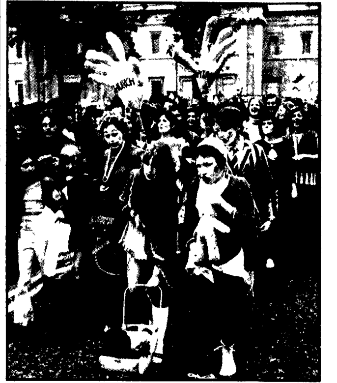
Il «movimento per la liberazione della donna» ha organizzato, a Londra, una marcia di protesta nel quadro del «Festival anti porno» che si è svolto a Trafalgar Square. L'obiettivo contro cui puntava la feroce sa- tira delle manifestanti durante la sfilata per le vie di Londra era la pornografia, intesa co- me strumento di repressione e di subordina- zione della donna ad una società basata sullo sfruttamento e sul profitto. Efficaci allegorie (come si vede nella foto) la donna sono inca- tenate, e le catene tenute da due grandi mani che rappresentano «la chiesa» e «il capita- le» hanno reso chiari questi concetti.