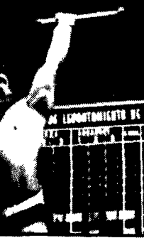
Vasily Alexeev, il sovietico che ha battuto due primati mondiali nel supermassimo