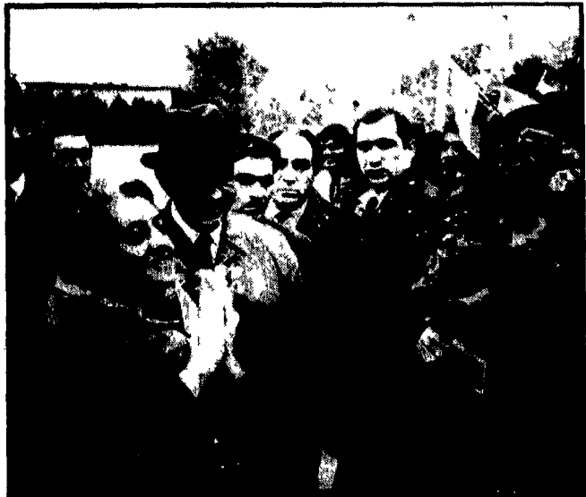
Il primo ministro indiano Indira Gandhi è giunto ieri a Mosca per una visita ufficiale di tre giorni, su invito del governo sovietico. La signora Gandhi avrà colloqui con Kossighin, Breznev e Podgornij. NELLA FOTO Indira Gandhi all'aeroporto insieme al primo ministro sovietico Kossighin