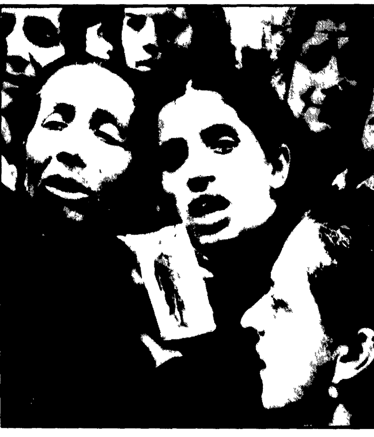
Donne di Napoli piangono un patriota caduto durante le «quattro giornate»

E il 4 settembre. Dopo un baratro bombardamento a tappeto delle forze volanti la radio annuncia l'armistizio. Il popolo esultante si riversa nelle strade. Ma le esultanze non durano a lungo. Il giorno successivo i tedeschi cambiano faccia e atteggiamento si preparano ad occupare la città.