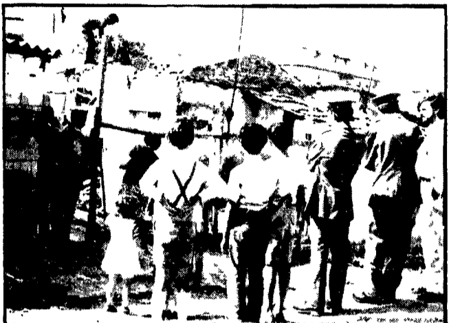
Centotré famiglie del Borghetto Latino lasciarono al Comune un alloggio in affitto. Altre 150 famiglie restano ancora nella «baracca»...

Centotré famiglie di Borghetto Latino hanno avuto in affitto dal Comune un alloggio - Altre 150 restano ancora nel ghetto