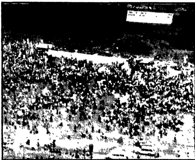
TOKIO - Decine di migliaia di lavoratori e di studenti hanno partecipato ad un grande comizio presso la base americana di Yokota, nei sobborghi della capitale, organizzato per protestare contro l'accordo che consente agli Stati Uniti di mantenere le loro basi a Okinawa...