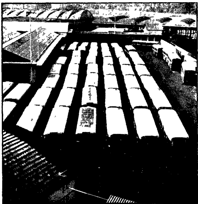
Automezzi dell'ATAC fermi nel deposito di Montesacro durante lo sciopero

Le provocazioni di Zeppieri e Albicini hanno fatto perdere ai pendolari centinaia di ore di lavoro - Il ricatto al ministero - Si chiede la revoca immediata delle concessioni ai due boss - Impegni della Regione - Protestano i tranvieri ATAC Montesacro contro le disastrose condizioni delle vetture