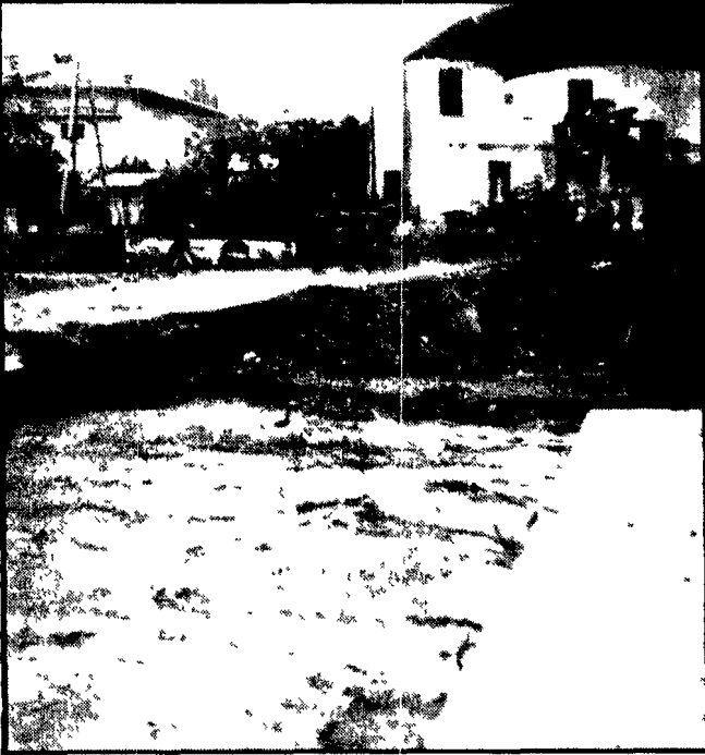
Una voragine aperta, a causa delle fortissime piogge, in una strada di una città calabrese