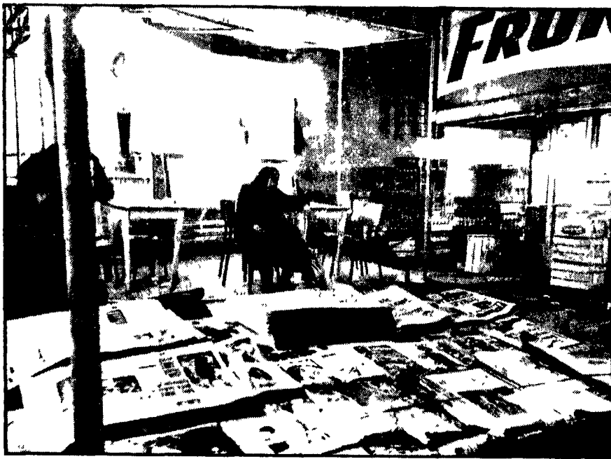
ISTAMBUL - Stazione di sosta per autobus: una immagine contrastante della Turchia d'oggi