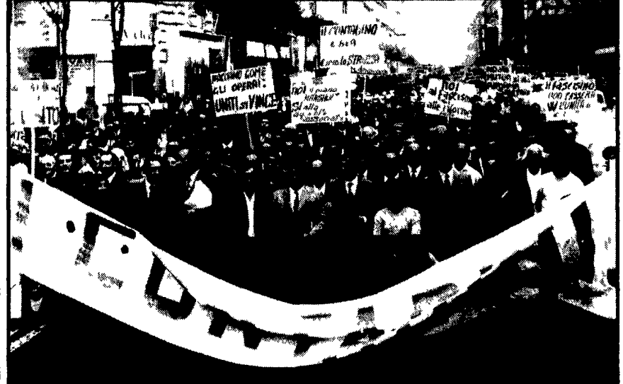
NAPOLI — La manifestazione dei contadini campani per il rispetto della legge su fitti agrari

Ieri fermate dei tessili a Pordenone, Sondrio, Verbania e in altre province; bloccate le fabbriche SAVA di Porto Marghera; scioperi cittadini; manifestazioni dei contadini campani - Da oggi la settimana di lotta di centomila lavoratori napoletani - Domani corteo degli edili, dei tessili e dei vetrai romani - Zanussi, Fiat e Pirelli: lavoratori e sindacati decidono nuove iniziative