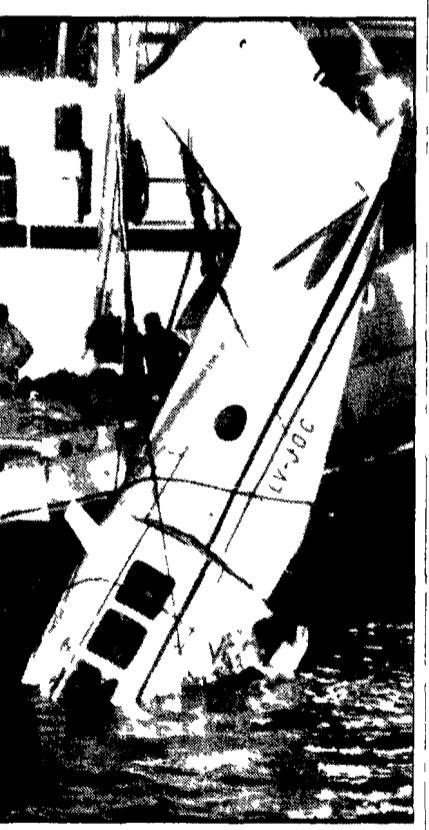
Buenos Aires, 11. La più acclamata ballerina argentina Norma Fontenla è tra gli otto danzatori sono rimasti uccisi in una sciagura aerea. Il bimotore precipitò nel Rio de la Plata.

Fra le 9 vittime la celebre Norma Fontenla - All'aereo si sono bloccati i motori - E' precipitato nel Rio de la Plata