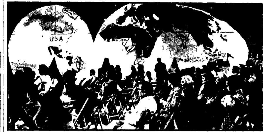
La festa dell'Unità a Borgo Prati, il pannello illustra la dislocazione delle basi militari USA nel mondo