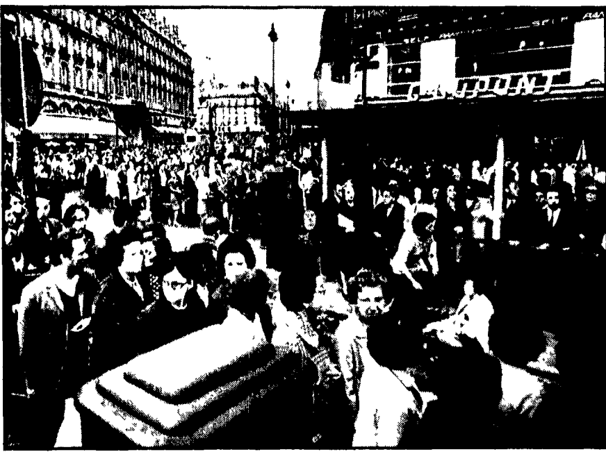
PARIGI Continua lo sciopero degli addetti al «metro». Lunghe file di viaggiatori attendono gli autobus di emergenza

Previste invece alla fine la posizione di Lanusse e del ministro degli Interni Arturo Mor Roig e gli insorti furono definiti «di destra» «fascisti» e «antipopolari». Si trattava di una «cristiana» e «socialista» di sinistra. «L'Unità» ha un linguaggio militare che sarebbe stato giudicato esile e non è stato in grado di spiegare le ragioni di questo scoppio e denunciare le responsabilità della direzione della società nazionalizzata dei trasporti urbani.