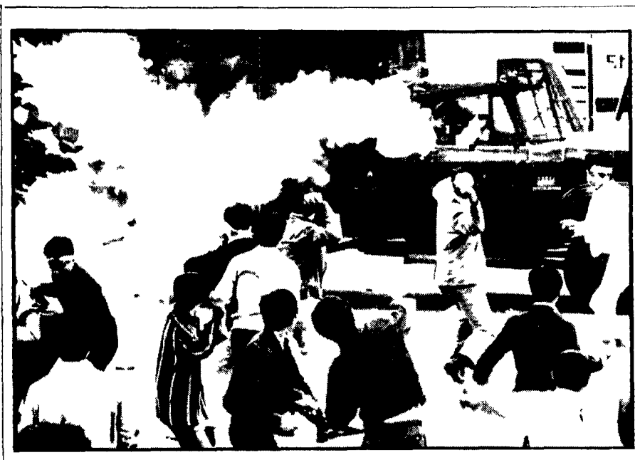
Violenti scontri a Seul fra studenti e polizia