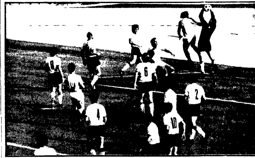
LAZIO NOVARA 5-2. Una fase del match con ben nove piemontesi asserragliati in area

Nell'ambito delle attività del CISM (Consiglio internazionale degli sport militari) domani con inizio alle 15 si svolgerà allo stadio comunale dell'Aquila un incontro amichevole di calcio tra le rappresentative militari d'Italia e d'Olanda.