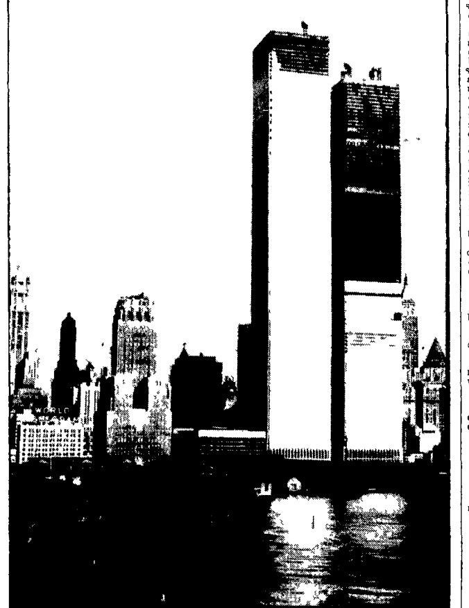
Quando saranno completate nel 1973, le torri gemelle del World Trade Center di New York saranno i più grattacieli del mondo. Con i loro 564 metri di altezza (30 metri più del "Empire State Building") domineranno il panorama dei grattacieli di Manhattan. Il loro costo è fissato sui 600 milioni di dollari.