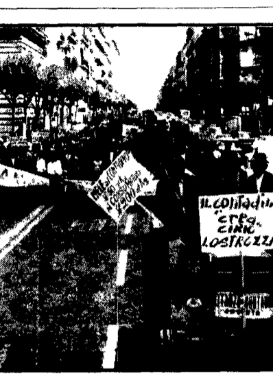
Dalla redazione NAPOLI 11. Una imponente manifestazione dei contadini campani per la rivendicazione della legge sui fitti agrari.

La manifestazione nel capoluogo promossa dalla Alleanza - Rivendicata la legge sui fitti agrari