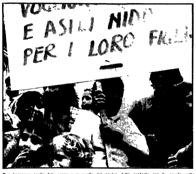
Due immagini (nella foto sopra e in quella del titolo) della protesta per la scuola sulla piazza di Campidoglio

Una richiesta precisa: lo sblocco dei 35 miliardi congelati permetterebbe la costruzione di numerose scuole (sono 99 i progetti) e l'occupazione di numerosi edili - Delegazioni ricevute da funzionari - Un volantino della Federazione comunista romana