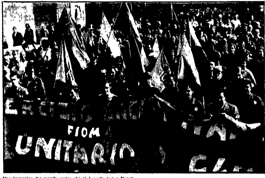
Una immagine del grande corteo che si è svolto ieri a Napoli

Decine di migliaia di lavoratori romani scendono oggi in piazza per l'occupazione e le riforme. Il blocco dei mezzi di trasporto, lo sviluppo economico, la lotta per il lavoro, per i diritti dei lavoratori, per la difesa della fabbrica, per la difesa della città, per la difesa della regione, per la difesa della nazione, per la difesa del mondo.