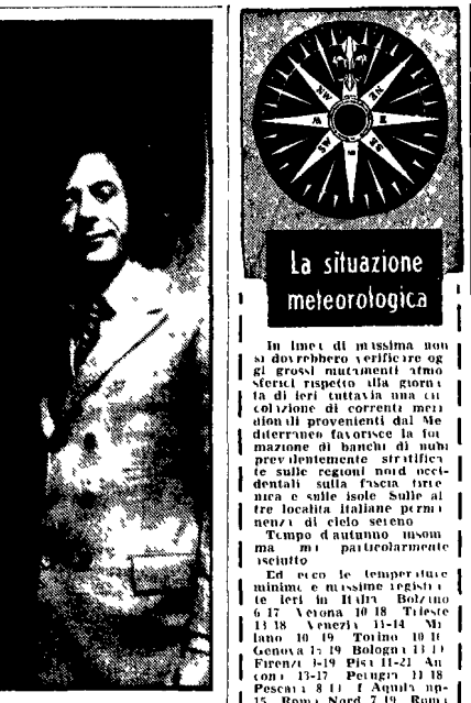
La situazione meteorologica. In linea di massima non si dovrebbero verificare grandi variazioni di temperatura. Temperature minime e massime registrate ieri in Italia: Bolzano 6-17; Verona 10-18; Trieste 13-18; Venezia 11-14; Milano 10-19; Torino 10-11; Genova 12-19; Bologna 11-11; Firenze 12-19; Pisa 11-21; Ancona 10-19; Pescara 12-18; Palermo 18-11; Aquila 10-15; Roma Nord 7-19; Roma Sud 11-20; Napoli 10-19; Bari 9-11; Cagliari 10-15; Palermo 12-18; Cagliari 11-14.