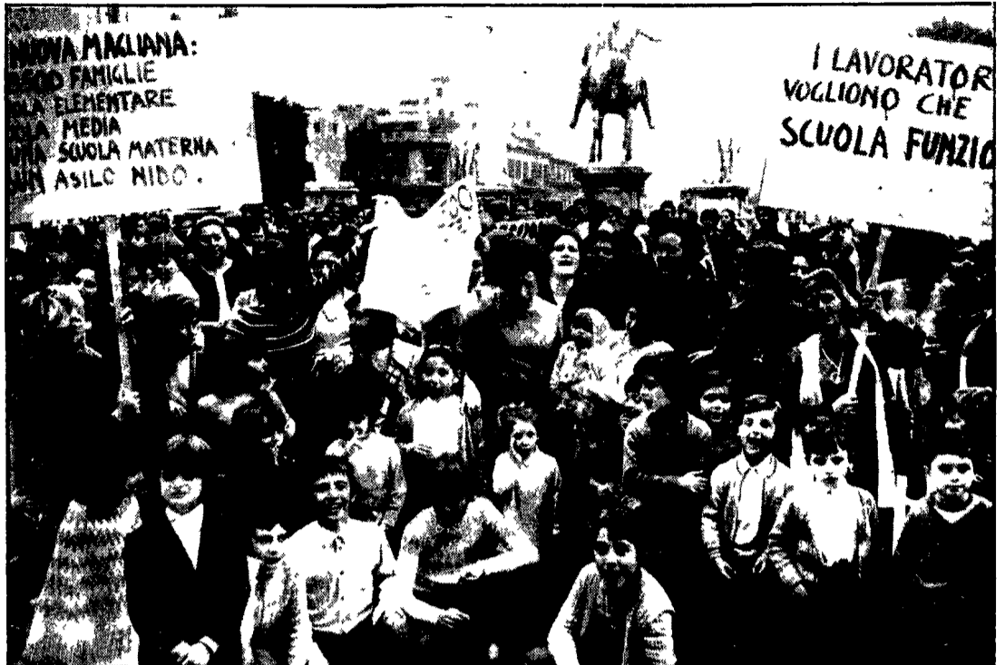
Appassionata manifestazione sulla piazza di centinaia di donne, di genitori, di scolari

Darida ha iniziato rilevando che nel corso di questi mesi non sono mancati i tentativi di ricomposizione. Ha detto che la sinistra democristiana non ha intenzione di accettare un governo di minoranza. Ha detto che la sinistra democristiana non ha intenzione di accettare un governo di minoranza. Ha detto che la sinistra democristiana non ha intenzione di accettare un governo di minoranza.