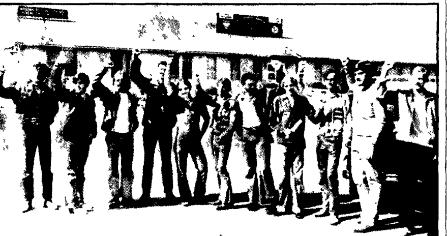
ALAMEDA - Un gruppo di marinai della «Coral Sea» manifestano il loro dissenso dalla guerra di Nixon Mille uomini della nave hanno inviato una petizione al Congresso chiedendo che la «Coral Sea» non sia più inviata nel Vietnam

E' il terzo episodio dal 1° ottobre. I precedenti: nove marinai della «Constellation» disertano, 56 fanti della base «Pace» disobbediscono all'ordine di combattere - La Corte Suprema non prende posizione sulla costituzionalità dell'intervento - Combattimenti in Cambogia e manifestazioni contro Thieu