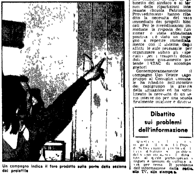
Un compagno indica il foro prodotto sulla porta della sezione dal proiettile

Il proiettile ha attraversato una spessa porta di legno e infranto alcuni vetri - La protesta dei cittadini contro la criminale bravata - Stasera assemblea nella sezione comunista - Iniziativa del comitato antifascista della zona