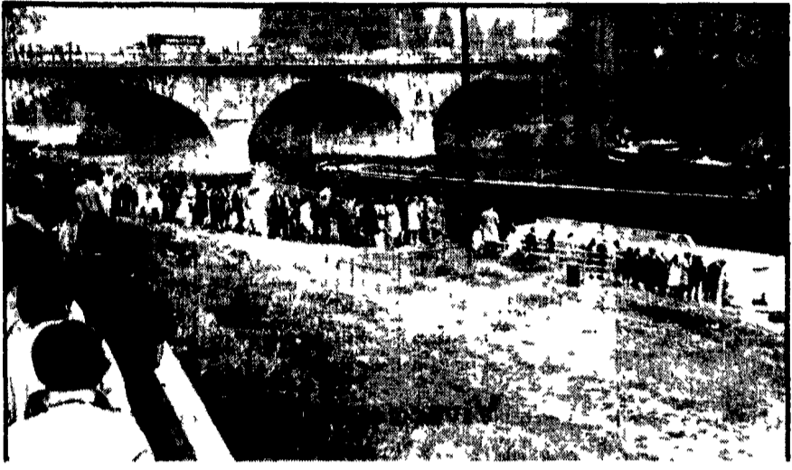
PARIGI Lo sciopero dei conducenti del metrò continua, dopo la decisione dei lavoratori. Parigi è da oltre una settimana paralizzato. Anche i battenti, come mostra la telefoto, sono stati usati per trasportare migliaia di cittadini

Respinte dai lavoratori le inconsistenti proposte della direzione dei trasporti - La CGT e il sindacato autonomo avevano consigliato una sospensione dello sciopero per non aggravare i disagi della città