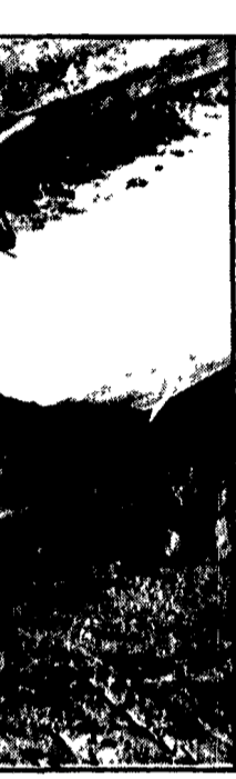
Era nuovo di zecca, ma ha ceduto ugualmente. Appena una settimana fa, il governatore della California, Reagan, aveva inaugurato il nuovo acquedotto che doveva servire Los Angeles e altre 120 città. Si trattava, quindi, di un'opera colossale. L'acquedotto, ieri, ha ceduto aprendo una enorme voragine in una strada (nella foto) e formando un lago lungo dodici chilometri nella Valle dell'Antelope. I tecnici sono ora al lavoro per chiudere l'enorme falla.