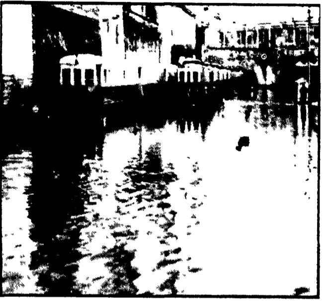
NAPOLI - Strade allagate, traffico faticoso dopo il temporale di ieri

Gravi i danni - Sgombrate numerose case di contadini circondate dalla melma - Distrutti 1000 ettari di vigneti e annegati decine di capi di bestiame - Un drammatico problema che si propone ogni anno - L'intervento dei vigili del fuoco - Allagamenti anche a Napoli