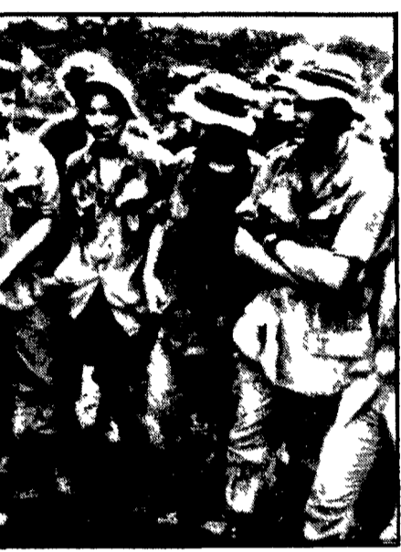
TIMBUKTU (Vietnam del Sud) - La compagnia «Bravo», della fanteria americana, che sabato scorso si rifiutò di uscire dalla propria base per operazioni di pattuglia, è stata allontanata dal teatro delle operazioni...