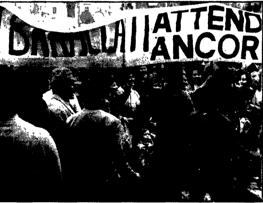
Baraccati e famiglie che si sono ridotti i figli manifestano davanti alla prefettura

Centinaia di agenti hanno circondato all'alba gli edifici occupati alla Magliana - Le famiglie hanno lasciato gli appartamenti sotto la pioggia - Ribadite in un incontro in prefettura le principali richieste: sospendere tutti i provvedimenti di sfratto, reperire 5000 appartamenti per i senza casa - Martedì incontro decisivo al ministero dei Lavori Pubblici