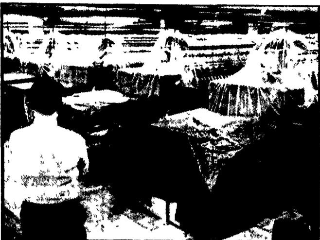
La preparazione del viaggio di Nixon