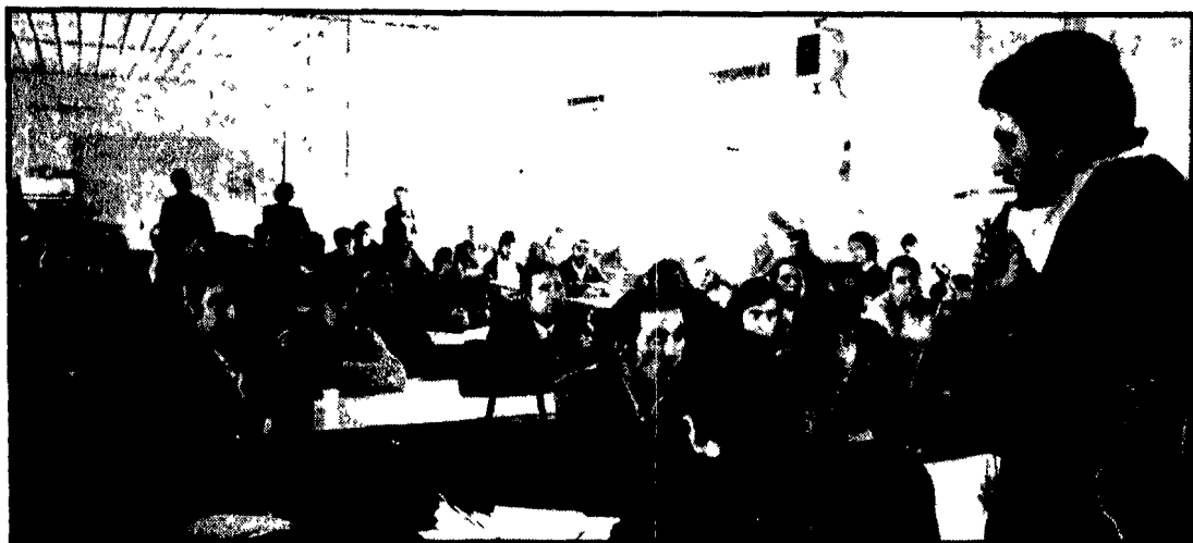
I lavoratori della Metalfer durante un'assemblea con i giovani comunisti di Ostia

Incontri delle tre segreterie provinciali CGIL, CISL e UIL con il PSI e la DC - Forte corteo della Litton, Metalfer, Chris Craft e Romanazzi - Riunione unitaria a Fiumicino - Nuovi licenziamenti e sospensioni nell'azienda «sorelle Fontana» - In lotta gli edili alla Condotte d'acqua, Vianini, SCI, Salini, Bellavista