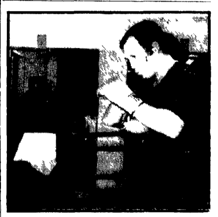
Il match avrà luogo il 31 ottobre

di Laguna Seca al volante di una McLaren M8F preceduto dalle scocce Jackie Stewart su Lola e neozelandese Denis Hulme su McLaren. La classifica generale della Can Am 1 Revson p. 151 - 2 Hulme 112 - 3 Stewart 104 - 4 Siffert 85 - 5 Motchenko her p. 52 85 - 6 Adamowicz 54.