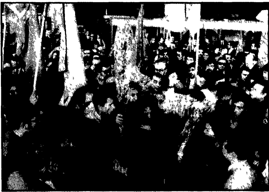
La delegazione sindacale di Hanoi, ospite della Camera del Lavoro di Roma, si incontra oggi pomeriggio con i lavoratori della fabbrica della capitale occupata contro i licenziamenti...

Una interrogazione al governo su collusioni con la mafia e complicità con i fascisti