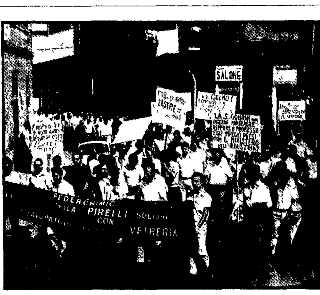
LIVORNO - Una recente manifestazione di lavoratori della Vetreria e di altre fabbriche

Un corteo per le vie di Mestre - Si è andato realizzando un vasto schieramento di forze - La presenza dei partiti e degli enti locali - La drammatica situazione dei singoli comprensori