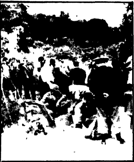
Ecco il pozzo di Bagheria dove è stato ritrovato il corpo di uno sconosciuto

La parola definitiva dei periti che hanno esaminato i resti ritrovati a Bagheria - Lo sconosciuto è stato strangolato - Si fanno i nomi di Pino Vassallo e di altre persone scomparse - Nessuna traccia di chi ha freddato il figlio del costruttore