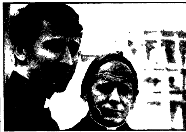
Sacerdoti USA contro la guerra