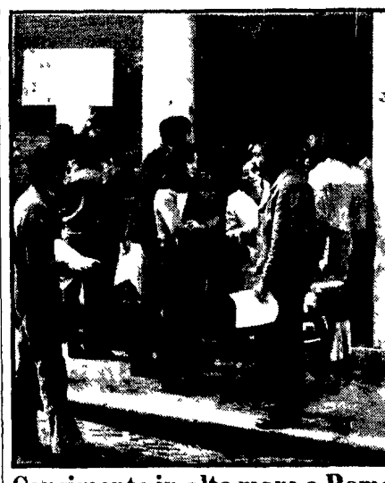
Censimento in alto mare a Roma