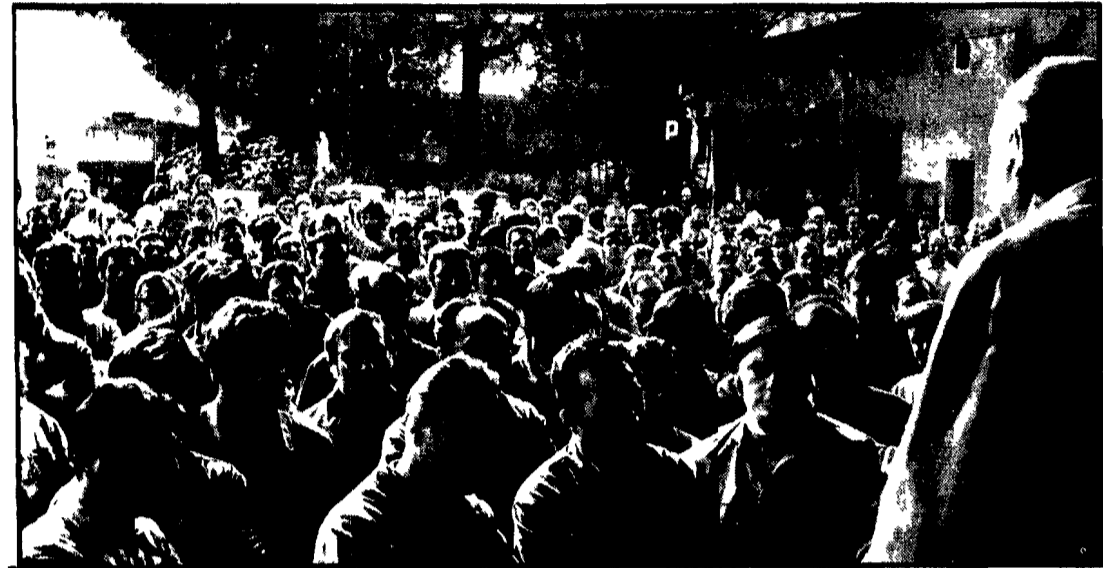
L'assemblea dei dipendenti dell'ATAC al deposito della Prenestina

Significativo successo dopo 42 giorni nell'azienda di Fiumicino - Compatte astensioni articolate anche alla Fatme - Gli operai dell'Autovox respingono una provocazione fascista - Sospendono il lavoro gli autofertranvieri a Prenestino - Una presa di posizione di CGIL, CISL e UIL sulla questione delle autolinee