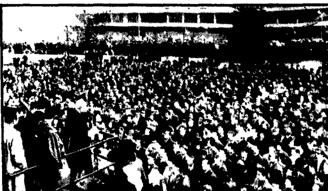
Operai del Petrochimico di Porto Marghera - che oggi entra in sciopero insieme a tutte le altre fabbriche contro i licenziamenti alla Sava - in una delle tante assemblee cui hanno dato vita in questi ultimi mesi