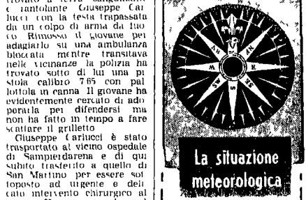
La situazione meteorologica