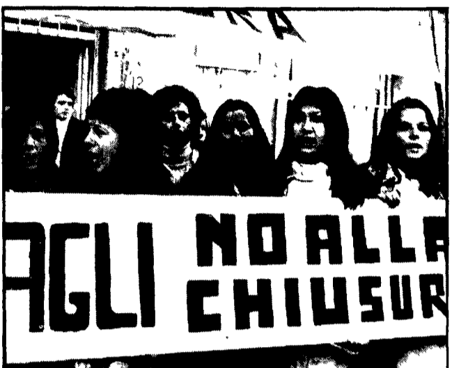
Le ragazze della Cagli che occupano l'azienda contro la smobilitazione, hanno manifestato ieri sotto l'ufficio provinciale del lavoro...