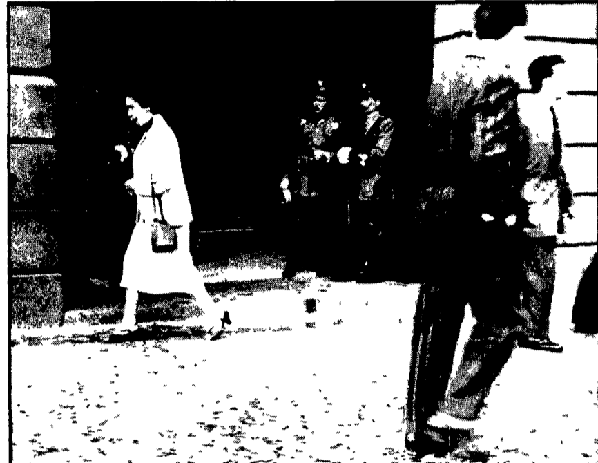
BARCELONA - Il commissariato di polizia alle Rambas