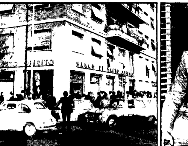
La banca davanti alla quale è stata compiuta la rapina e l'impiegato vittima del colpo

In tre, mascherati e pistole in pugno, hanno assalito due impiegati con il denaro, l'incasso dell'agenzia ai mercati generali - Uno degli aggrediti ha tentato di fuggire con i soldi ma è caduto - Identificati due dei rapinatori?