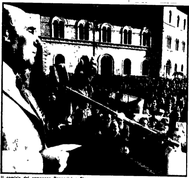
Il comizio del compagno Bonaccini a Siena