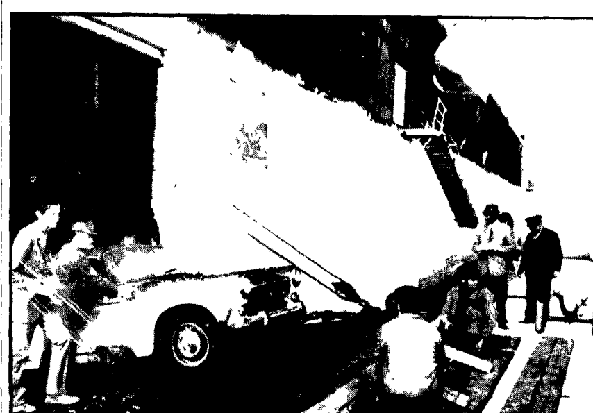
BRINDISI, 16 - E' cominciato in mattinata lo sbarco dei 149 veicoli (143 auto e motociclette e sei autotreni) dalla nave Irachello «Heleanna», ormeggiata ora al molo di Costa Marena, dopo il drammatico incendio dell'agosto scorso. A quanto si è appreso, tutte le auto sbarcate finora - che erano custodite nelle stive della nave, poco sopra la linea di navigazione - sono risultate danneggiate dal calore ed annerite dal fumo dell'incendio. I proprietari di alcune vetture sono state tagliate per estrarre il contenuto. Si ritiene che questi episodi di vandalismo siano scomparsi da alcune persone salite sulla nave mentre era ancorata nell'avamporio di Brindisi, nelle settimane successive al naufragio. Nella foto: la consegna delle auto sbarcate