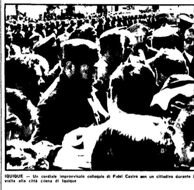
Fidel Castro con un cittadino durante la visita alla città ciana di Iquique

Conferenza stampa del premier cubano a Iquique