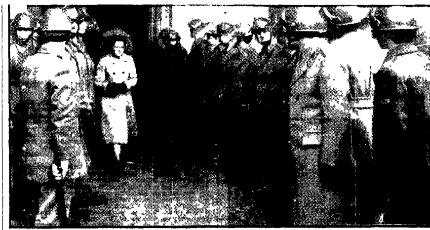
MILANO - Una studentessa passa tra due file di poliziotti all'Università statale

vetrate erano sfondate da... (Dalla prima pagina)