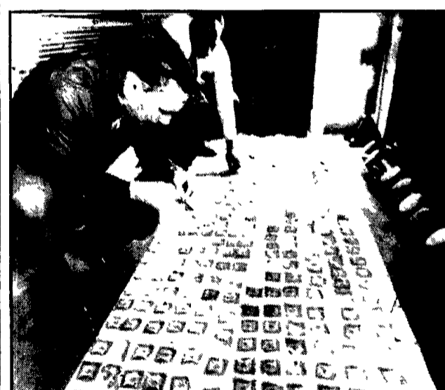
La foto mostra due poliziotti di Filadelfia intenti ad un inusuale lavoro: quello di lavare, riaccettare e contare un vero e proprio tesoro in biglietti da cento dollari trovate due giorni fa da due operai addetti alla manutenzione delle fogne. La somma ritrovata (quasi certamente frutto di una rapina, di cui gli autori si sono disfilati per non essere arrestati) è di 92.400 dollari, pari a 57 milioni di lire italiane

Vittima di una vendetta indirizzata contro il figlio