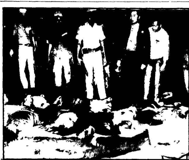
42 FILIPPINI MUSULMANI MASSACRATI

Con un clamoroso voltafaccia che suona offesa agli Stati africani e alla coscienza del mondo civile i conservatori hanno ceduto di fronte alle pretese dei razzisti rhodesiani firmando un accordo che dopo sei anni di «ribellione» concede piena indipendenza al regime di Ian Smith. Il ministro degli esteri Home e il premier Smith ne hanno dato stamane l'annuncio a Salisbury dopo un negoziato che ha prodotto un documento venuto alla luce in questi giorni. Il documento, che è stato possibile leggere in base a una copia posseduta dal deputato razzista "Ulster" L'ONU aveva anche di recente rinfacciato il principio di esclusione dei diritti democratici e civili da parte della maggioranza africana come garanzia minima per l'indipendenza.