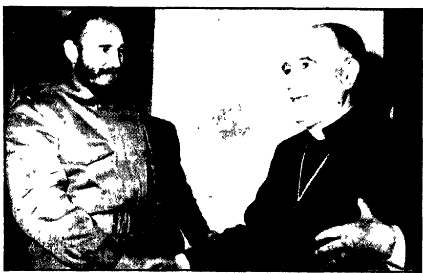
SANTIAGO — Il compagno Fidel Castro si è incontrato con il cardinale Raul Silva, arcivescovo di Santiago e capo della chiesa cattolica cilena