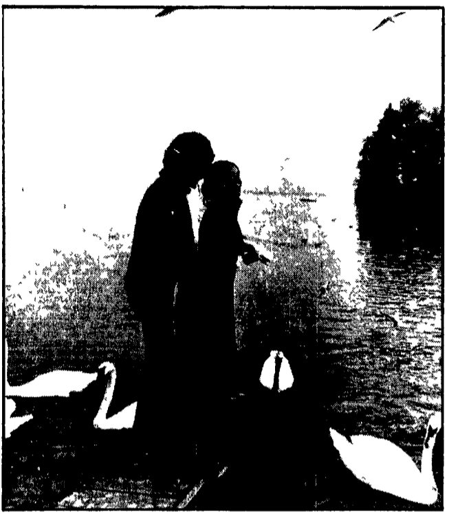
FRANCOFORTE 24 Battute e lazzi si sprecano in questo Canteuropa dove duecento persone sono costrette ad una quotidiana coabitazione...

Prattanto il Canteuropa è entrato in terra germanica ieri a Stoccarda stasera a Francoforte. E altre tappe ci attendono.