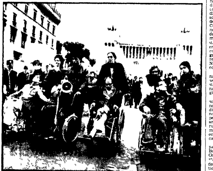
Centinaia di spastici, accompagnati dai familiari, provenienti da numerose città, hanno manifestato ieri a Roma per sollecitare il governo e il parlamento ad accelerare le richieste di miglioramento della legge per l'assistenza ai minorati e invalidi civili. Delegazioni sono state ricevute dai presidenti dei gruppi parlamentari di Montecitorio. Nella foto un aspetto della protesta

La proposta del dc Truzzi rimanda invece l'applicazione del principio alle future leggi regionali e prevede inoltre una serie di deroghe limitate. La più grave di queste - che escluderebbe di colpo centinaia di migliaia di mezzadri e di coloni della riforma - è stabilita da un articolo che prevede che la trasformazione in affitto può essere richiesta solo per quei poderi o fondi che siano uniti produttivi idonei per redditività e produttività a con-