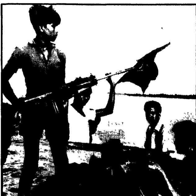
La situazione militare nel Bengala pakistano resta confusa, mentre Islamabad annuncia che l'offensiva indiana è ormai contenuta e mentre, all'opposto, il « Bangla Desh » annuncia nuovi successi. Intanto il presidente Yahya Khan avrebbe preposto un incontro al premier indiano Indira Gandhi. Questa proposta farebbe seguito all'intensa attività diplomatica che si svolge per cercare un compromesso fra due paesi. Nella foto un guerrigliero bengalese