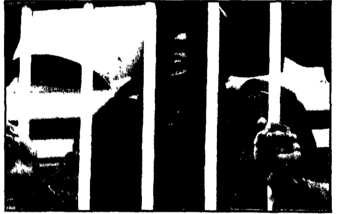
RIVOLTA IN UN CARCERE USA Una rivolta è scoppiata ieri sera nel penitenziario di Rahway, una cittadina del New Jersey a circa 50 chilometri a sud di New York. Parecchie centinaia di detenuti avevano assistito in precedenza alla proiezione di un film assieme al direttore del carcere e a parecchie guardie. Circa 150 detenuti, a proiezione in film, si sono rifiutati di lasciare la sala. Vi sono allora stati scontri durante i quali sei guardie sono rimaste ferite mentre tentavano di liberare il direttore preso in ostaggio dai detenuti. Nella foto uno dei detenuti in rivolta.

Dopo l'annuncio dell'incontro Nixon-Pompidou