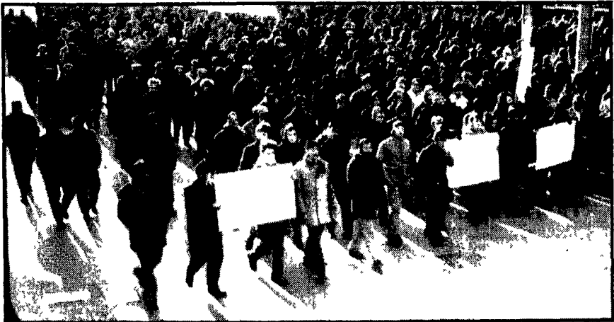
Un momento del grande corteo dei lavoratori a Trieste

Ieri scioperi a Forlì e Trieste - Oggi a Parma, Pisa e Bari - Cinqumila in corteo a Montè S. Angelo, un importante centro del Gargano