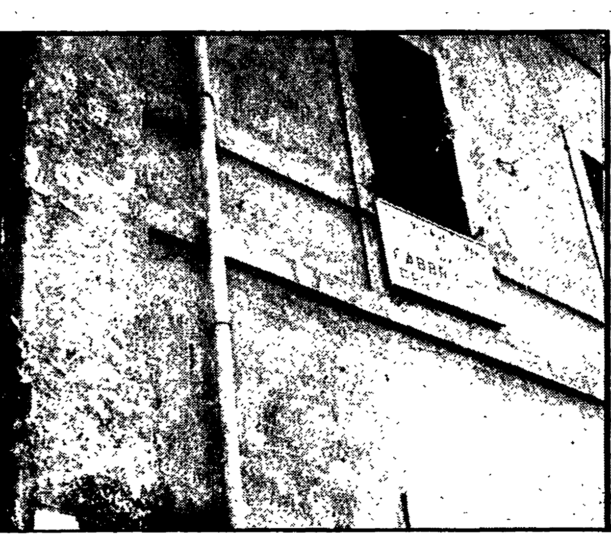
Un cartello affisso sulla facciata dell'ex caserma Lamarmora avverte che l'edificio è pericolante: cosa aspetta allora la giunta dc per lasciare gli alloggi necessari ad ospitare i senza tetto?

La giunta dc continua nella politica dei rinvii