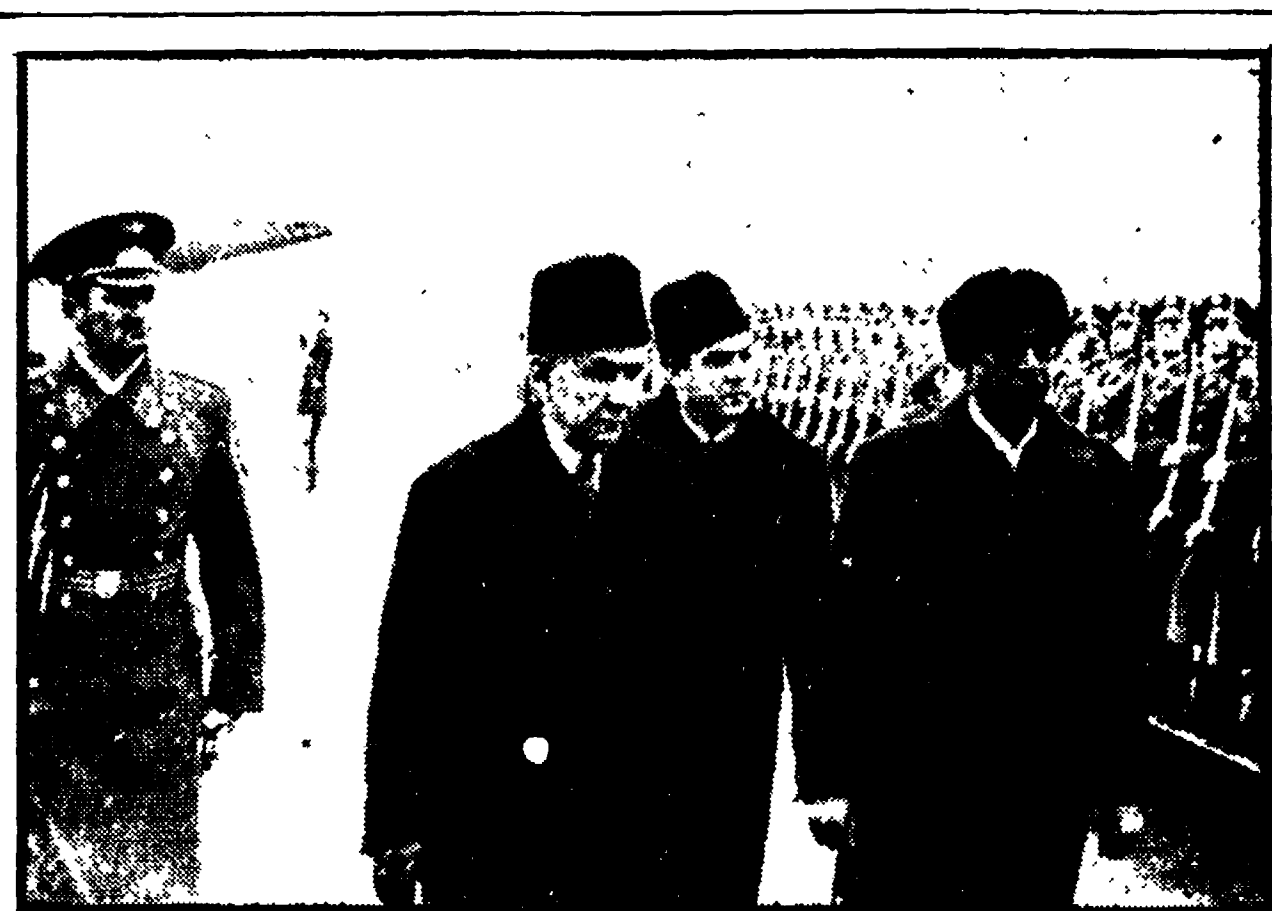
MOSCA - L'arrivo a Mosca del premier del Bangla Desh, Rahman. Accolto dal compagno Kossighin, Rahman passa in rassegna il picchetto d'onore