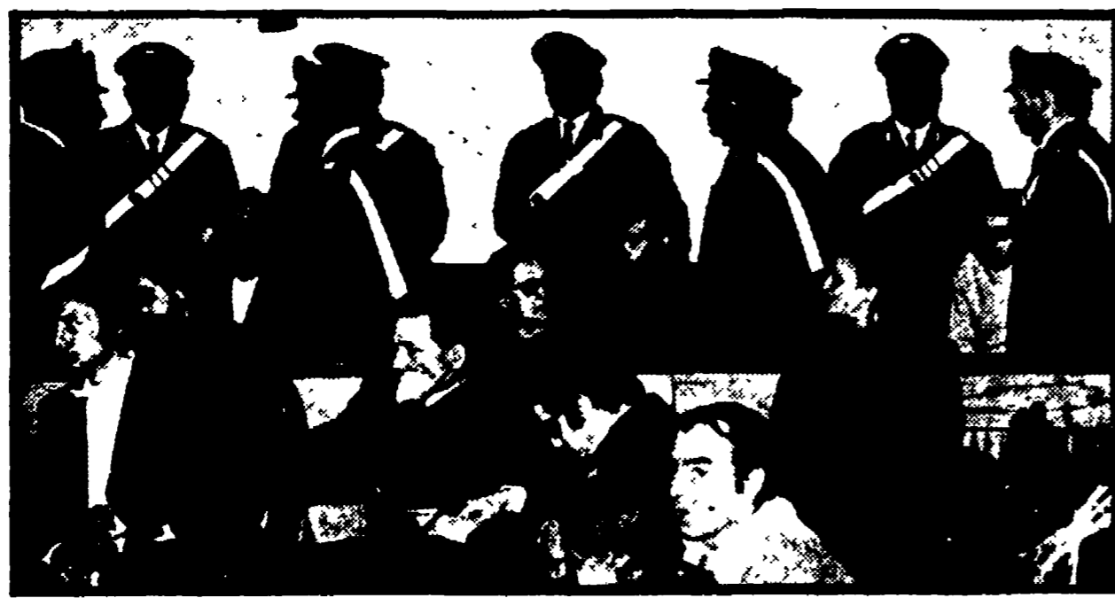
Clamoroso al processo per il processo di piazza Fontana: il giudice istruttore di Milano, Corbelli, su invito del procuratore generale Bianchi D'Espina, ha rimesso alla corteo d'Assise di Roma un dossier sui fascisti che potrebbe contribuire a trovare i veri responsabili delle azioni dimartellate. Il presidente della corteo Orlando Faico,