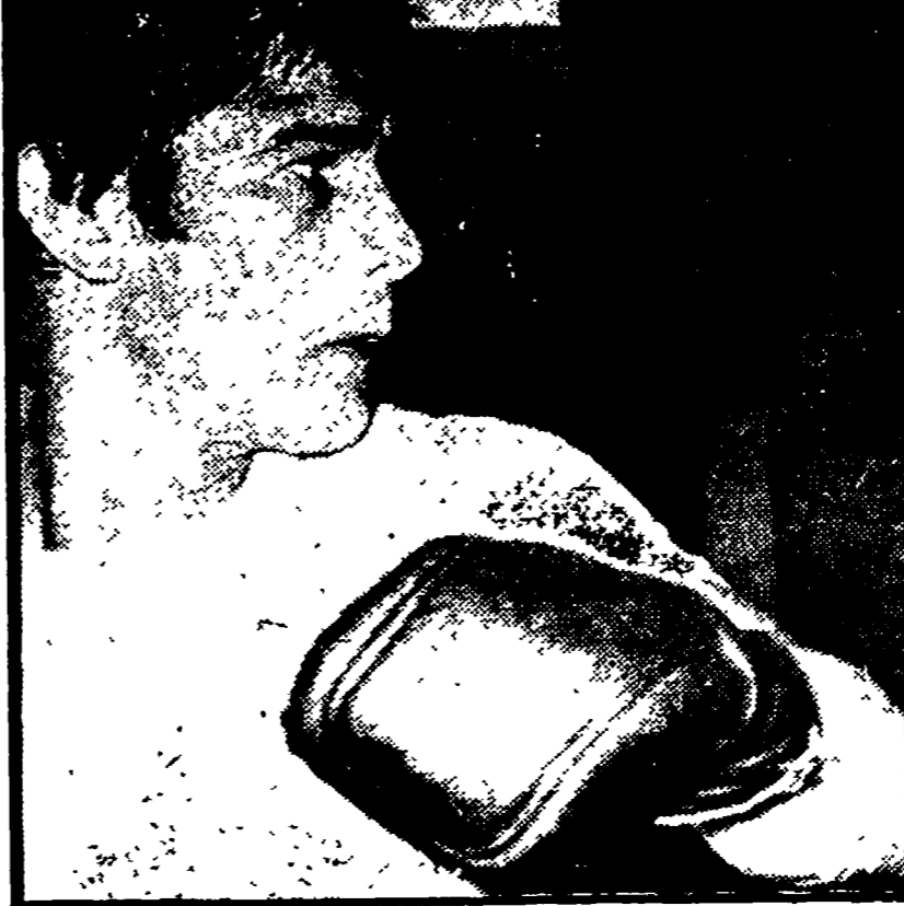
Monzon in allenamento