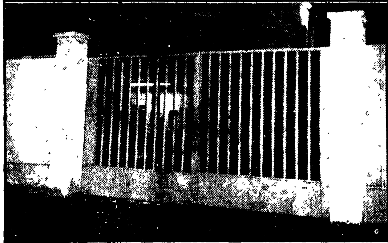
L'ingresso della cartiera «Sibilla»; i cancelli sono stati sbarrati subito dopo l'agghiacciante tragedia

L'ACEA comunica che a partire dalle ore 16 di sabato 4 marzo alle ore 24 di domenica 5 marzo mancherà l'acqua nei seguenti zone: Rioni - Prati, Trastevere, San Saba, Aventino, Borgo, Testaccio, Ripa, Campomarzio, Ponte Sisto, Regola, Estimacchio, Pigna, S. Angelo, Trevi, Campitelli, Colonna.