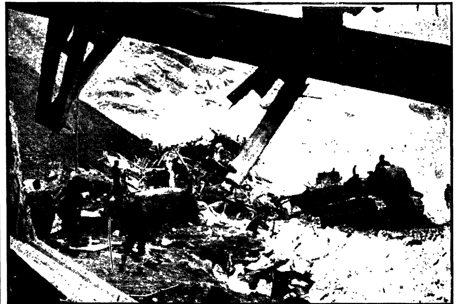
I 17 imputati al processo per la tragedia di Mattmark, nella quale perirono 88 lavoratori tra i quali 56 italiani, sono stati assolti dal tribunale di Visp, nell'Alto Vallese, in Svizzera...