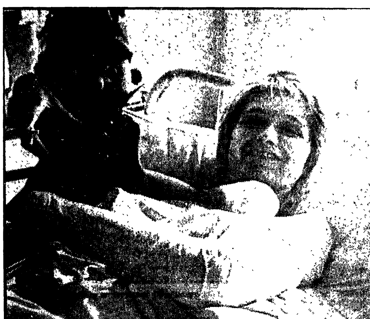
LA HOSTESS SORRIDE Vesna Vulovic, la hostess jugoslava unica nel cielo coscevolacchi, sta meglio. L'aereo di linea su cui volava è stato abbattuto...