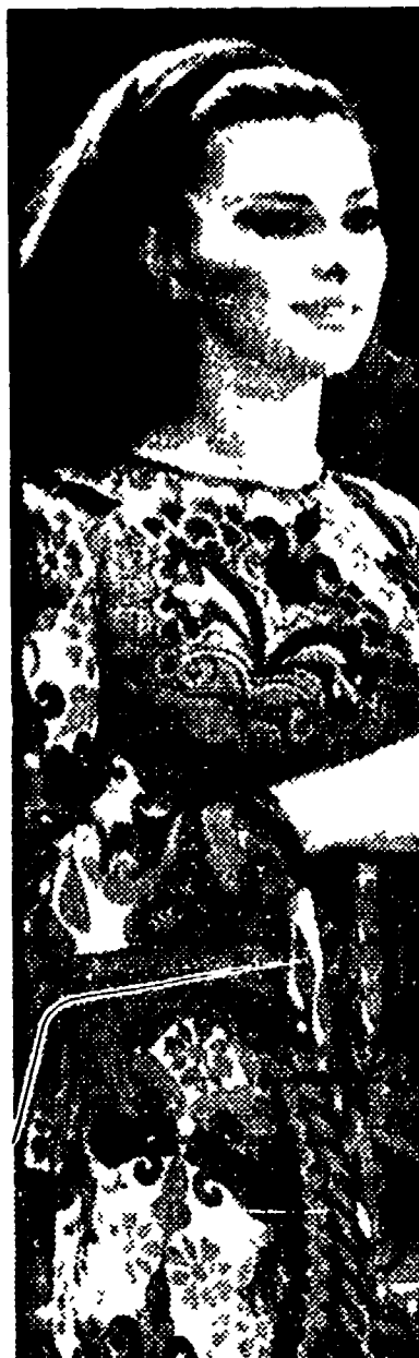
Giovanna Ralli (nella foto) è stata investita l'altra sera a Roma da un'automobile, mentre attraversava la strada per rientrare a casa...