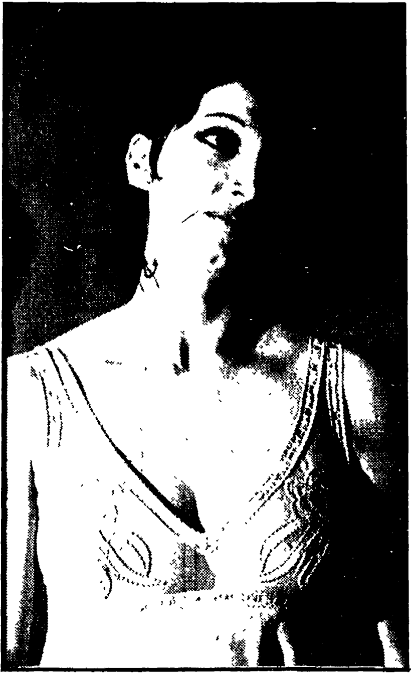
Vittorio De Sica ha annunciato che Mariangela Melato (nella foto) sarà, accanto a Nino Manfredi, la protagonista del suo prossimo film...