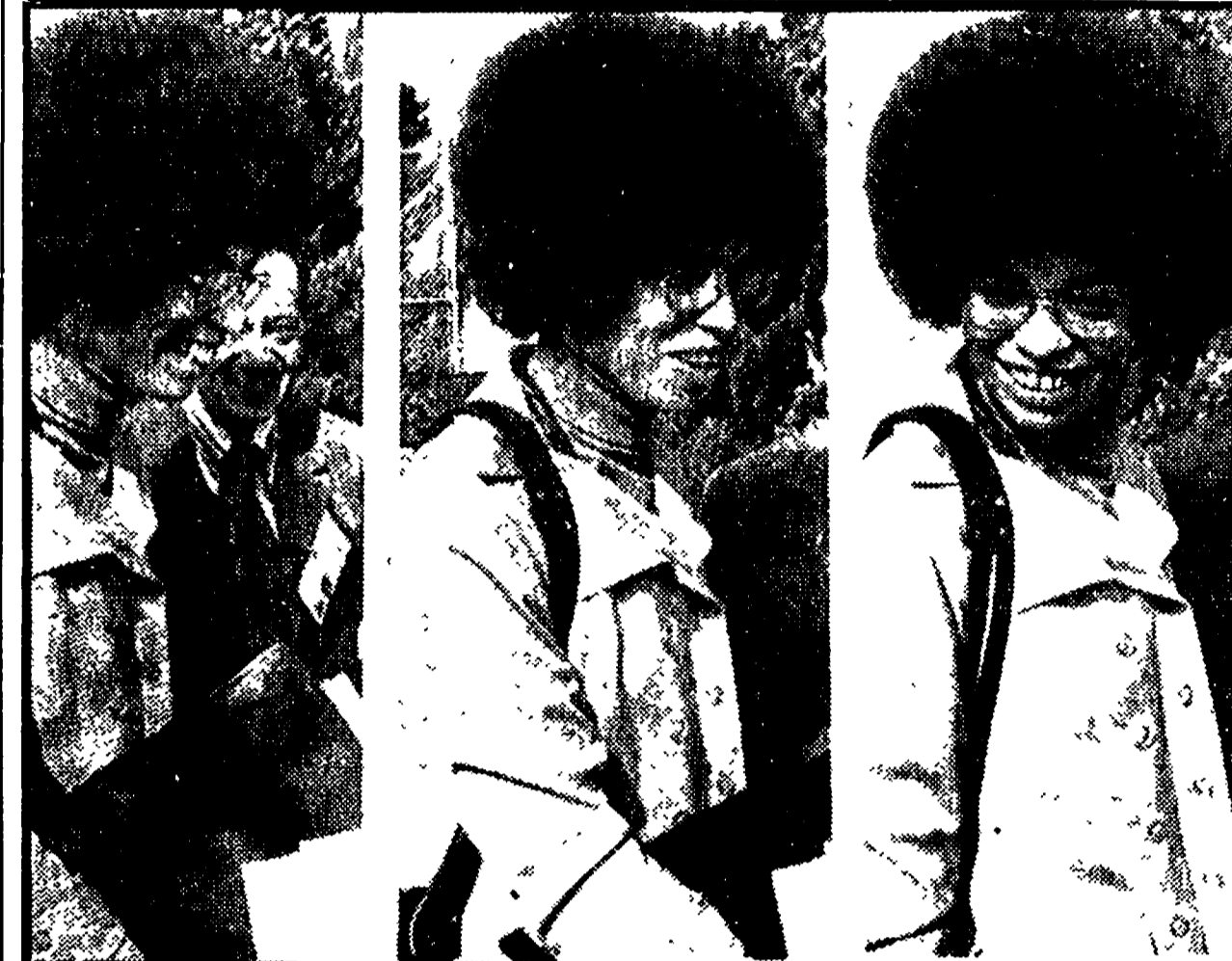
SAN JOSE' - Tre immagini di Angela Davis mentre entra nel tribunale

successo. Lo aveva del resto già detto il primo ministro sovietico Kossighin nel discorso da lui pronunciato durante un pranzo in onore degli ospiti bengalesi. «L'incontro», ha detto anche Breznev e il presidente del Soviet supremo Podgorni. «Noi esprimiamo la convinzione riconfermata dai risultati del dialogo odierno - aveva detto Kossighin - che la nostra collaborazione sarà fruttuosa, corrisponderà agli interessi nazionali dei due paesi e contribuirà al rafforzamento della pace».