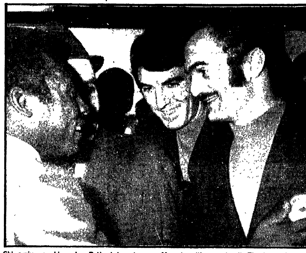
Chi arriva e chi parte: Pelé si incontra con Mazzola all'aeroporto di Fiumicino...