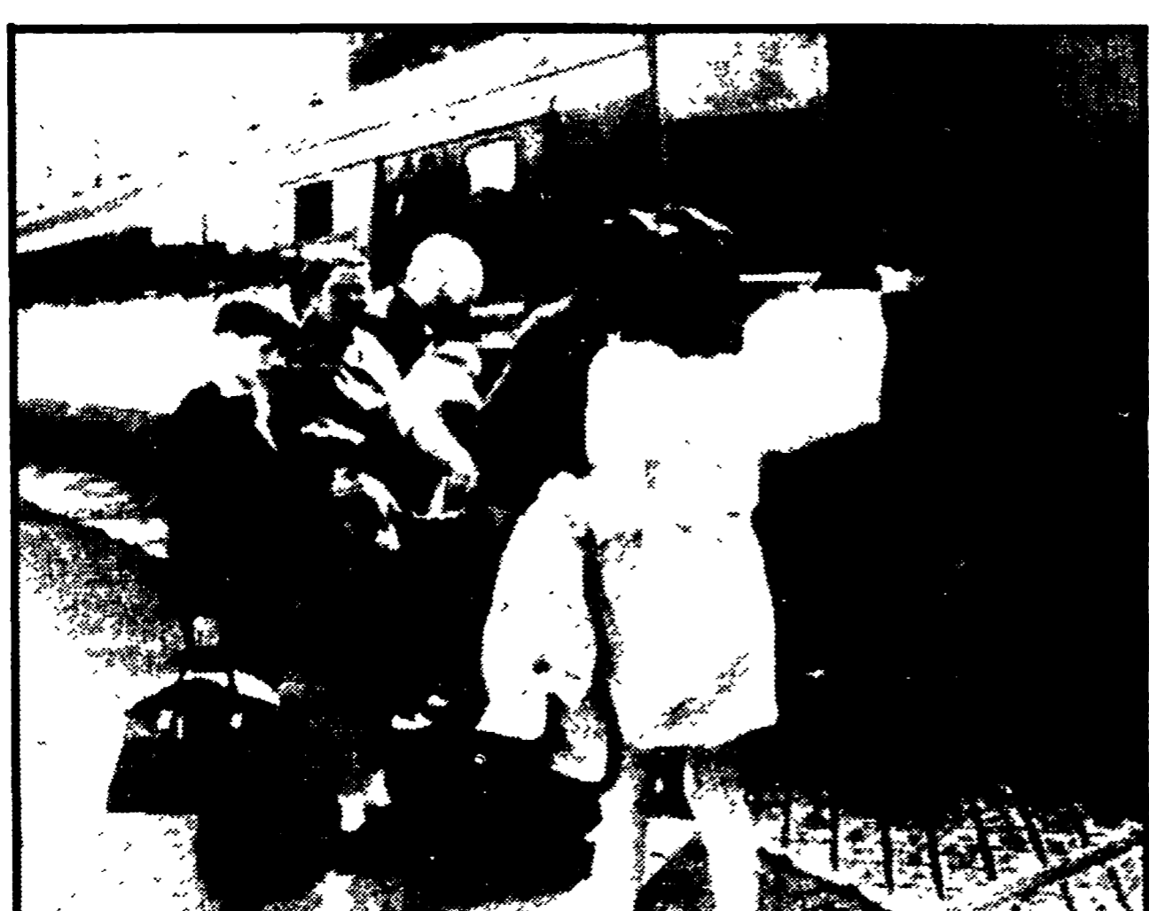
BELFAST — Si susseguono le partenze dall'Ulster verso Dublino di centinaia di cattolici, particolarmente donne e bambini, per sfuggire al clima di violenza scatenata dalla destra

Duemila nella sola giornata di ieri - La minaccia dei pogrom protestanti si accompagna ai preparativi militari inglesi per affaccare le zone cattoliche - Il comando britannico fa erigere un muro intorno ai ghetti di Derry