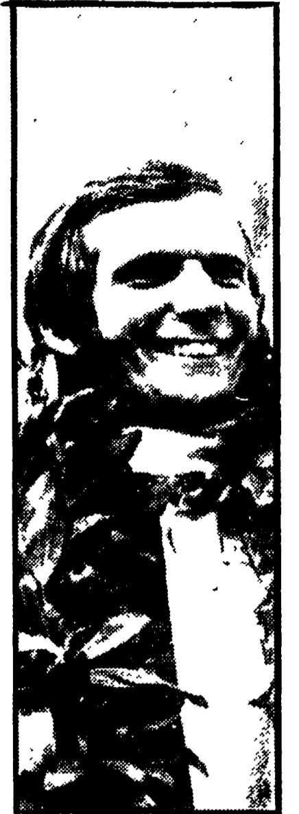
Nella foto accanto: FITTIPALDI.