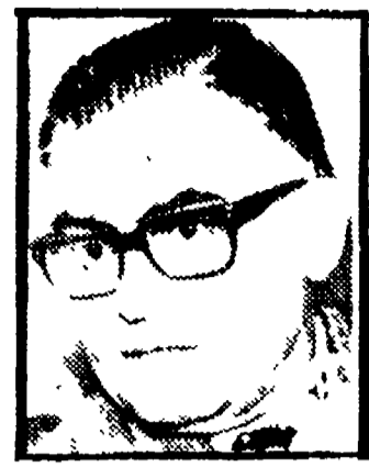
TOMIO - Democristici o amici del «padrone»?