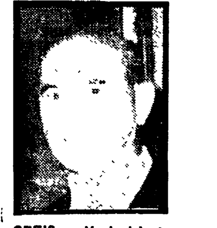
CEFIS - Vuol ristrutturare licenziando

La situazione si è aggravata, in quanto il rapporto tra azienda e lavoratore è diventato sempre più sfavorevole.