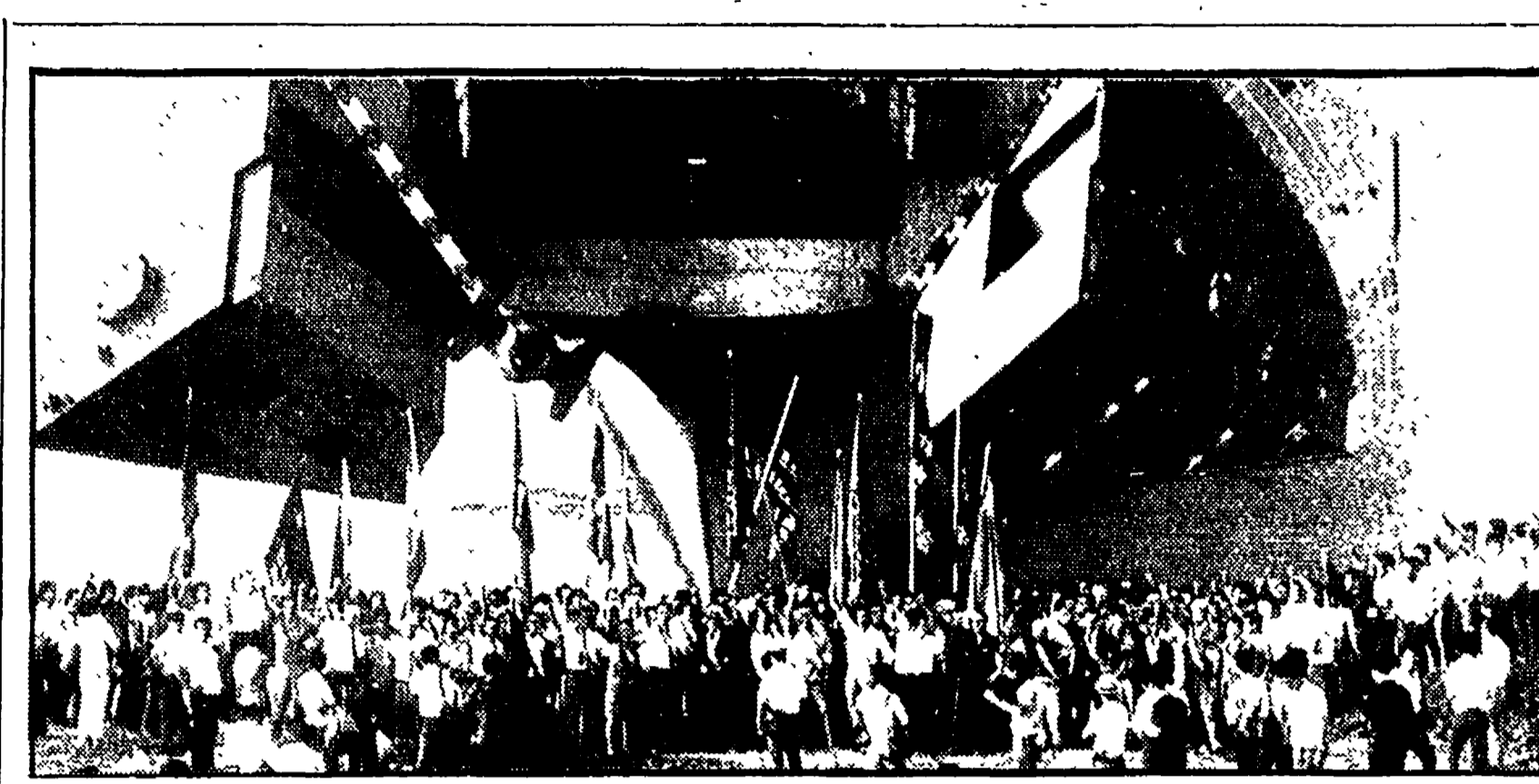
I GIAPPONESI CONTRO LE MANOVRE STATUNITENSIS Una folla di dimostranti giapponesi con cartelli di protesta accoglie il mezzo da sbarco americano « Newport » all'approdo sulla spiaggia di Iinosawa

I lavori della 60. conferenza della Unione interparlamentare si sono aperti solennemente ieri mattina nell'aula di Montecitorio, alla presenza di oltre mille parlamentari di tutti i continenti. Nel corso della cerimonia inaugurale il presidente dell'Unione interparlamentare, l'on. Rolf Sieber, ha pronunciato un breve discorso di saluto al presidente della Repubblica, al presidente della Camera, al presidente del Senato, al presidente della Conferenza interparlamentare, al presidente del Consiglio interparlamentare, ha pronunciato un breve discorso di saluto al presidente della Repubblica, al presidente della Camera, al presidente del Senato, al presidente della Conferenza interparlamentare, al presidente del Consiglio interparlamentare, ha pronunciato un breve discorso di saluto al presidente della Repubblica, al presidente della Camera, al presidente del Senato, al presidente della Conferenza interparlamentare, al presidente del Consiglio interparlamentare.