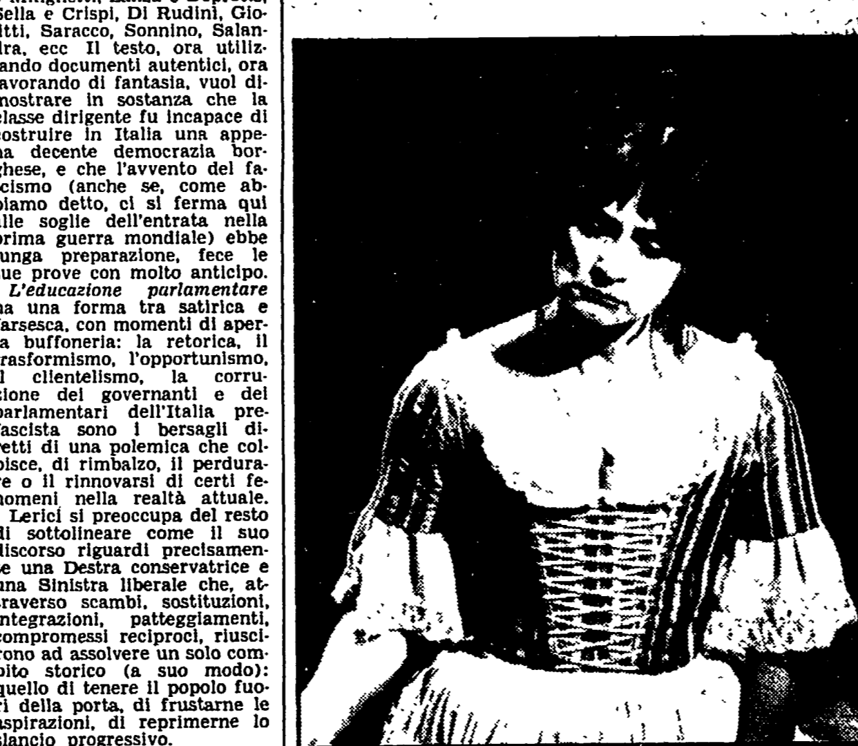
«La locandiera» di Carlo Goldoni, che il «Teatro Opera 2» sta presentando con successo all'Eliseo...