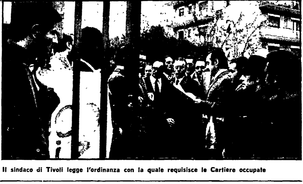
Il sindaco di Tivoli legge l'ordinanza con la quale requisisce le Cartiere occupate

Si fermano stamane gli edili - Alle ore 9 assemblea al cinema «Colosseo» - In lotta i dipendenti della FIAT di Grottole - Scioperano a tempo indeterminato gli operai della Romana Arredamenti - Protesta degli impiegati al ministero della Difesa