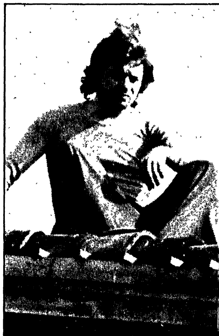
MILANO — Il giovane detenuto che ha dato il via alla manifestazione di protesta a San Vittore

«La protesta sarebbe nata dalla delusione per il decreto legislativo approvato oggi dal consiglio dei ministri in materia carceraria. I detenuti — secondo quanto è stato fatto osservare da un funzionario del carcere — si attendevano un provvedimento comprensivo dell'intera riforma del codice di procedura penale».