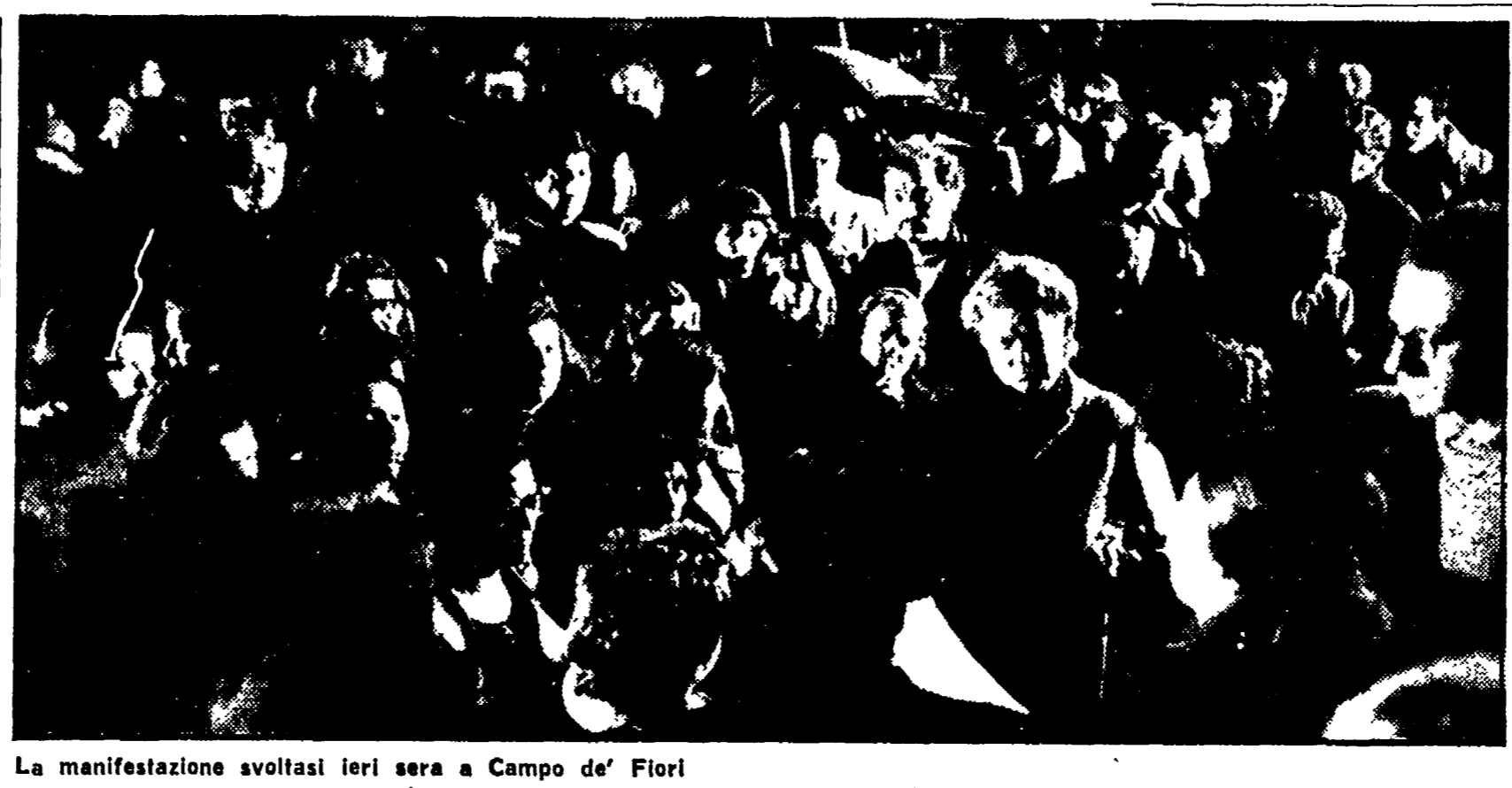
La manifestazione svoltasi ieri sera a Campo de' Fiori