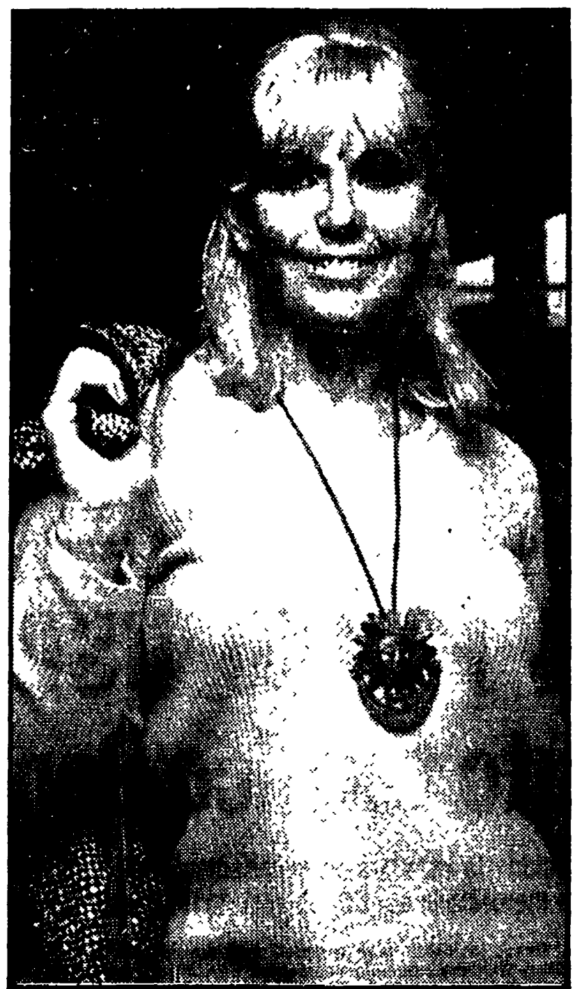
LONDRA - Kim Novak fotografata al suo arrivo all'aeroporto londinese di Heathrow. L'attrice è stata chiamata in Inghilterra per interpretare il film «Tales that witness madness»...