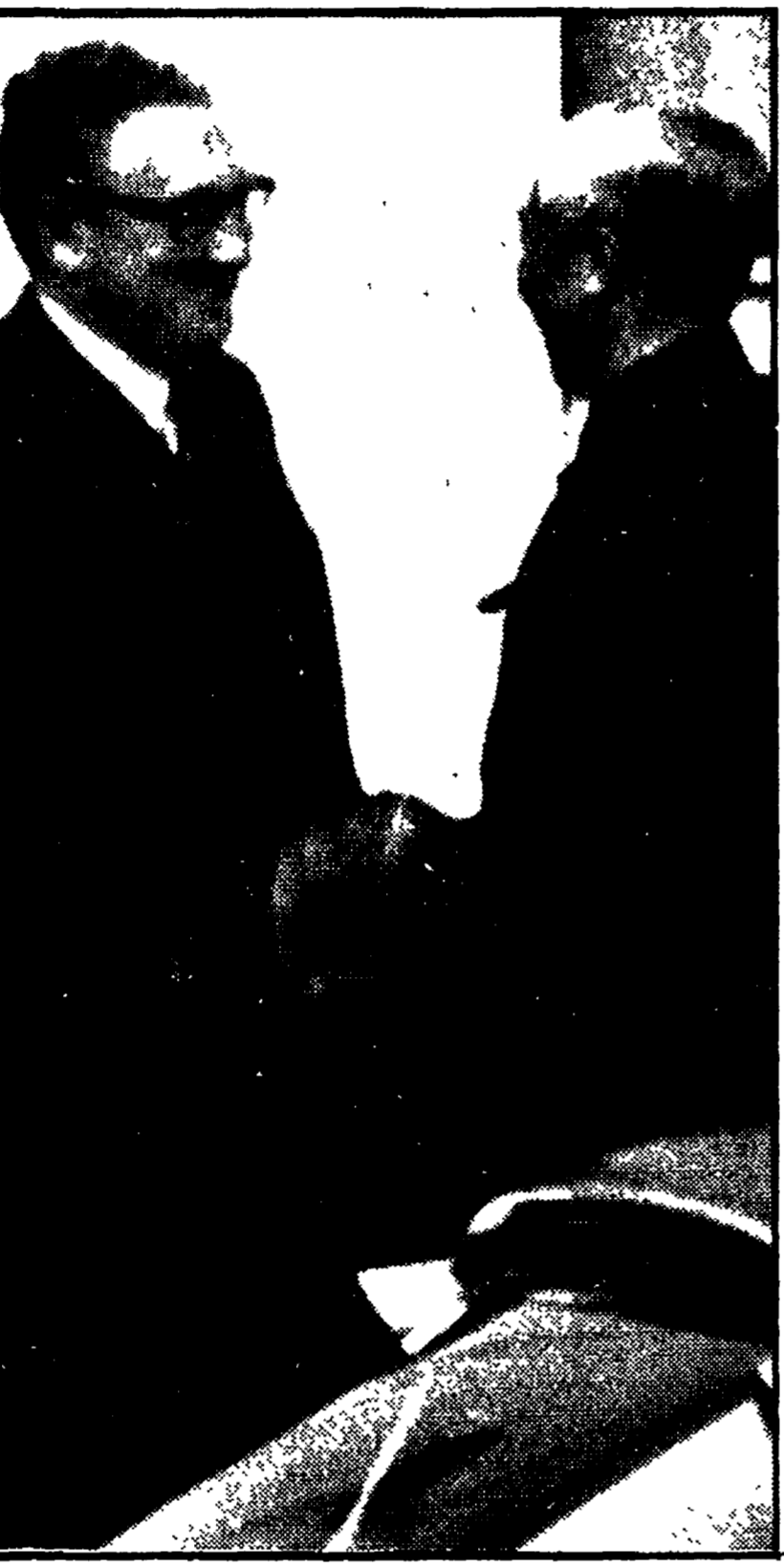
PARIGI - L'incontro tra Le Duc Tho e Kissinger ieri a Neuilly prima che iniziasse il 13mo colloquio segreto sul Vietnam

leri si è svolto un altro incontro fra Kissinger e Le Duc Tho - Alcuni giornali americani accusano la Casa Bianca di diffondere « cortine fumogene » per addormentare l'opinione pubblica - Proseguono i bombardamenti sul Vietnam - Australia e Nuova Zelanda ritirano gli ultimi « consiglieri » militari