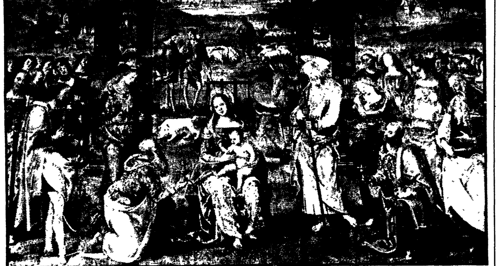
L'affresco di Pietro Vannucci, detto il Perugino: è datato 1504

BAYREUTH (RF), 13. Lo studente ventiduenne Lubomir Adamic è stato trovato impiccato nella cella del carcere di Bayreuth, ove era detenuto in attesa di processo per il dirottamento in Germania Occidentale di un volo interno cecoslovacco, da Karlovy Vary a Praga, l'8 giugno 1972.