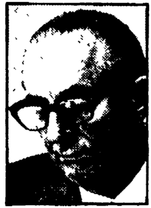
MATTEI - Un «liberale» contestato anche nel PLI

che è una delle colonne del filo-fascista Tempo di Roma e della catena editoriale del petroliere Monti, e che è stato designato dal PLI, anche se una corrente di questo stesso partito ha protestato contro la designazione.