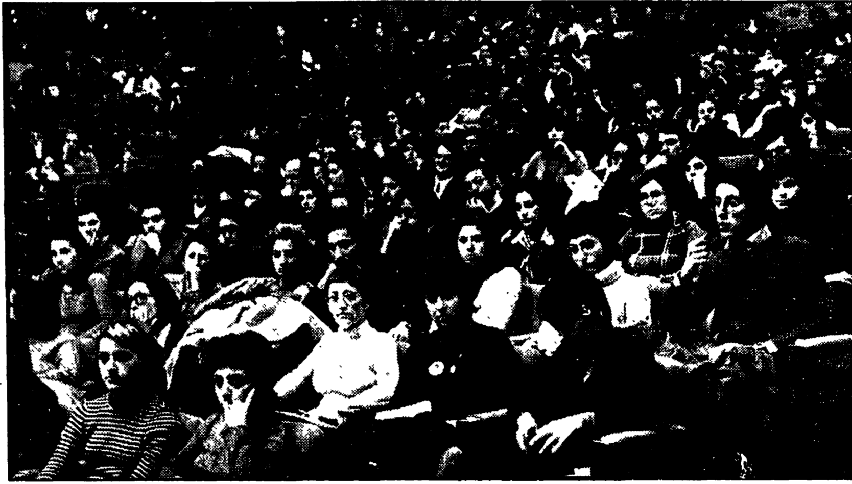
Un aspetto della Conferenza delle ragazze comuniste

Nella seduta del consiglio comunale di Venezia, di ieri sera, è stato presentato dal gruppo consiliare del PCI, PSI, PRI, PSDI e DC, un ordine del giorno nel quale si afferma: «Di fronte alla continua manifestazione di atti criminosi, attentati, azioni squadristiche contro i cittadini democratici, sedi delle organizzazioni dei lavoratori, di associazioni antifasciste e di organi di stampa; esprime la propria deliberata protesta per l'acquisirsi di atti chiaramente fascisti e rievoca in ciò i segni di un più vasto disegno reazionario, che minaccia l'assetto democratico della Repubblica, nata dalla Resistenza».