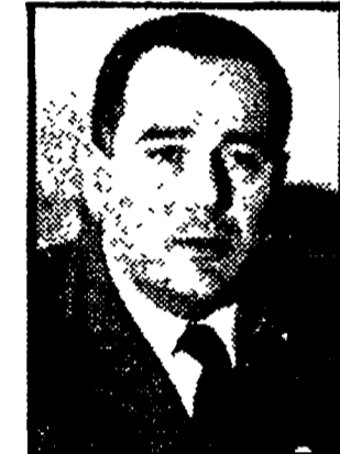
PAOLICCHI - Dimissioni dal «vertice» televisivo

Certo è che le ultime novità televisive sono servite a fornire un nuovo esempio, ove ve ne fosse stata la necessità, di quali siano i metodi propri dell'attuale governo.