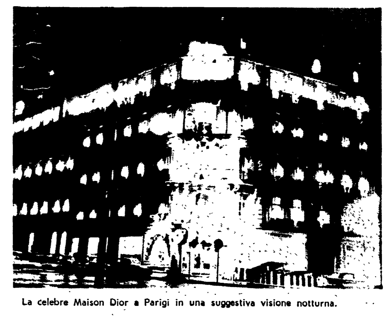
La celebre Maison Dior a Parigi in una suggestiva visione notturna.

Non meno prestigiosa è l'iniziativa di quest'anno, con l'accordo Stock-Dior: una bottiglia di Stock 84 e una cravatta disegnata da Dior, riunite in una elegante confezione.