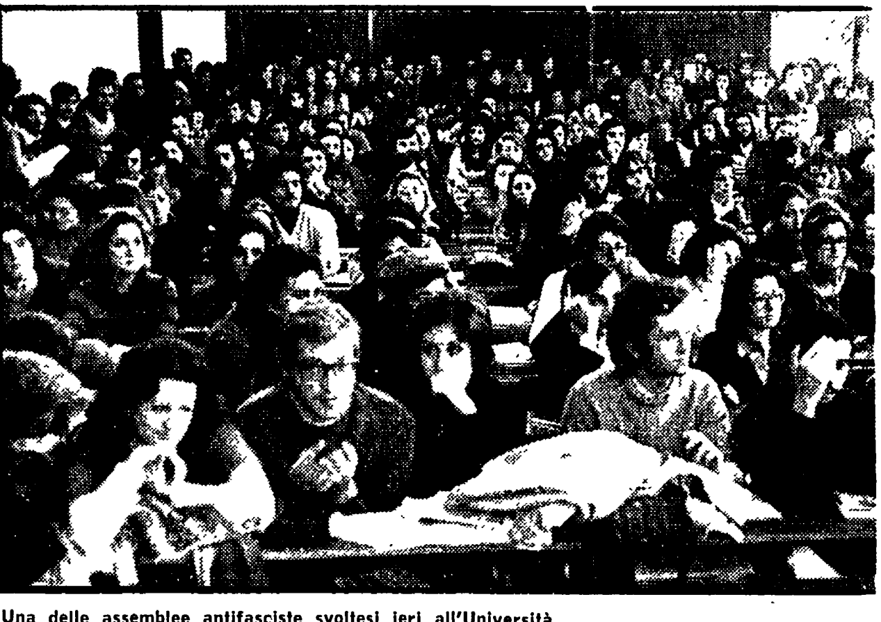
Una delle assemblee antifasciste svoltesi ieri all'Università

Domani, alle ore 19, nella sala consiliare di Montetoro si terrà una manifestazione antifascista. Hanno aderito: l'ANPI, la Giunta comunale, PCI, PSI, DC, PRI, CGIL, CISL, UIL, e le ACLI.