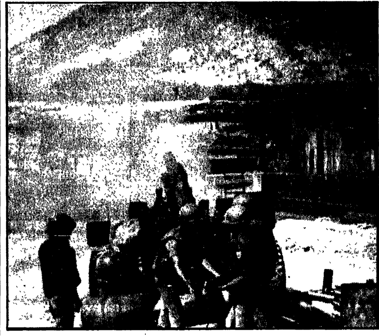
Truppe del governo saigonese sparano dalla base di Suoi Dat contro le pendici della Nui Ba Den, la Montagna della Vergine Nera, 50 miglia a nord-ovest di Saigon, dove si troverebbe un osservatorio delle forze di liberazione del GRP.