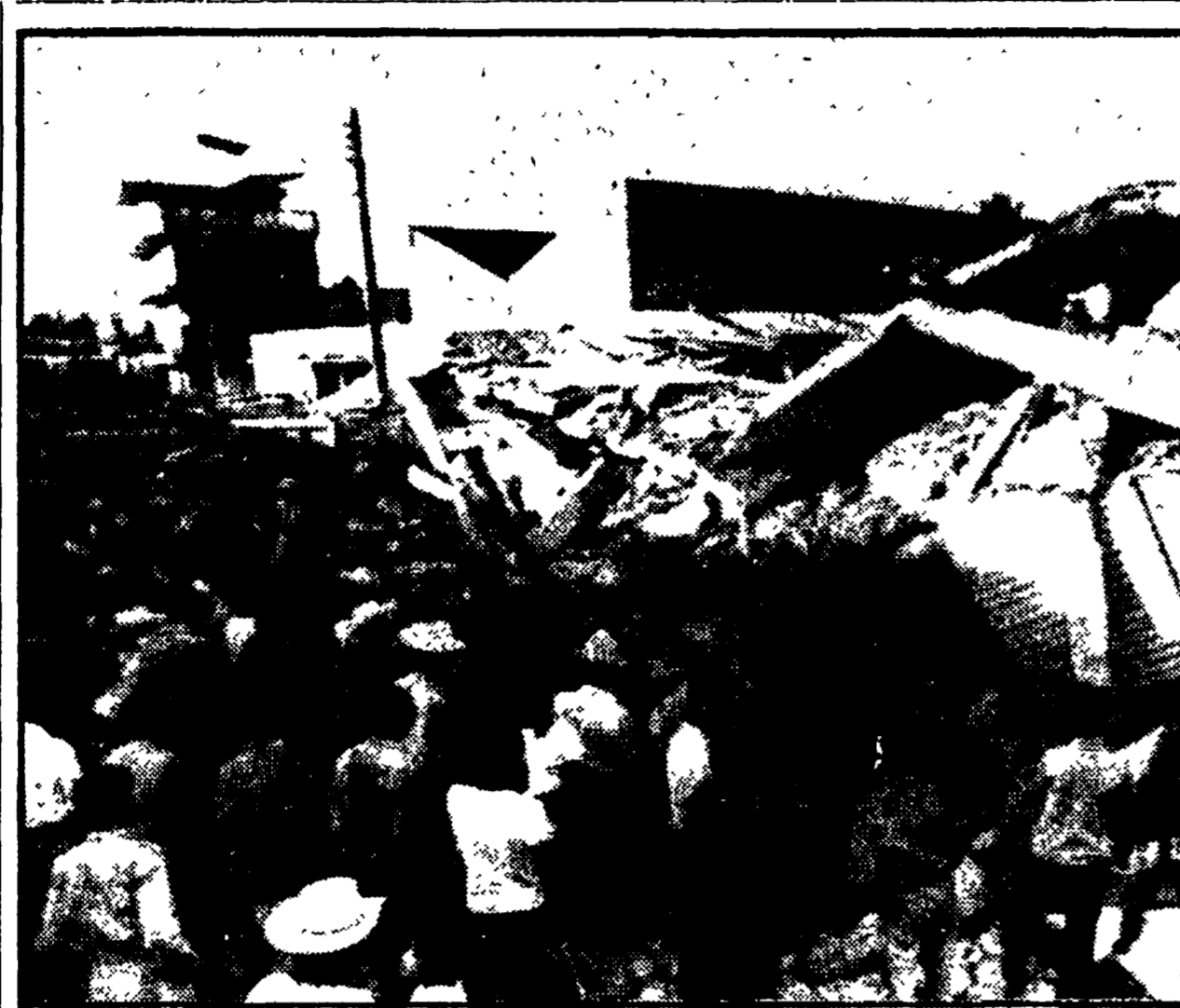
VULCANI IN AZIONE. E' esplosa un altro vulcano. Si tratta dell'Asama di 2542 metri, situato a 130 chilometri a nord ovest di Tokio. Si tratta del terzo vulcano che ha praticamente cancellato una cittadina di 7000 abitanti...