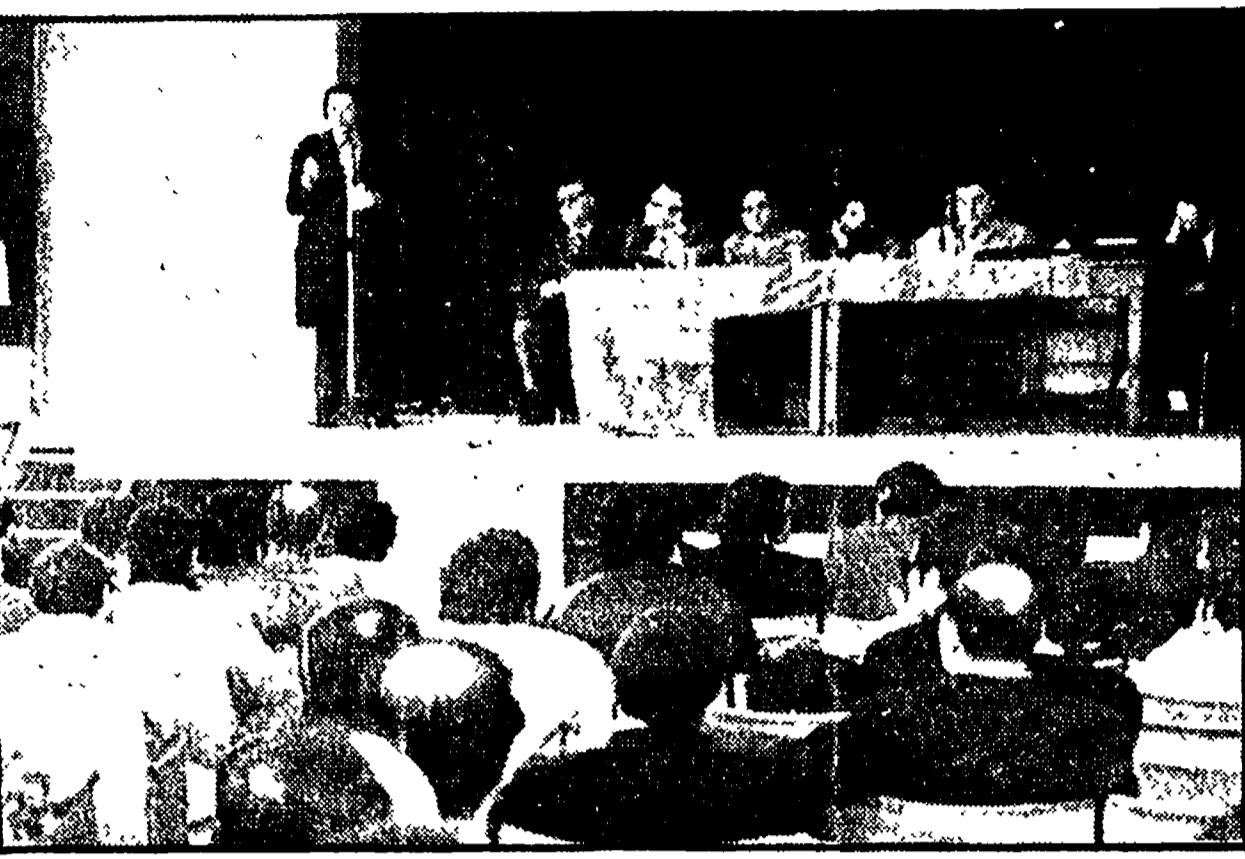
L'assemblea dei metalmeccanici alla Centrale del Latte.

Un piano repressivo veramente su vasta scala, un ricatto xenofobico contro il lavoro, la lotta contrattuale. E in tutti questi casi unico è il discorso fatto dai padroni: gli scioperi articolati avrebbero messo in crisi le aziende, per cui non rimane che smobilizzare o, nel migliore dei casi, procedere a massicce ritorsioni del personale. La risposta dei lavoratori è stata offensiva e tuttavia forte ed efficace. Ne è un ulteriore prova la giornata di ieri, che attorno alla fabbrica della Wayne ha visto mobilitata la categoria dei metalmeccanici, di diverse altre categorie e le forze politiche democratiche.