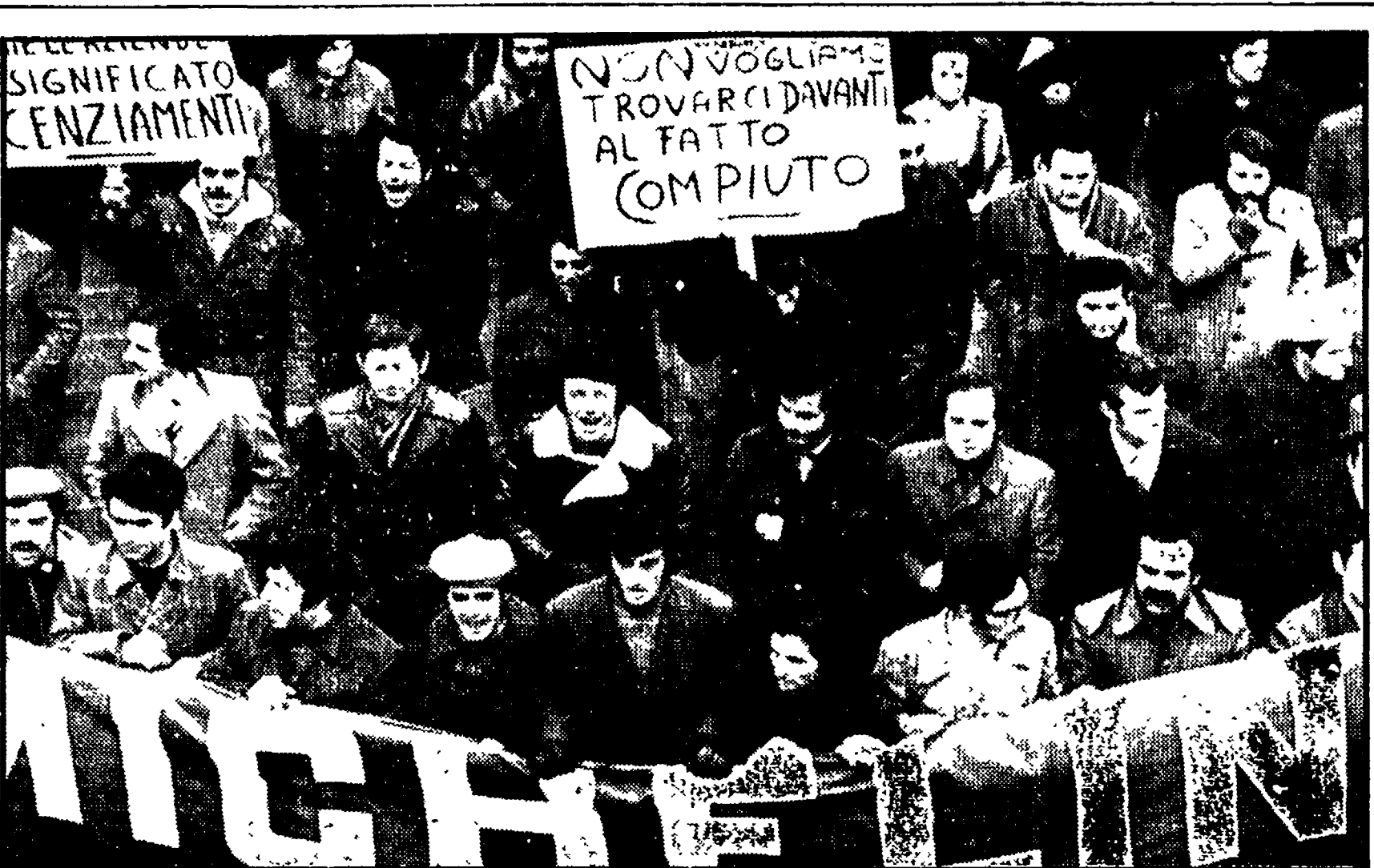
FORTI AZIONI ALLA MICHELIN E ALLA PIRELLI. Con massicci scioperi che hanno bloccato per l'intera giornata la Michelin e lo stabilimento « pneumatici » della Pirelli di Settimo (Torino)...

Migliaia in corteo alla Mirafiori e nelle diverse sezioni - Altissime le adesioni allo sciopero - Forte presenza degli impiegati - Sottoscrizione fra la popolazione per la manifestazione di Roma