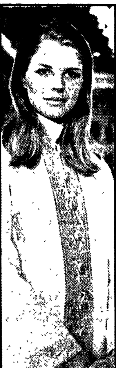
Candice Bergen hostess

L'interessante spettacolo, interpretato da cantanti italiani, diretto dallo jugoslavo Lescovic e con l'allestimento scenico del Teatro di Praga, sarà presentato in sette città della regione e a Brescia