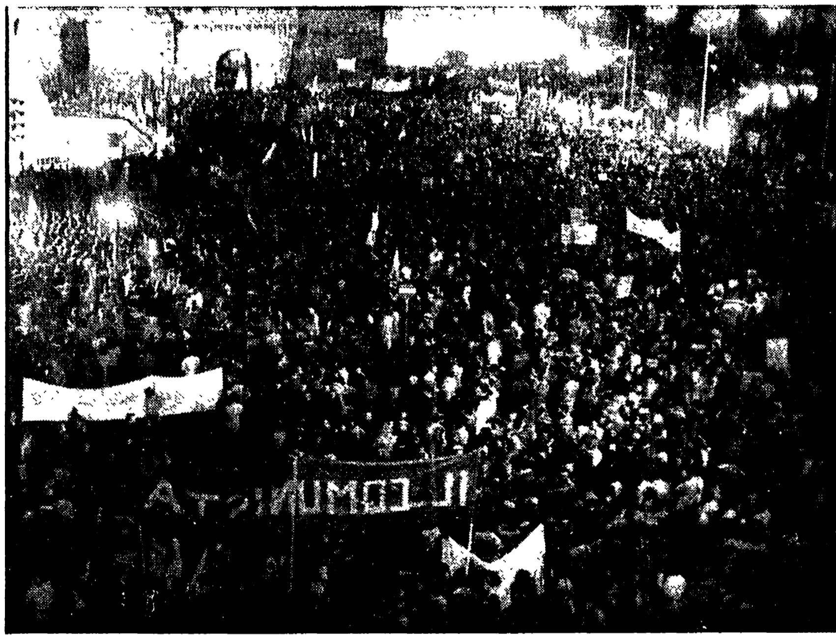
Centomila antifascisti romani si diedero appuntamento il 18 gennaio scorso a Porta San Paolo per ribadire, nel corso di una imponente e appassionata manifestazione, il loro deciso no a ogni tentativo di colpire la democrazia nel nostro Paese. Questo impegno viene ribadito con maggior forza oggi, nel momento in cui potenti forze eversive ricorrono al delitto e a torbide manovre nel tentativo di attentare alla democrazia