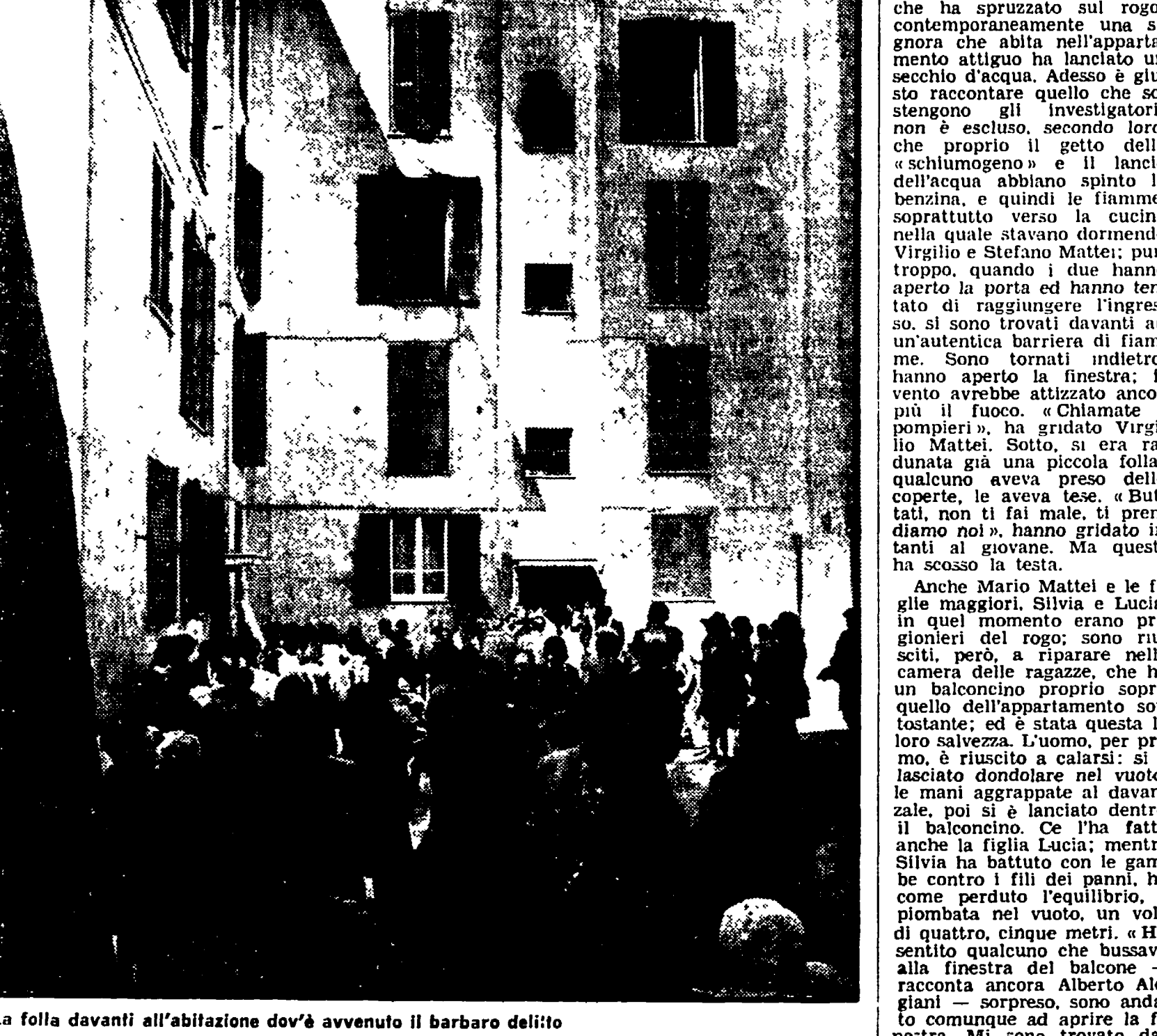
La folla davanti all'abitazione dov'è avvenuto il barbaro delitto