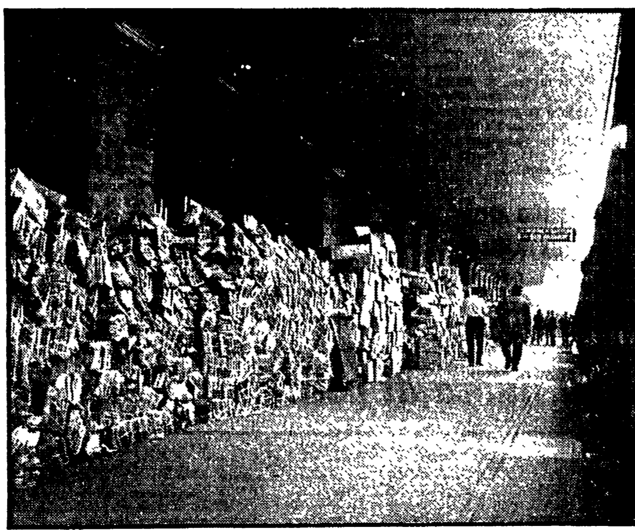
Cumul di corrispondenza e di pacchi giacciono in permanenza lungo le banchine delle stazioni. E' questa la conseguenza più caotica della mancata riorganizzazione dell'azienda PPTT ed del mancato ampliamento degli organici: obiettivi per i quali si battono oggi i lavoratori postelegrafonici, contro la resistenza ottusa del governo

sono scese in sciopero le popolazioni abruzzesi... trovata sono i falsi intralci... rebbano alle Marche dall'entrata in funzione dell'autostrada adriatica, inaugurata sabato scorso.