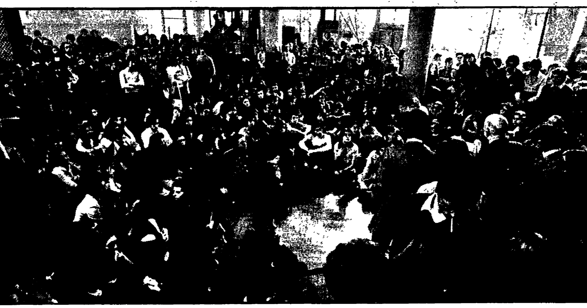
L'assemblea studentesca al liceo « D'Azeglio » di Torino mentre parla il compagno Gian Carlo Pajetta

Invitato a parlare sul tema dell'antifascismo, il dirigente comunista ha ricordato le esperienze e le ragioni storiche della politica unitaria perseguita dal PCI - Domande e risposte sulla Resistenza, sulla situazione nell'immediato-dopoguerra, le lotte operaie, i gruppi estremisti