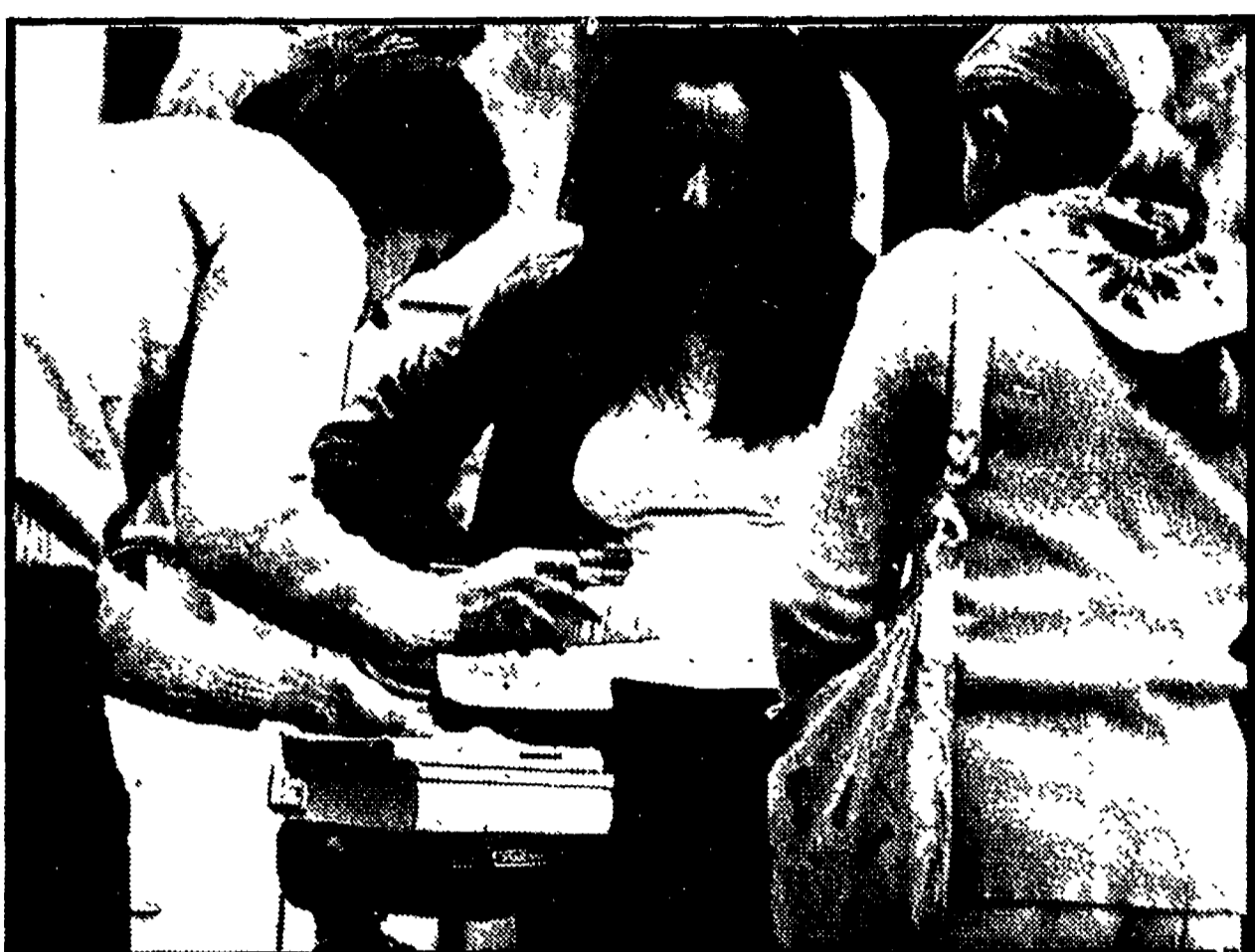
Anche la possibilità di acquistare libri usati va sempre più limitandosi. Le case editrici continuano infatti a sfornare ogni anno nuove edizioni e nuovi titoli...