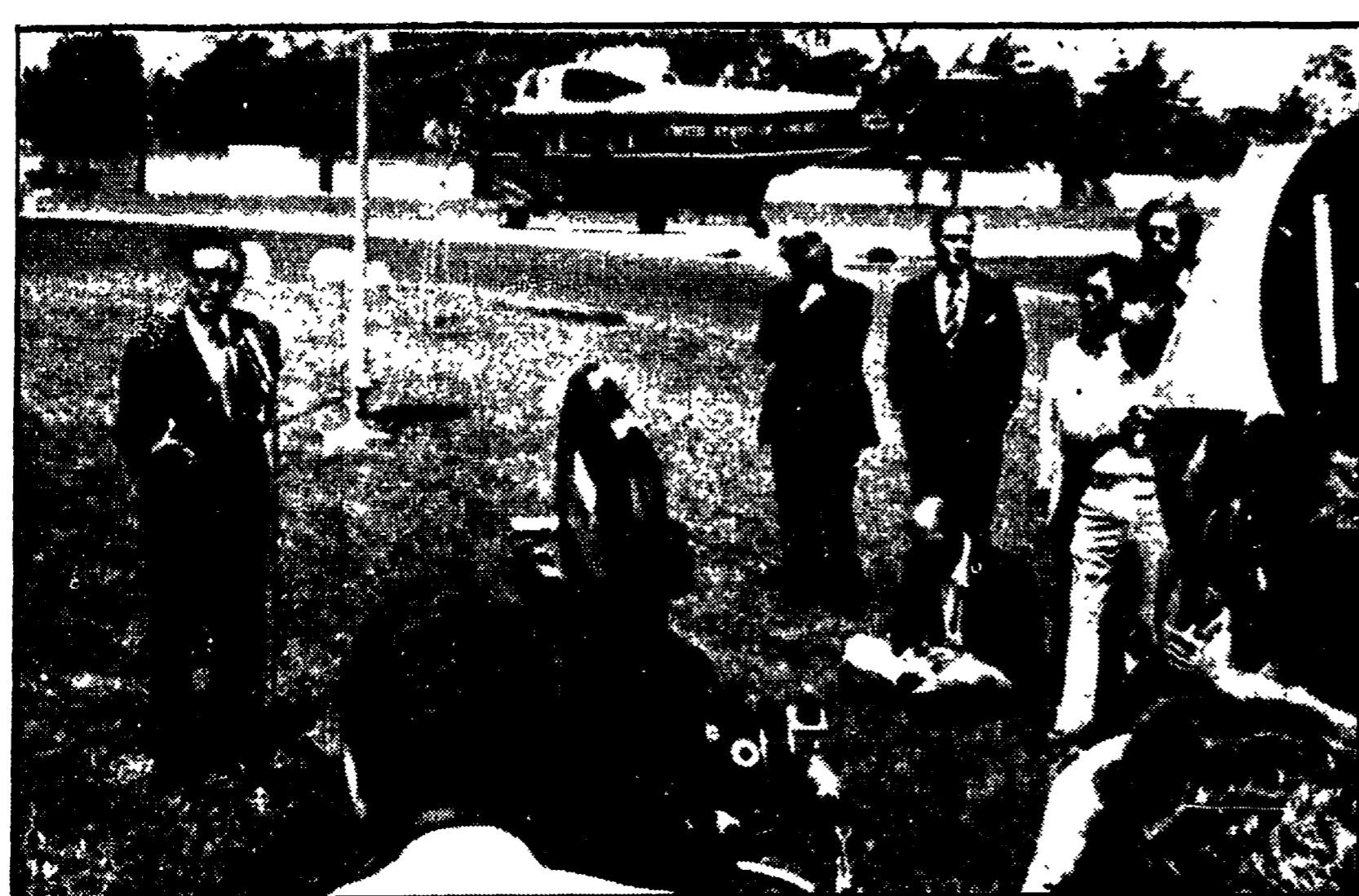
Il neo-Segretario di Stato Henry Kissinger durante la conferenza «all'aperto» di giovedì sera, nel giardino della residenza presidenziale di San Clemente.

ISPE La brusca presa di posizione di La Malfa è stata posta in relazione con alcune indiscrezioni trapelate nei giorni scorsi sulle elaborazioni compiute dall'ISPE (Istituto studi programmazione economica, collegato col ministero del Bilancio) circa le misure da adottare a sostegno dei redditi più bassi (pensioni sociali, pensioni minime dei lavoratori dipendenti e autonomi, assegni familiari e sussidi di disoccupazione). Ed è preoccupante che proprio l'ISPE abbia fatto rapidamente marcia indietro e sia tornato alla vecchia ricetta lamalfiana. L'Istituto ha infatti dichiarato ieri una nota ufficiale, secondo la quale il «rapporto» da cui sarebbero state dedotte le proposte di aumento dei minimi pensionistici «in realtà non esiste», giacché si tratterebbe soltanto di «un appunto tecnico» elaborato sulla base del fatto che «il problema dell'adeguamento dei redditi più bassi è stato posto soltanto come problema di principio». Ma ancora più grave è la successiva affermazione dell'ISPE secondo cui «prima di affrontare» tale problema «occorre compiere le verifiche di compatibilità» sia all'interno della finanza previdenziale, sia all'interno del bilancio dello Stato, sia nei «termini generali la cui sede propria è il piano annuale 1974».