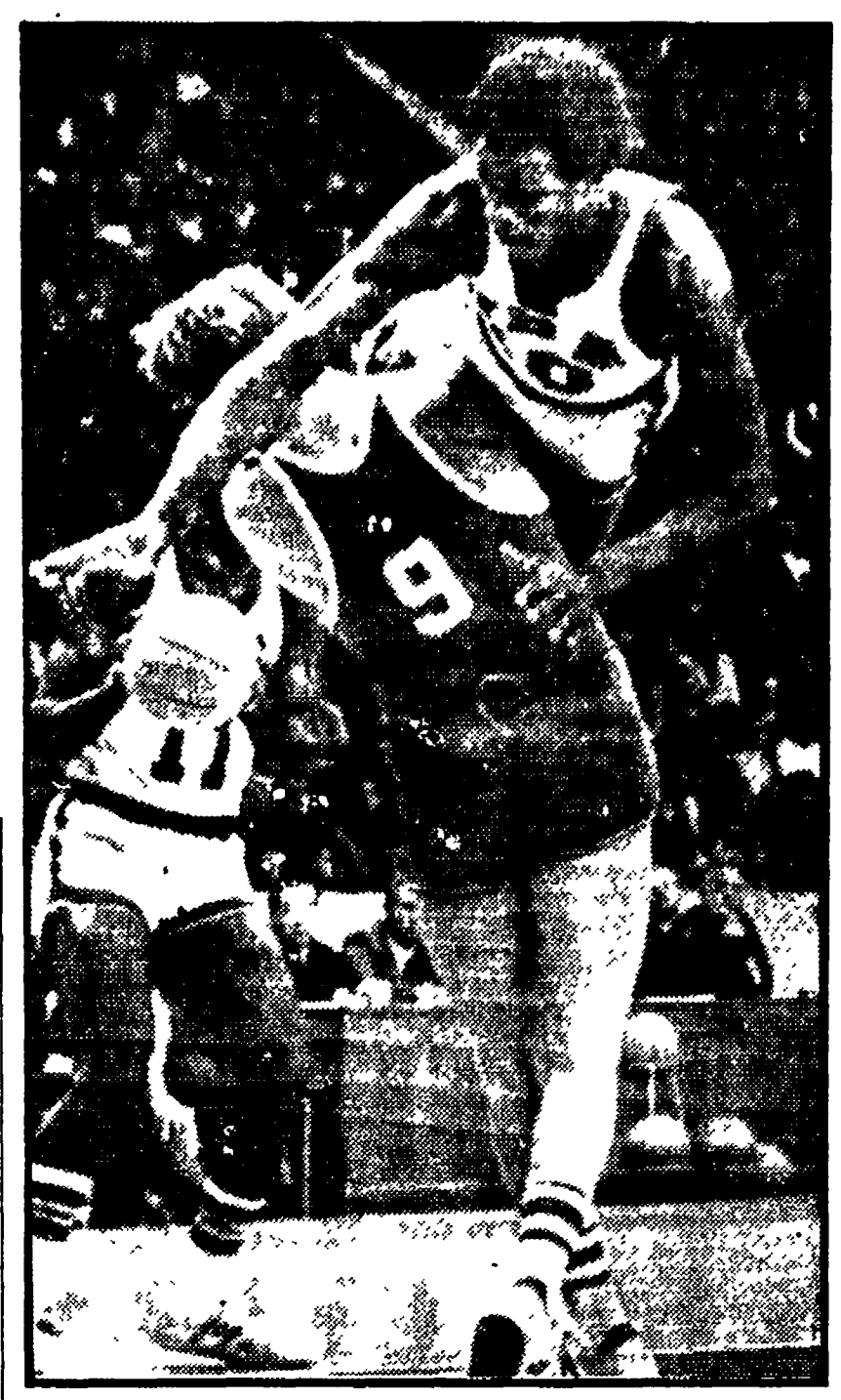
MOSCA - Una fase della finalissima di basket URSS-USA vinta dagli americani