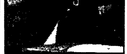
Il presidente Allende

Da giorni la destra aveva organizzato diverse forme di pressione e provocazione che, con il sostegno dei settori dell'esercito avversari ad Allende e Prats, dovevano porre quest'ultimo in una situazione insostenibile per la sua dignità di uomo e capo militare. Donne con grida isteriche sotto le sue finestre, folla, barricate, minacce di ogni genere, hanno creato il clima necessario all'operazione voluta dallo stato maggiore della sedizione.