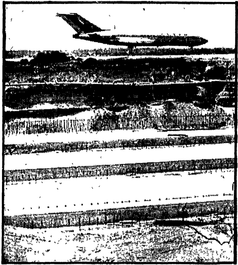
Un tratto della 3a pista durante i lavori di costruzione