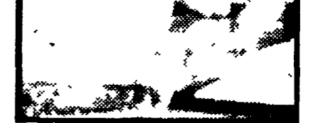
Il dimissionario generale Prats