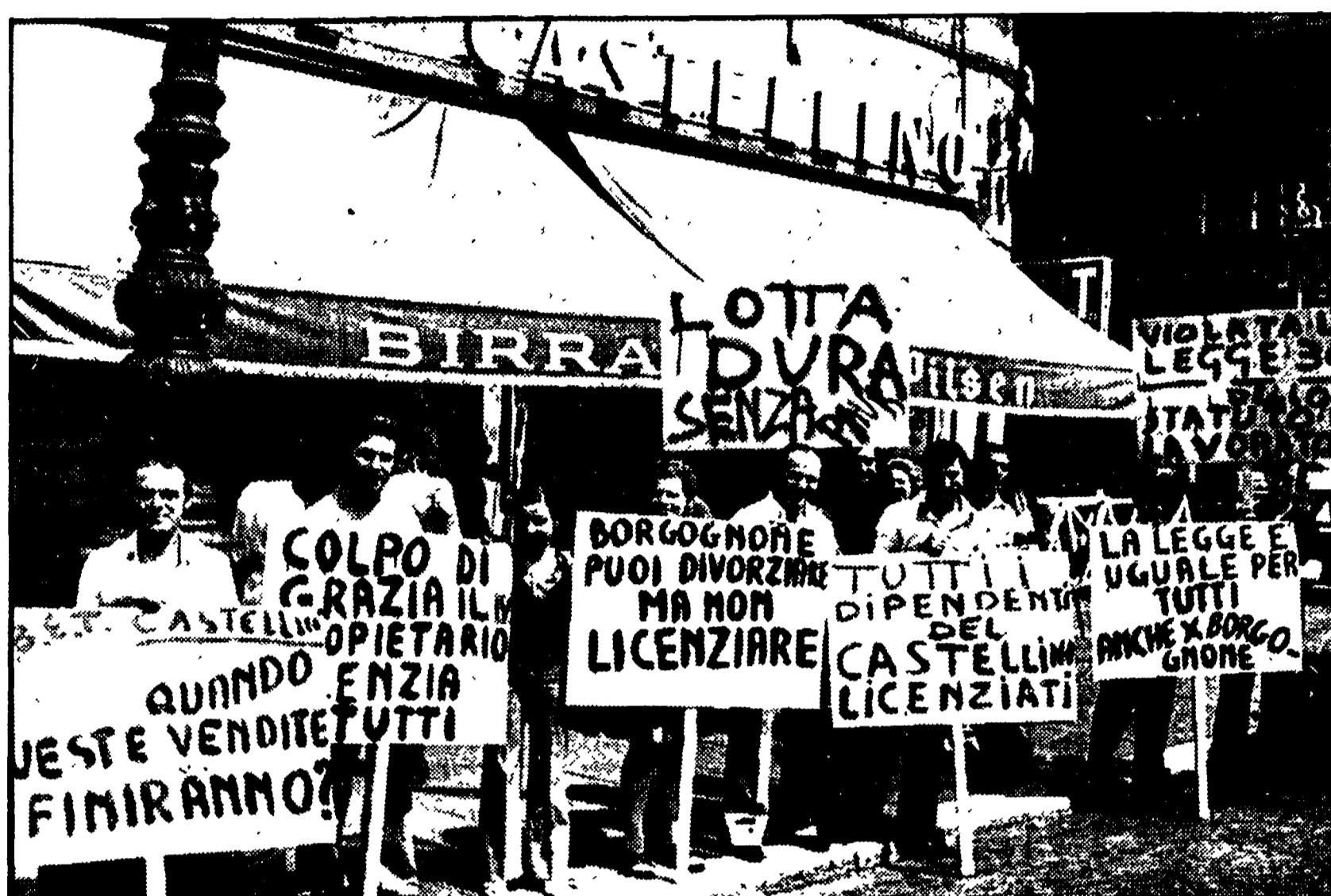
Una manifestazione di protesta dei lavoratori del bar Castellino