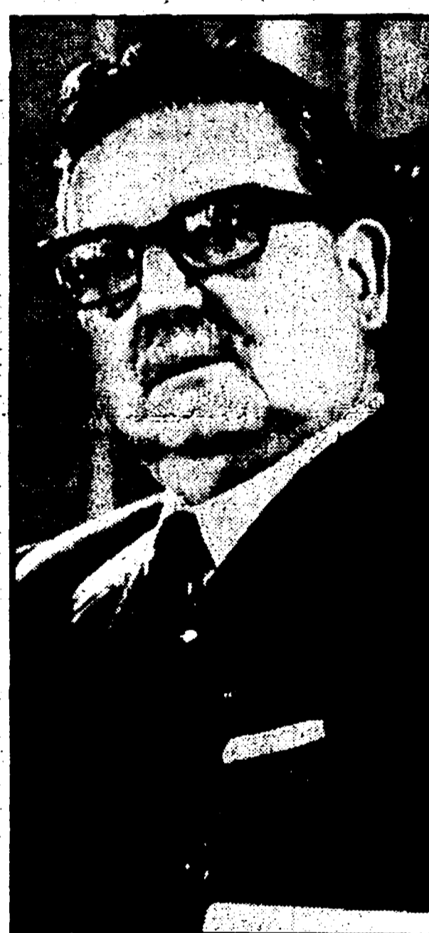
Il Presidente Salvador Allende. La foto è del luglio scorso. A destra: il palazzo presidenziale in fiamme sotto l'attacco sedizioso