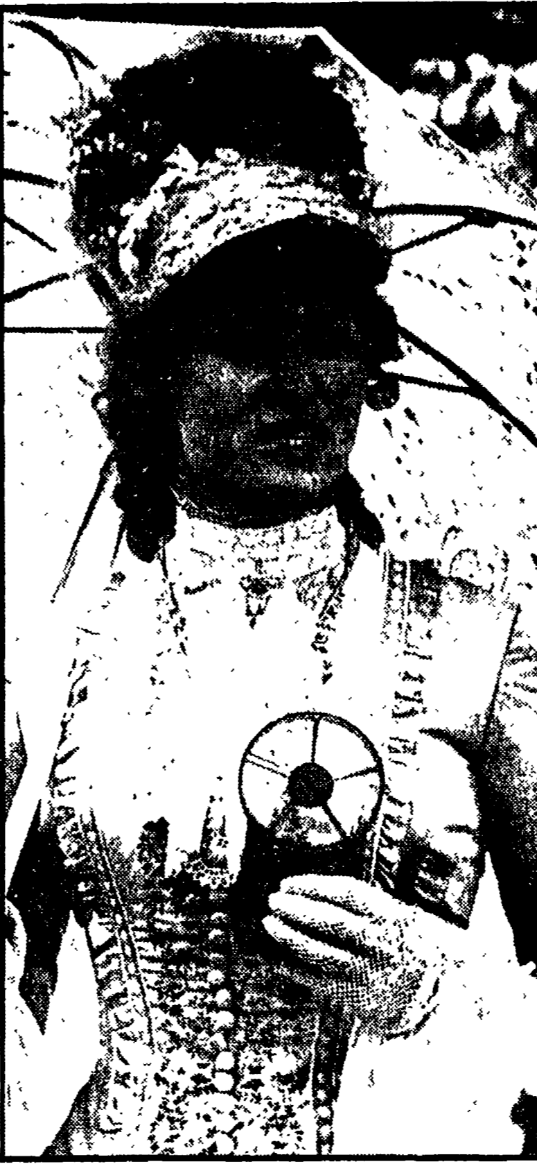
L'attrice Cybill Shepherd si rinfresca con un ventilatore portatile durante una pausa delle lavorazioni di Daisy Miller...