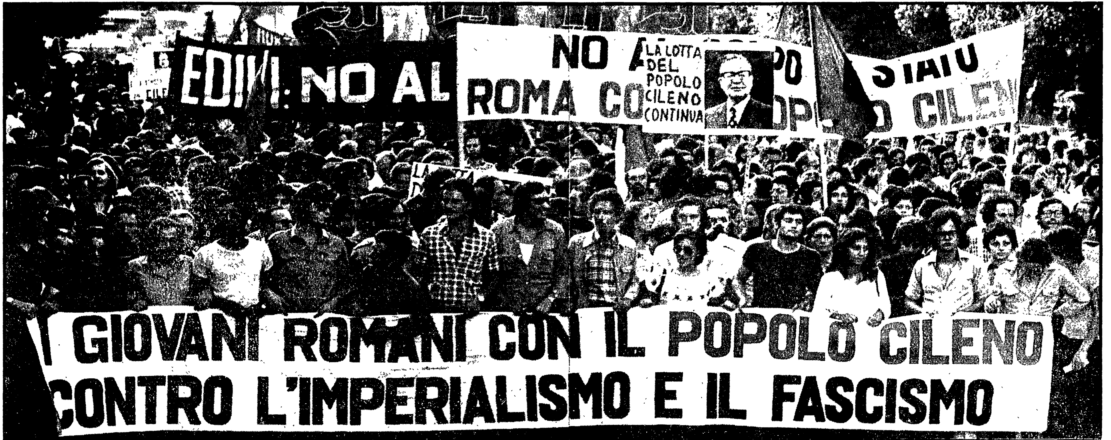
Un gruppo di giovani con un enorme striscione nel quale si esprime la solidarietà con il popolo cileno apre l'imponente corteo partito dall'Esedra