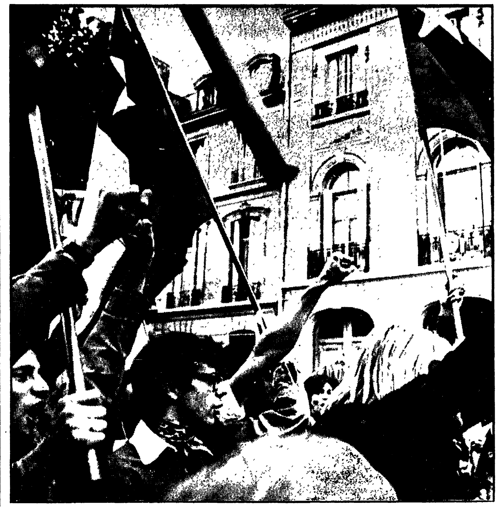
PARIGI — Il grande corteo di giovani mentre sfilava davanti all'ambasciata cilena

le non riconoscerà immediatamente la giunta militare cilena. Il portavoce ha detto: «Tradizionalmente il Brasile riconosce un nuovo governo soltanto dopo che la situazione è chiaramente e inequivocabilmente definita...»