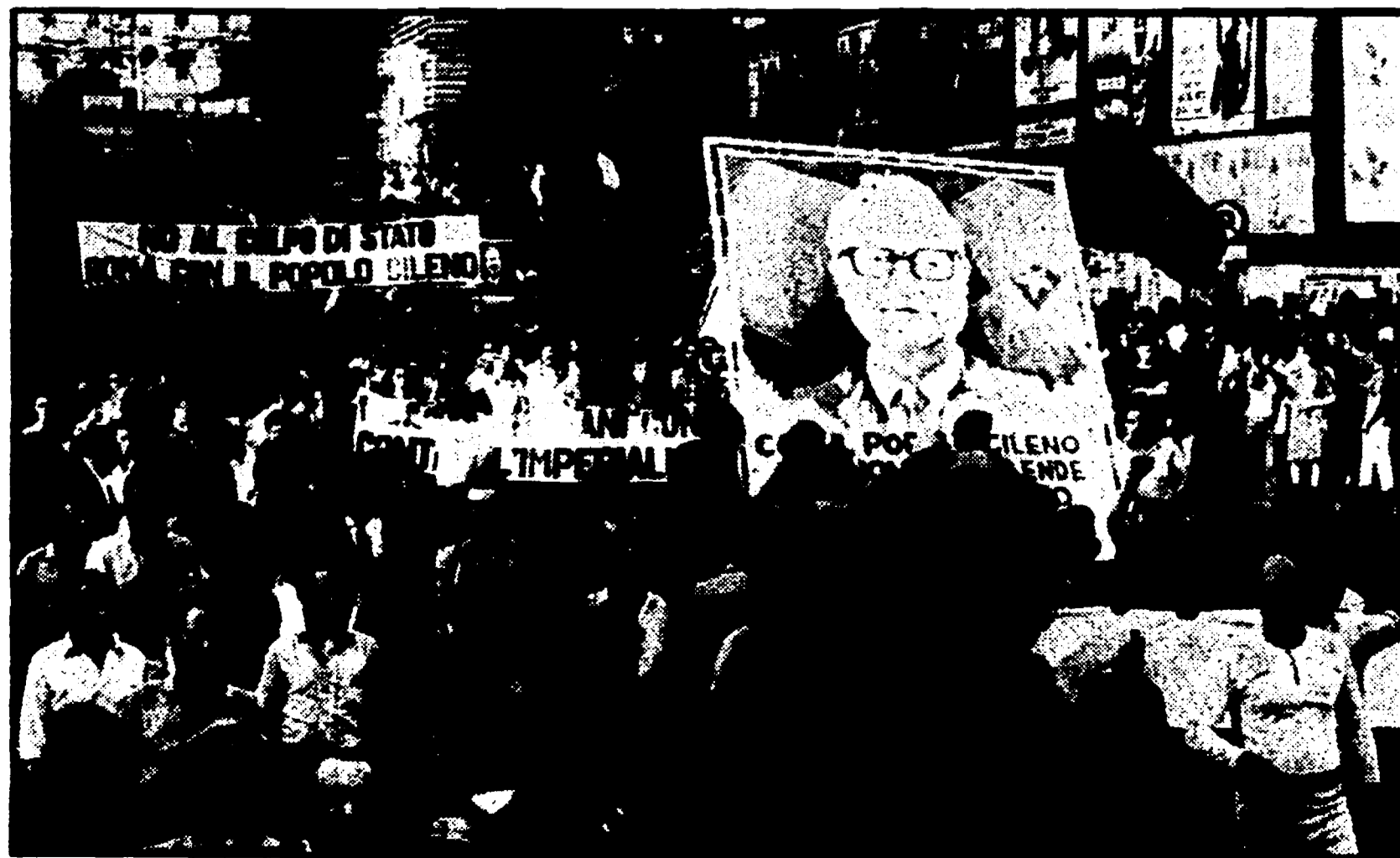
La testa del corteo unitario di migliaia di giovani che hanno manifestato ieri per le vie di Roma

Fermate nelle fabbriche milanesi, paralizzati i porti di Genova, Ancona e Piombino - La ferma condanna del PSI - Una dichiarazione di Fanfani - Una nota del governo italiano - Presa di posizione dei repubblicani - Commenti socialdemocratici - Una dichiarazione di Nenni e di altri uomini politici