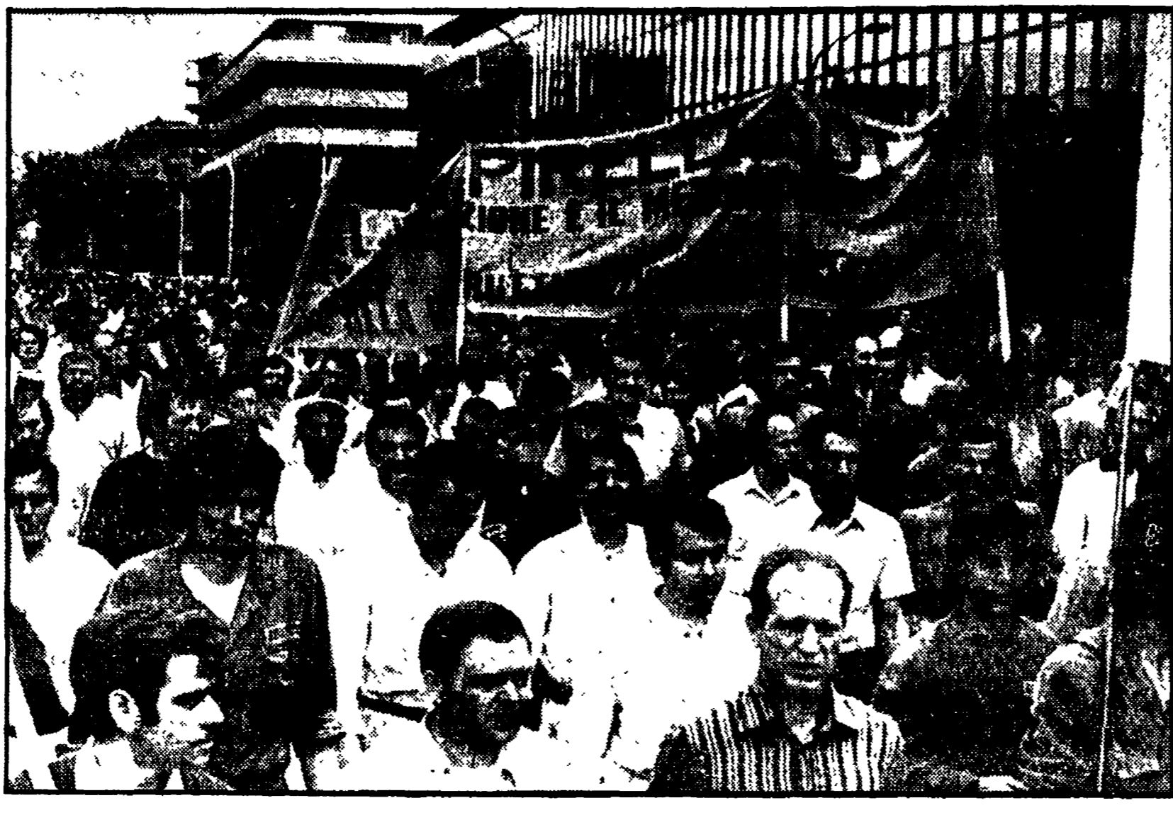
Una recente manifestazione dei lavoratori della Pirelli

250 persone; che le sospensioni dal lavoro avranno inizio entro il 31-1-1974 e termineranno entro il 30-9-1974; che ogni singolo lavoratore non regnerà sovrano dal lavoro più di nove mesi... «La società fornirà al sindacato le necessarie informazioni sullo sviluppo dei propri programmi di investimenti, con riferimento agli aspetti occupazionali, alle nuove installazioni ed alla loro localizzazione nel territorio nazionale...»