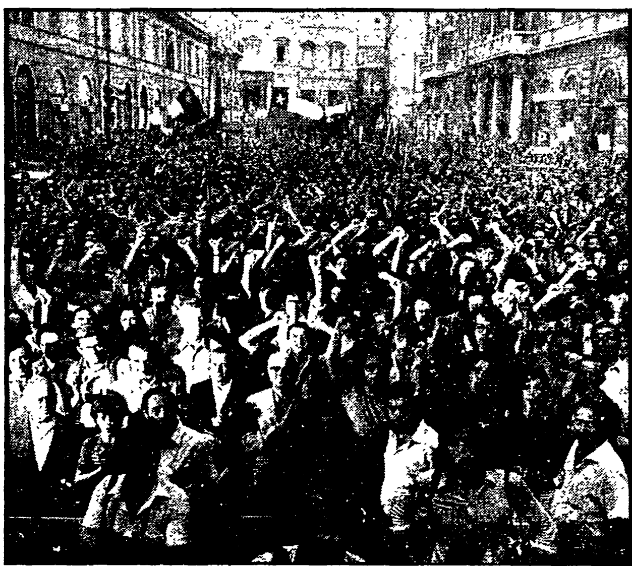
Un'altra immagine della manifestazione conclusasi a SS. Apostoli