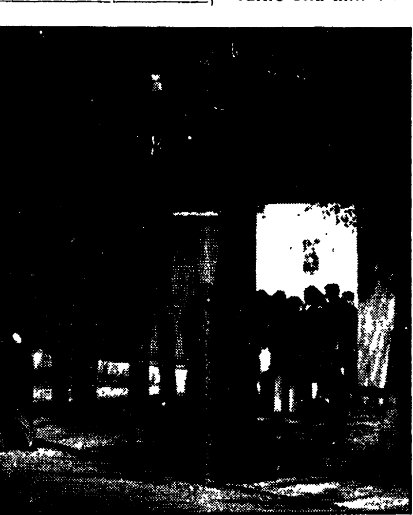
MADRID 11. Il vescovo ha invitato i manifestanti a rivedere il loro atteggiamento. «pena conseguenze derivanti da una grave disobbedienza».