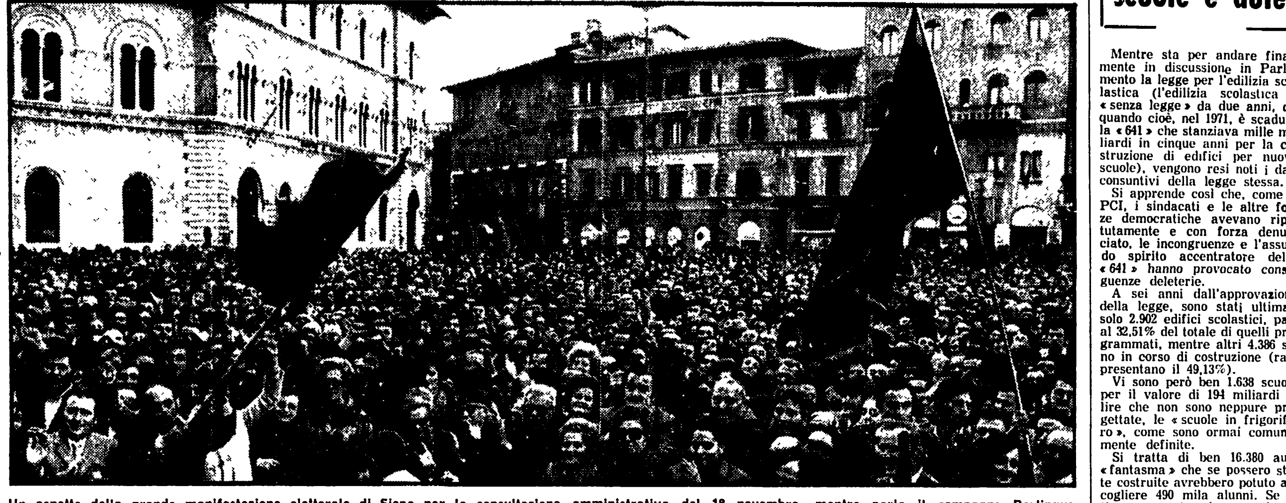
Un aspetto della grande manifestazione elettorale di Siena per la consultazione amministrativa del 18 novembre, mentre parla il compagno Berlinguer

BOLOGNA, 12. Nel corso della seduta del consiglio provinciale di Bologna è stato annunciato ufficialmente che una delegazione della martoriata provincia sudvietnamita di Quang-Tri (gemellata di quella bolognese) giungerà nel capoluogo emiliano mercoledì 14.