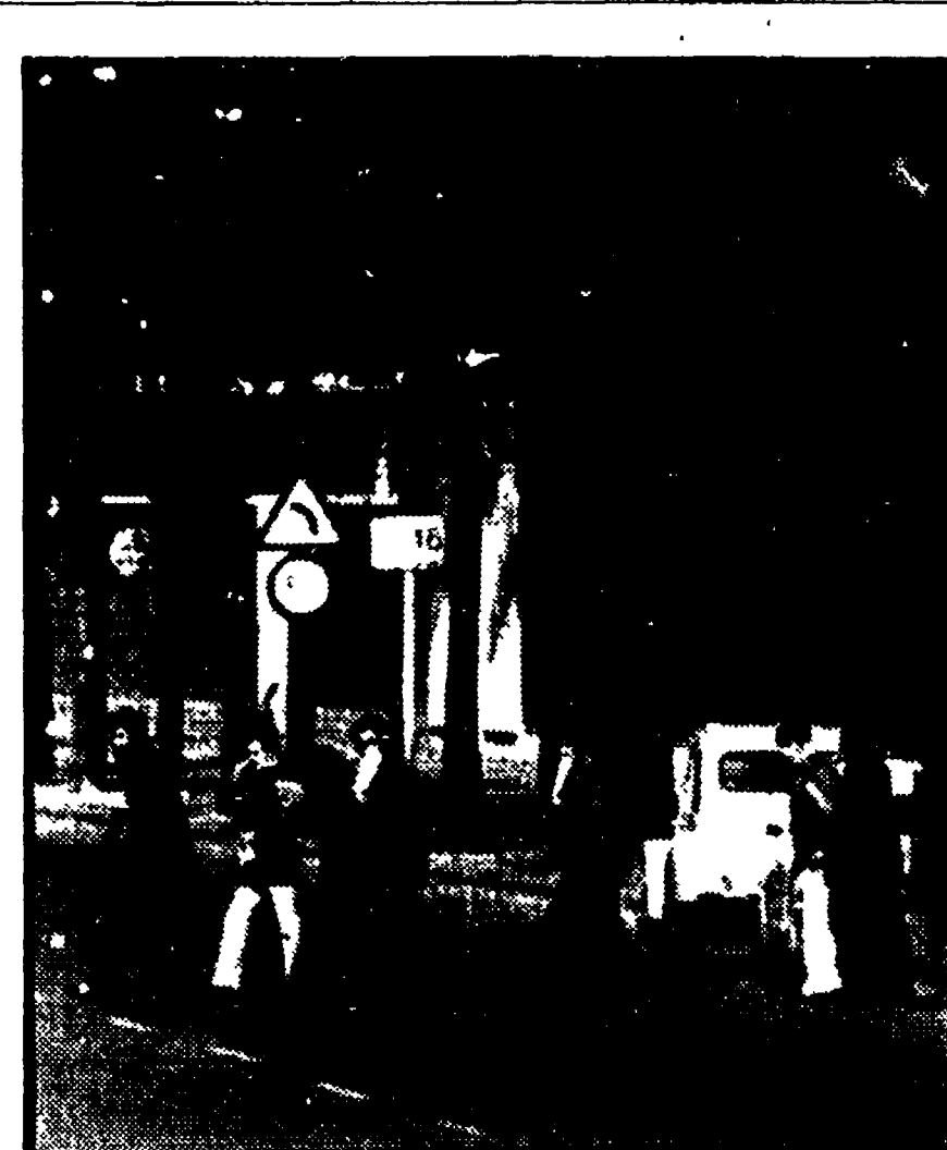
MADRID - Alcuni gruppi di occupanti lasciano la Nunziatura apostolica dopo che la polizia si è ritirata dalle adiacenze. L'occupazione dell'ambasciata vaticana è avvenuta in solidarietà con i preti baschi imprigionati dal regime franchista

Del resto, se il problema del prezzo fosse superato rimarrebbe sempre da chiedere al ministro in carica quale prezzo egli ritenga accettabile. In un'asta di 80 mila tonnellate di petrolio bruto tenuta la settimana scorsa una società petrolifera italiana ha acquistato a 12,64 dollari per fusto da 151 litri un barile di petrolio greggio dei paesi arabi è di 8,25 dollari per barile e il greggio della Libia si vende anche a 7,50 dollari al barile.