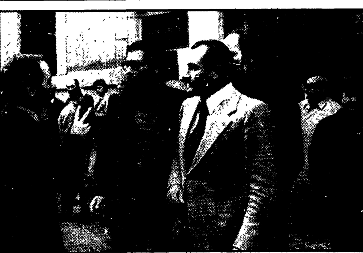
Sopralluogo per il delitto di via dei Pettinari