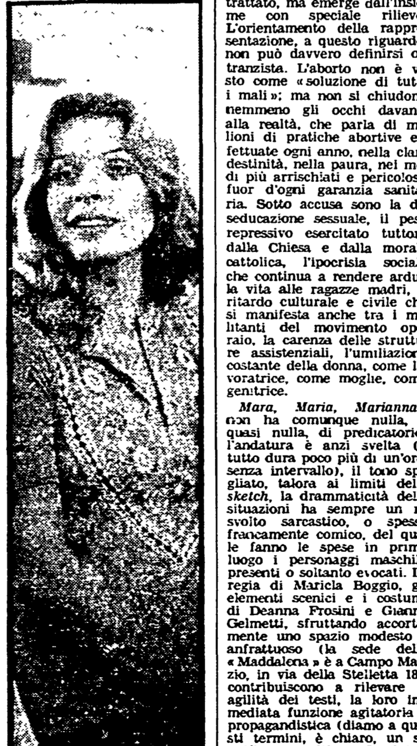
Senta Berger (nella foto), adeguatamente invecchiata con il trucco, interpreterà la parte di una madre autoritaria e aristocratica nel film «Di mamma ce n'è una sola»...

Testimonianze d'uno stato di soggezione non solo di tanto verso «il maschio» quanto e soprattutto verso la società capitalistica.