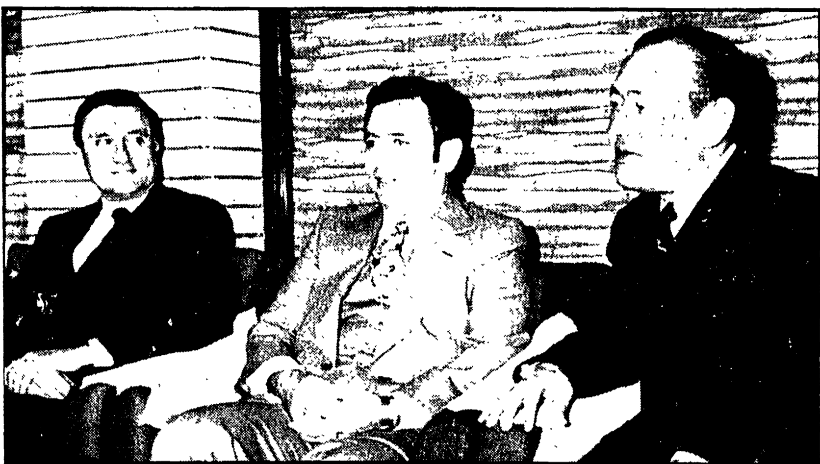
TOKIO — Il primo ministro giapponese Tanaka (a destra) fotografato con i ministri degli Esteri della Siria, Khaddam (al centro), e di Abu Dhabi, Adnan El Paciaci (a sinistra), poco prima dell'incontro che ha avuto per oggetto le forniture arabe di petrolio.