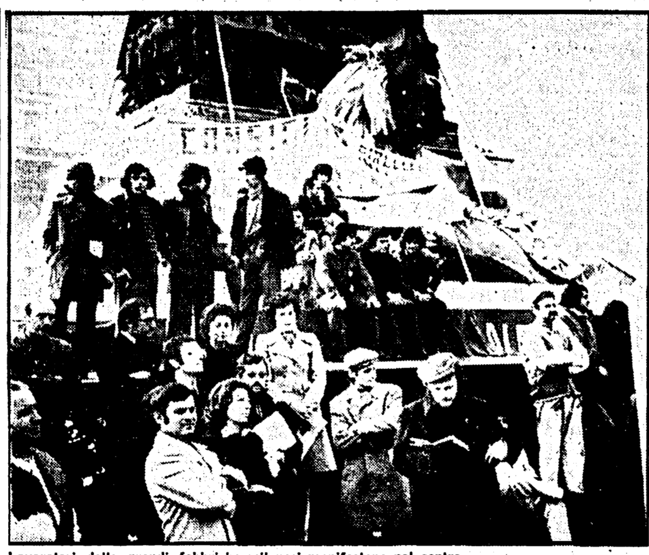
Lavoratori delle grandi fabbriche milanesi manifestano nel centro