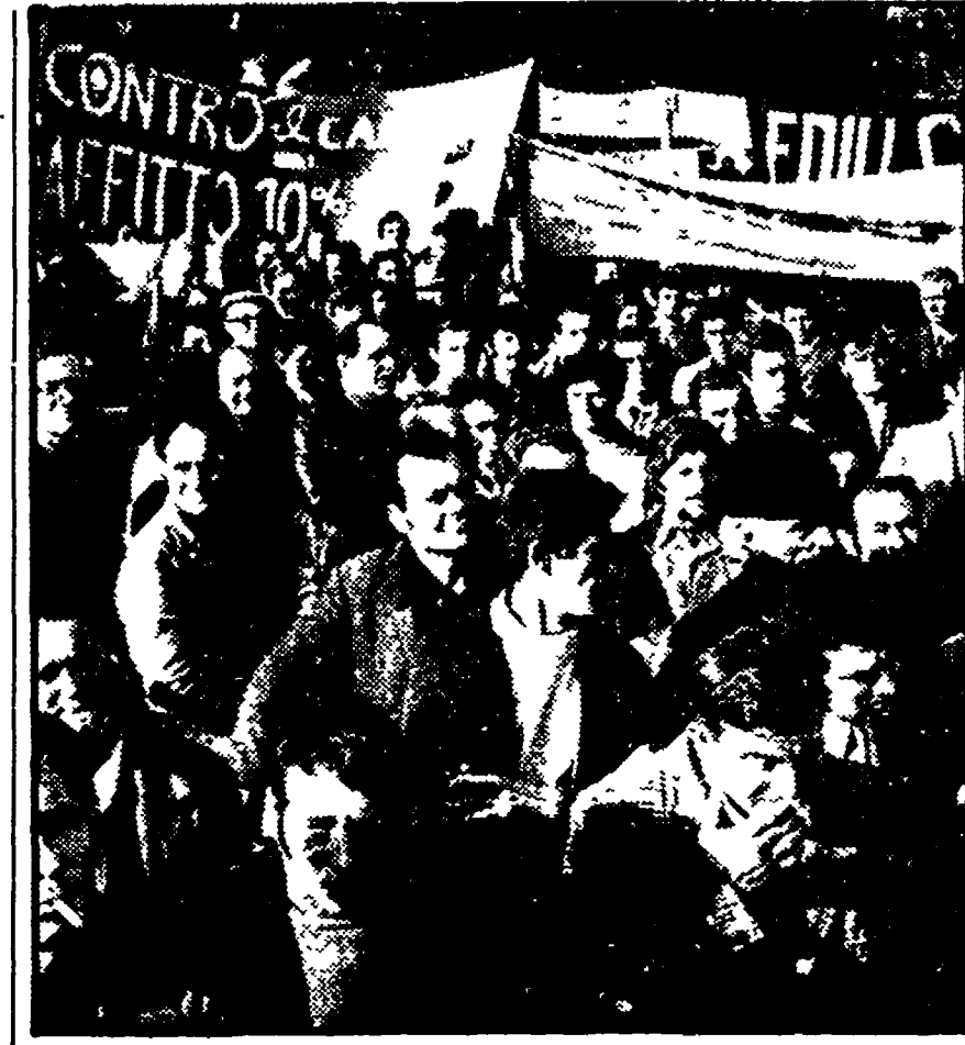
Migliaia di edili sono sfilati ieri in corteo

tutto antitetico al programma di sviluppo che il sindacato indica per ribaltare una situazione non più sostenibile.