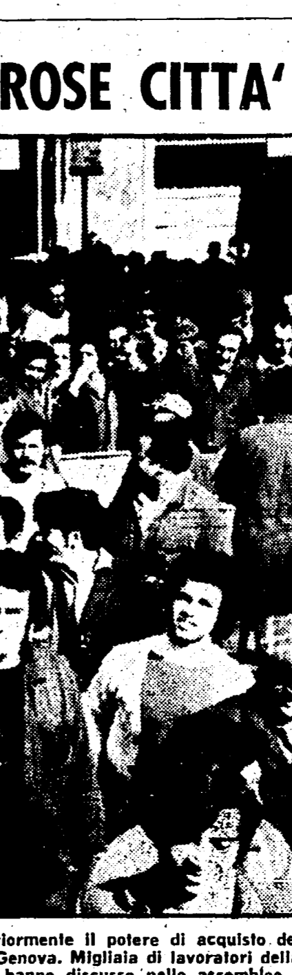
Immediata risposta operata e popolare alle gravi misure adottate dal governo che colpiscono ulteriormente il potere di acquisto dei lavoratori. Manifestazioni e cortei si sono avvolti ieri a Palermo, Taranto, Ivrea, Aosta, Siracusa e Genova. Migliaia di lavoratori della FIAT e dell'Alfa Romeo, lo sciopero dopo la rottura delle trattative per la vertenza di gruppo; hanno discusso nella foto i problemi dell'occupato. NELLA FOTO: il corteo a Palermo dei lavoratori del Cantiere Navale.

MANIFESTAZIONI E CORTEI IN NUMEROSE CITTÀ