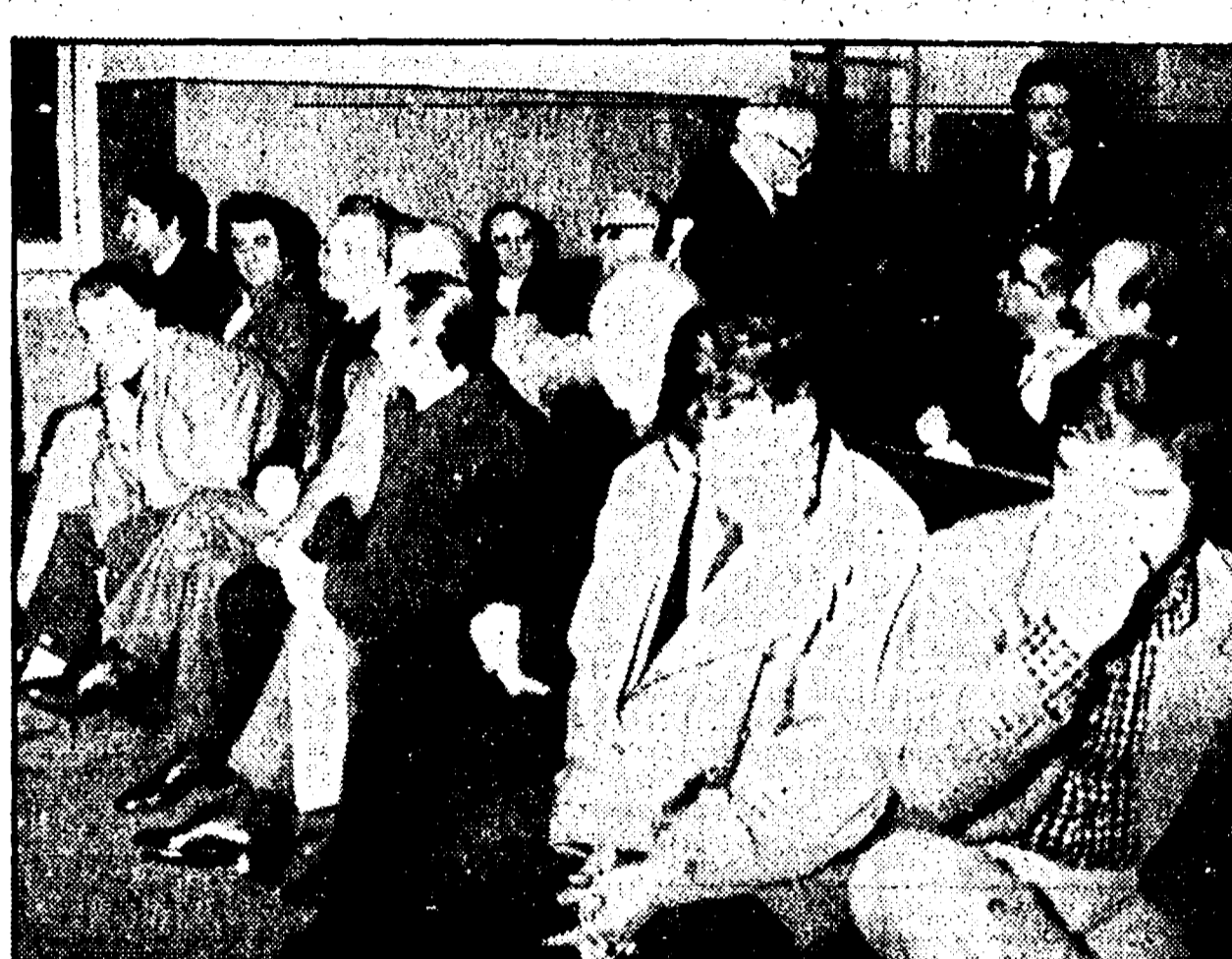
Dalla nostra redazione

L'editore di destra ha tentato di dividere gli autori dai giornalisti e dai lavoratori da lui querelati per le loro prese di posizione contro la sua politica monopolistica - Rinvio a nuovo ruolo