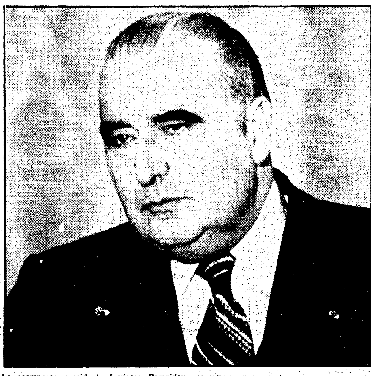
Lo scomparso presidente francese Pompidou