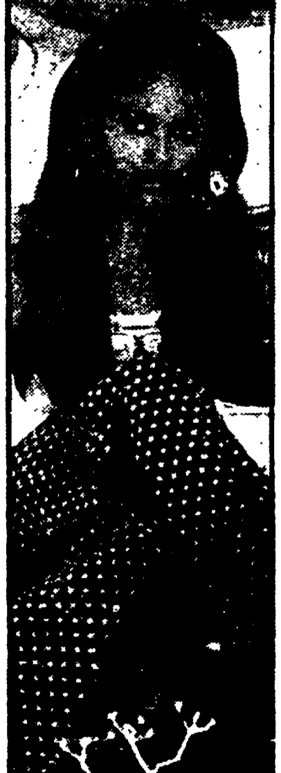
La regina di Saba, il mitico personaggio che venne dal lontano oriente per incontrarsi con il saggio Salomone...