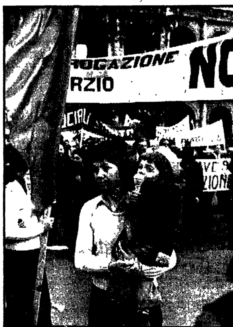
Il corteo di abitanti delle borgate, di lavoratori che ha manifestato dal Colosseo a piazza SS. Apostoli. A DESTRA: un particolare della manifestazione

Casa, equo fitto, servizi sociali. Scritti a grandi lettere su decine di striscioni, scanditi a gran voce, decine di volte sono stati questi gli obiettivi all'insegna dei quali migliaia e migliaia di abitanti delle borgate, di lavoratori, hanno sfilato ieri sera dal Colosseo a S.S. Apostoli, rispondendo con una partecipazione di massa all'iniziativa indetta dal SUNIA e dall'Unione borgate, con la adesione delle forze democratiche e dei sindacati.