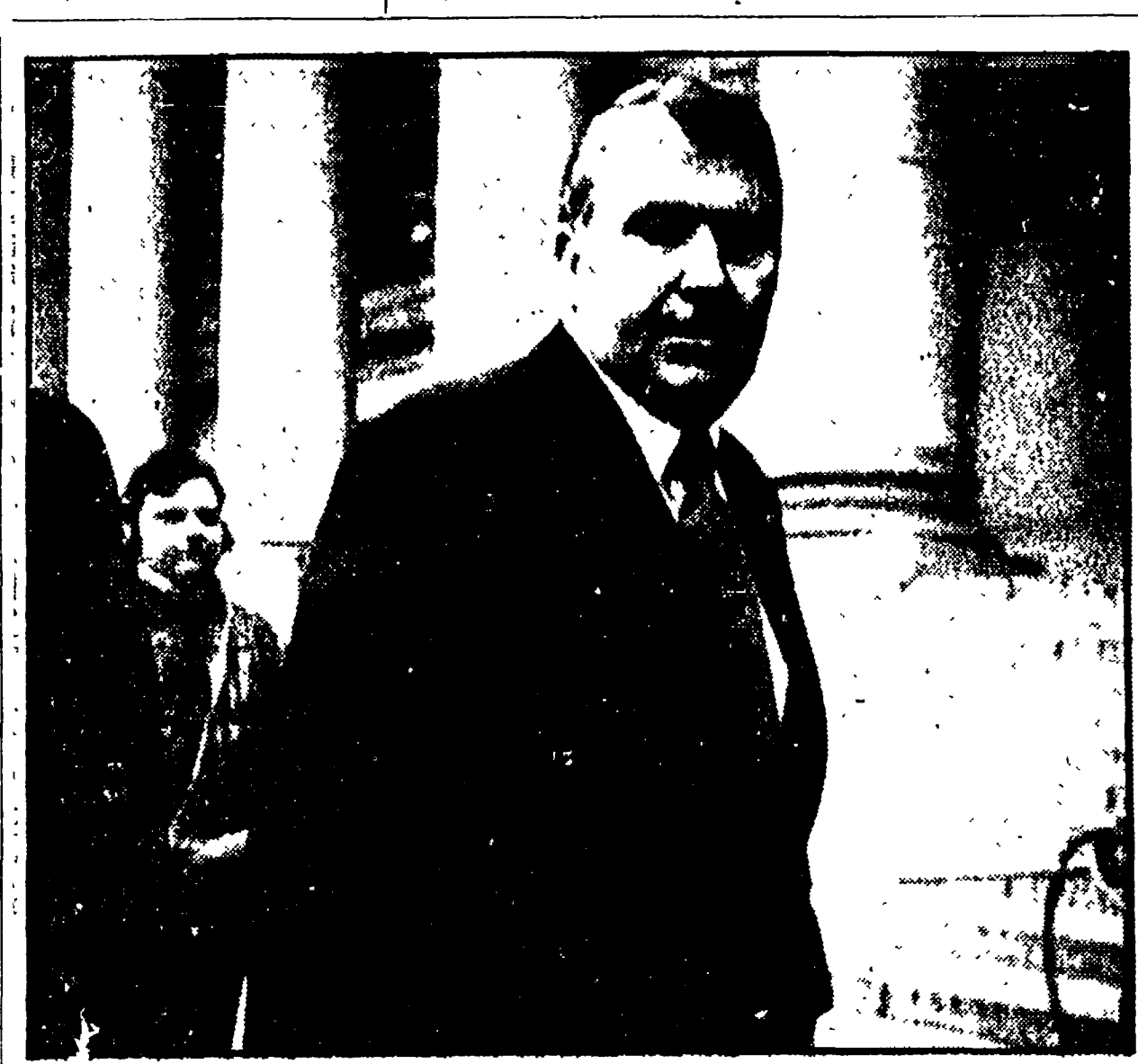
TESTIMONIA IL FRATELLO DI NIXON Donald Nixon, fratello del presidente, non è estraneo agli scandali della Casa Bianca...