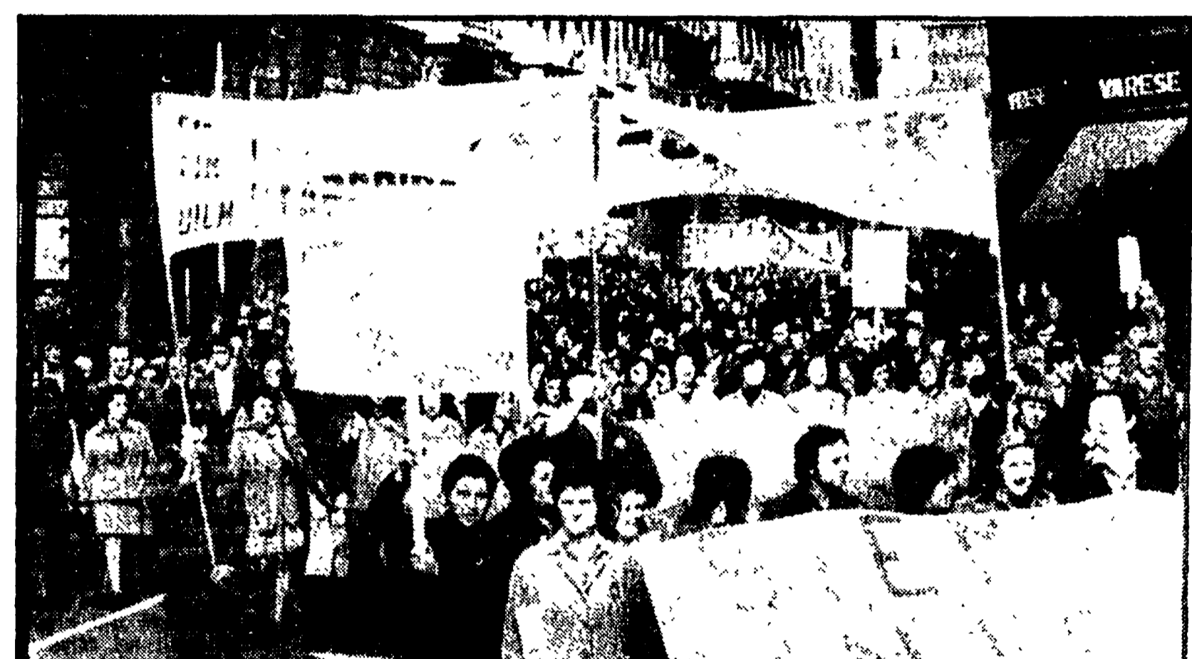
IN CORTEO PER LA SIT-SIEMENS. Parecchie migliaia di operai e impiegati degli stabilimenti Sit-Siemens di Milano e delle altre località italiane dove hanno sede le fabbriche del gruppo, hanno dato vita ieri ad una appassionata manifestazione per le strade del centro del capoluogo lombardo, da piazza Castello alla sede dell'Intersind, in corso Europa, passando da piazza del Duomo. Accanto a loro, in segno di solidarietà e di unità nella lotta, una folla delegazione dell'Alfa Romeo, l'altro grosso complesso a partecipazione statale. I dipendenti della Sit-Siemens è da tre mesi che stanno scioperando; da circa un mese hanno rotto le trattative ma nel pomeriggio di ieri si è appreso che nuovi incontri sono programmati per oggi presso il ministero del Lavoro. Nella foto: una manifestazione degli operai Siemens a Milano

Il quotidiano della Dc nella edizione del 27 marzo pubblica con rito in prima pagina una notizia con il seguente titolo: «Vittoria del GIP-Cisl alla Marelli di S. Salvo». Nel testo si legge che «un significativo successo ha ottenuto la lista dei Gruppi di Impegno Politico della Dc che, uniti alla Cisl, si sono presentati alle elezioni per i consigli di fabbrica nel grande complesso abruzzese della Magneti Marelli».