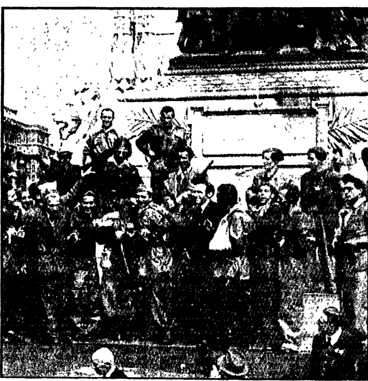
UN POPOLO ALLA MACCHIA