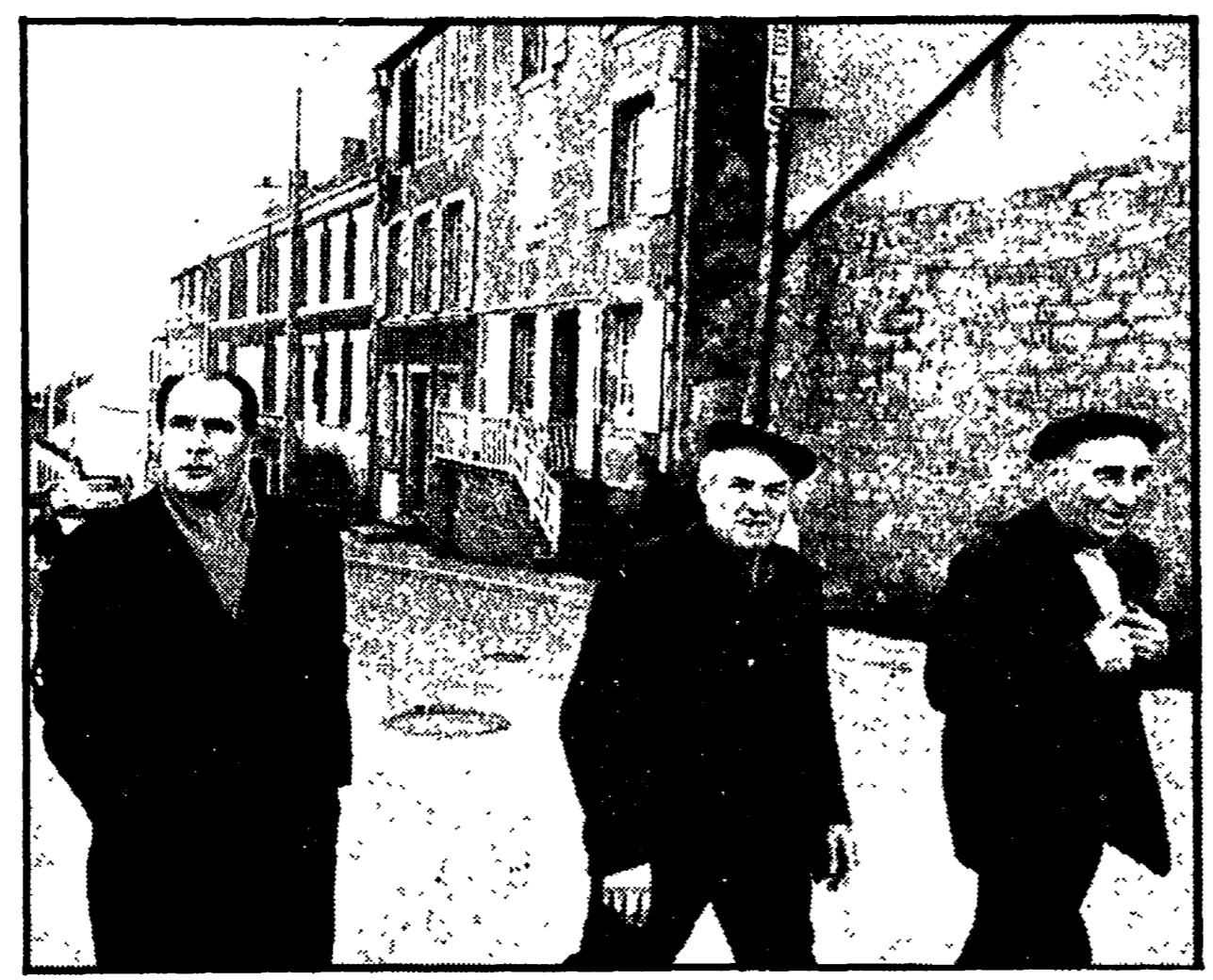
Il candidato presidenziale della sinistra François Mitterrand