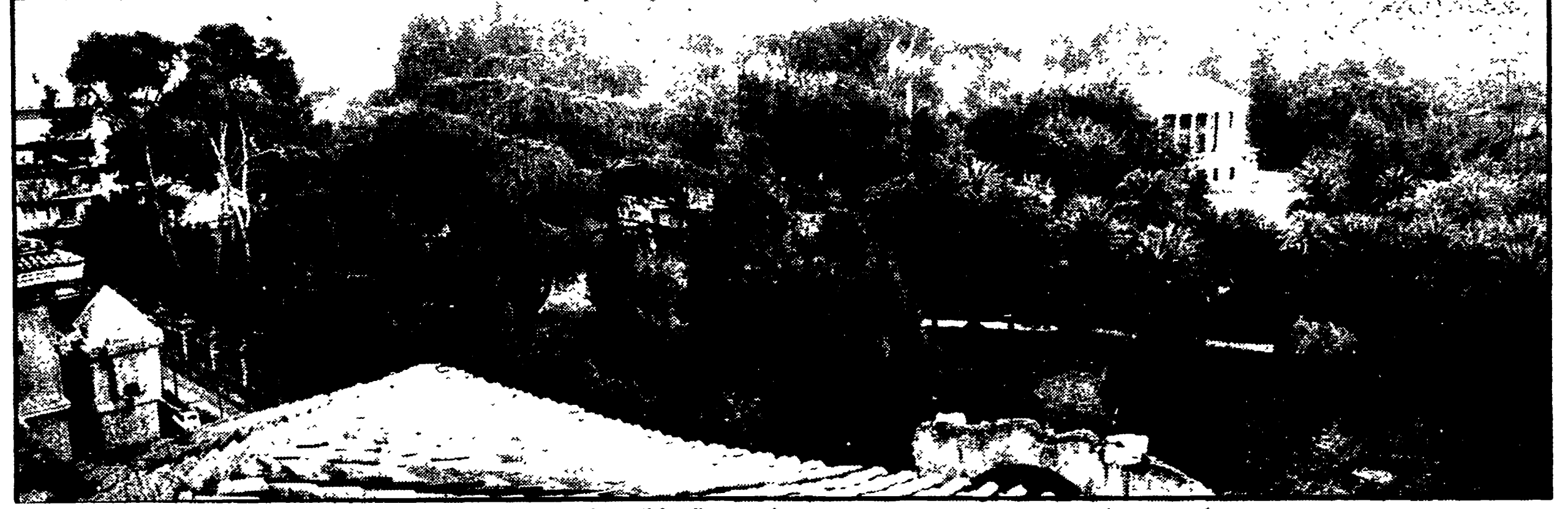
Una veduta di Villa Torlonia e del parco per i quali sono state avviate le pratiche di esproprio

Su quella parte del complesso che era stata venduta ai privati lo Stato eserciterà, invece, il diritto di prelazione Il Comune applicherà i prezzi fissati dalla legge 865 sulla casa - Primo risultato della battaglia popolare per il verde