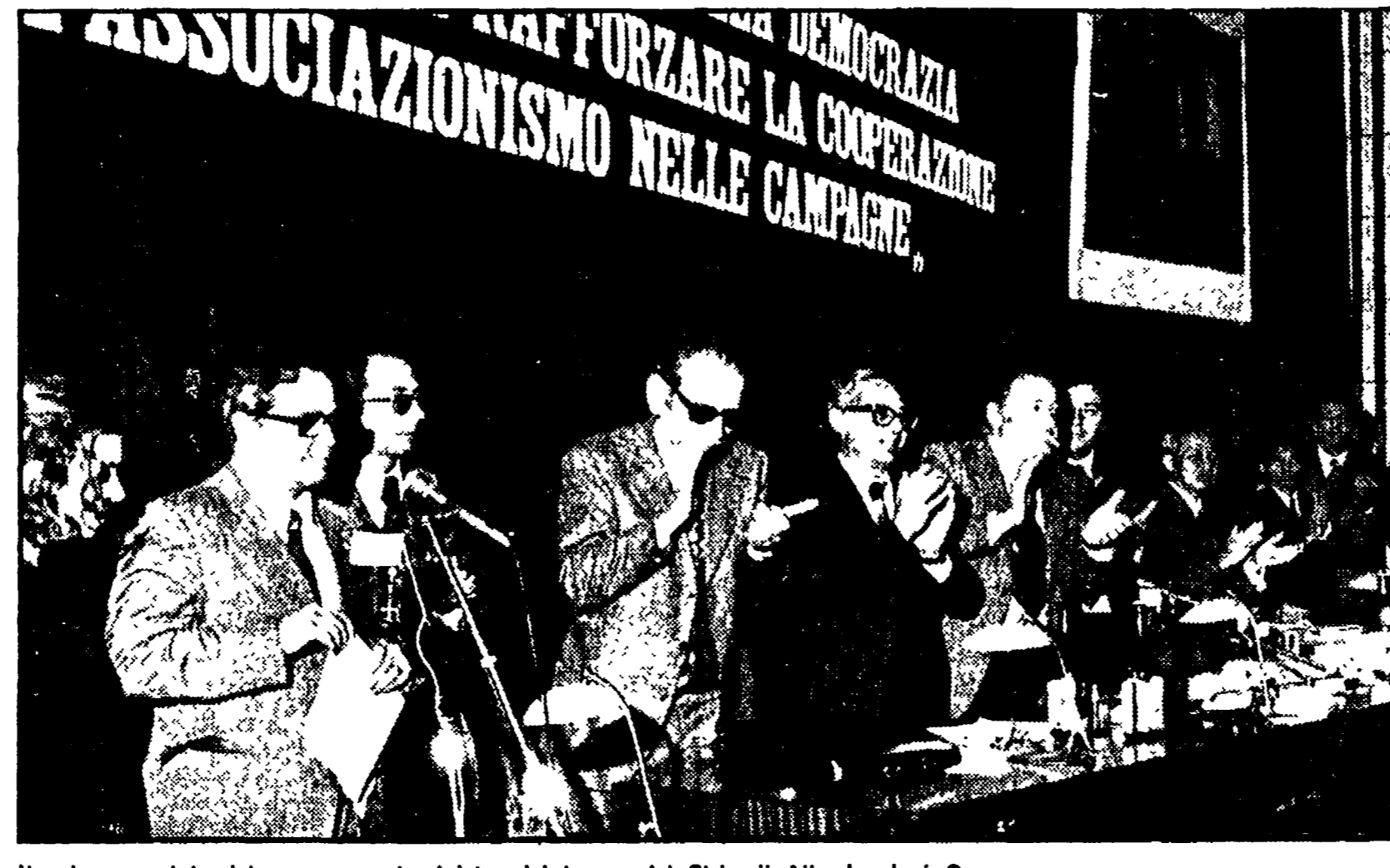
Il caloroso saluto del congresso al ministro del lavoro del Cile di Allende, José Oyarce