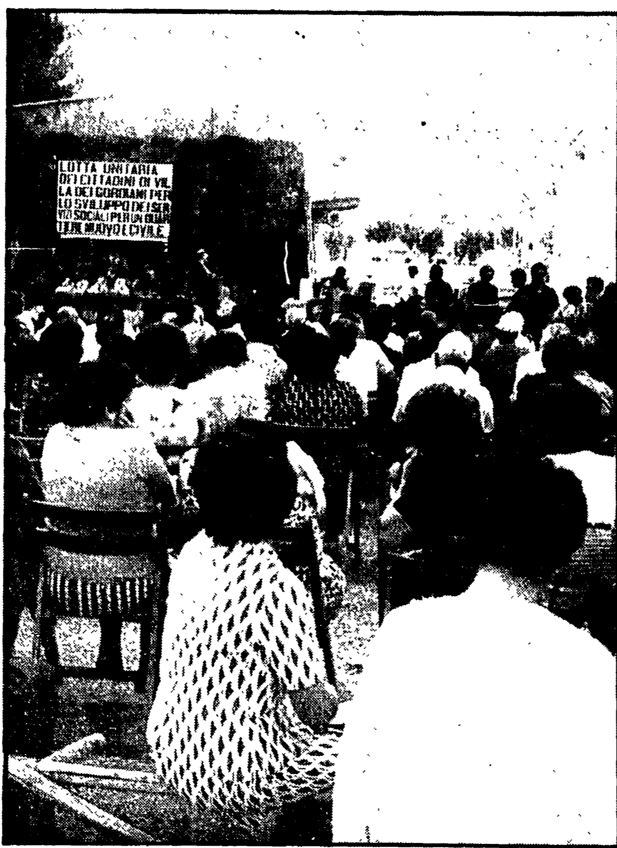
ASSEMBLEA PER I SERVIZI A VILLA GORDIANI Si è svolta ieri presso la villa di Villa Gordiani una assemblea popolare dei cittadini di Villa Gordiani...