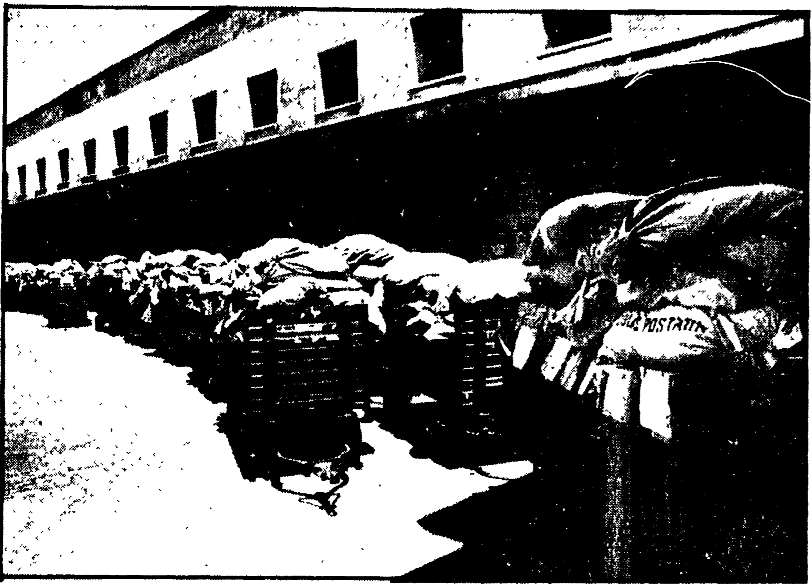
Un «convoglio» di carrelli carichi di sacchi pieni di posta lungo un marciapiedi della stazione Termini

«Per noi della PS la Repubblica democratica non esiste. Siamo considerati come al tempo dei Borboni. Abbiamo dovuto venire qui di nascosto...»