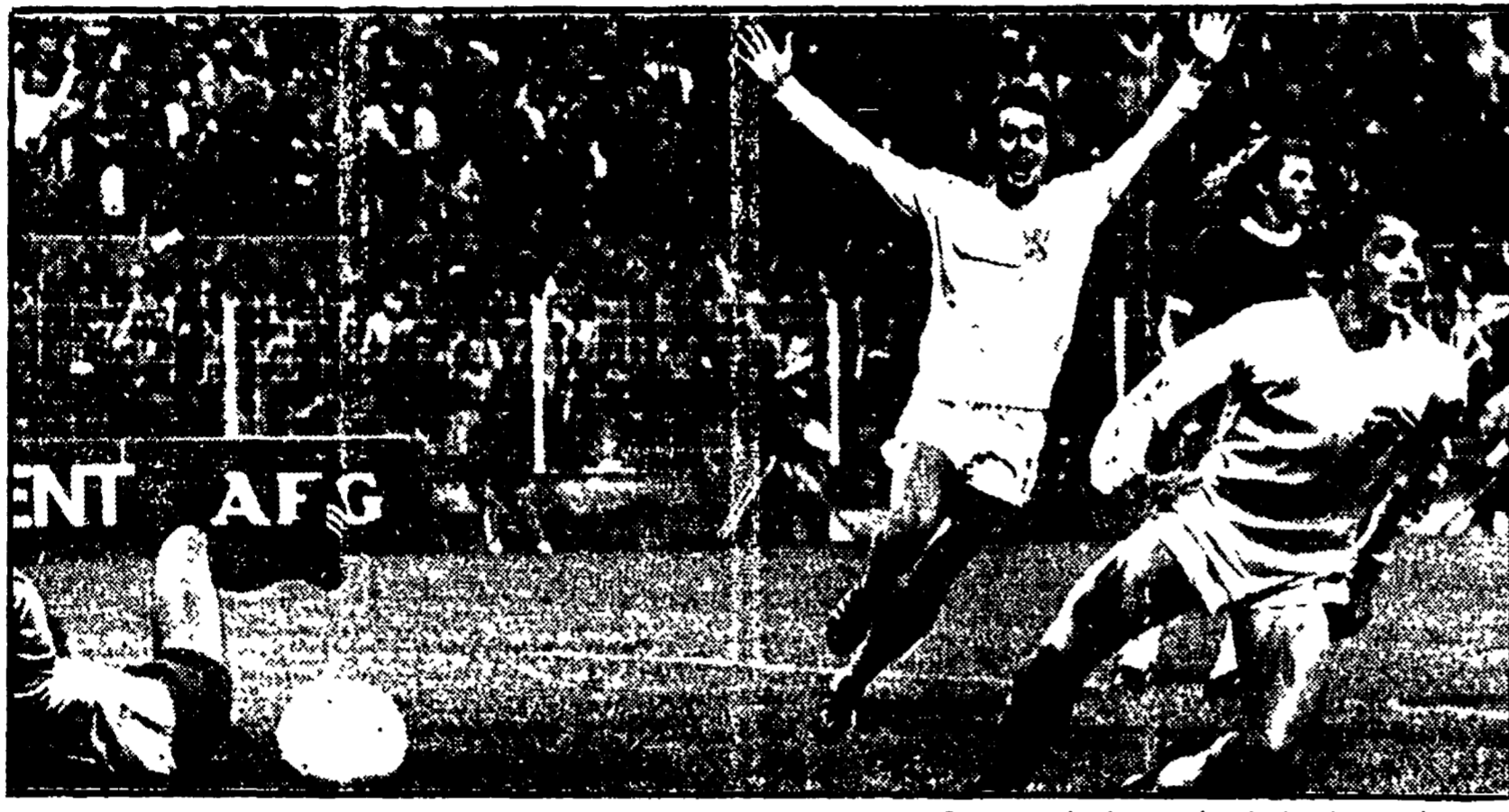
Rep esulta dopo il secondo gol segnato dall'Olanda ai Brasiliani, che le è valsa l'ammissione alla finalissima della Coppa del mondo

MONACO. 4. Cinque ore di interminabile autostrada da Francoforte via Norimberga e siamo qui, a Monaco, per la «due giorni» mondiale.