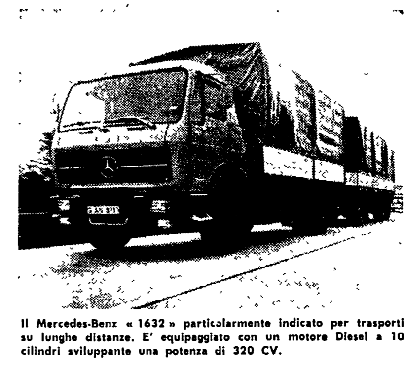
Il Mercedes-Benz «1632» particolarmente indicato per trasporti su lunghe distanze. E' equipaggiato con un motore Diesel a 10 cilindri sviluppante una potenza di 320 CV.

La Daimler-Benz ha immesso in questi giorni sul mercato tedesco una gamma di autocarri pesanti che ha definito di «Nuova generazione» nella classe da 16 a 26 tonnellate.