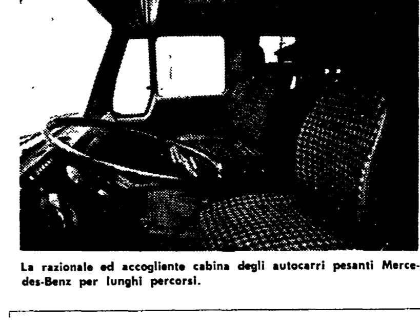
La razionale ed accogliente cabina degli autocarri pesanti Mercedes-Benz per lunghi percorsi.

I vantaggi di questa soluzione sono evidenti: non solo consente una razionalizzazione produttiva e di conseguenza un notevole risparmio dei costi di produzione, ma assicura anche facilità di reperimento e di immagazzinamento dei pezzi per il cambio, bassi costi di manutenzione e assistenza.