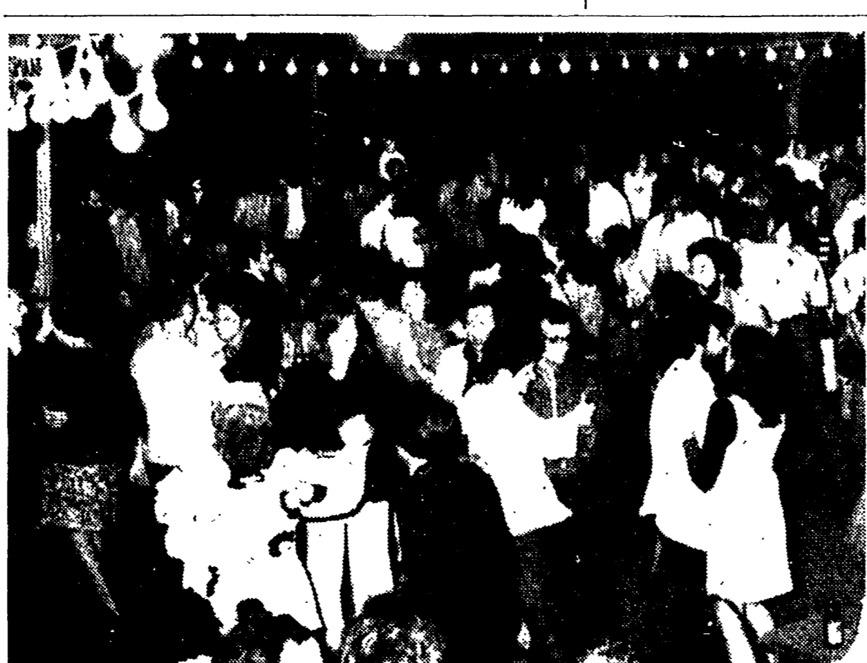
LA DANZA DEL 14 LUGLIO. Parigi - Grandi festeggiamenti popolari il 14 luglio, l'anniversario della presa della Bastiglia. Un interminabile ballo all'aperto si è svolto a cominciare dall'altra notte dell'île Saint Louis, nel cuore di Parigi.

Ma si vuole cogliere il segno di un mutamento di linea nelle dichiarazioni fatte ieri dal ministro delle Informazioni, Yairiv, quando ha detto che Israele tratterebbe con l'Olp se questa riconoscesse Israele e mettesse fine agli attacchi terroristici.