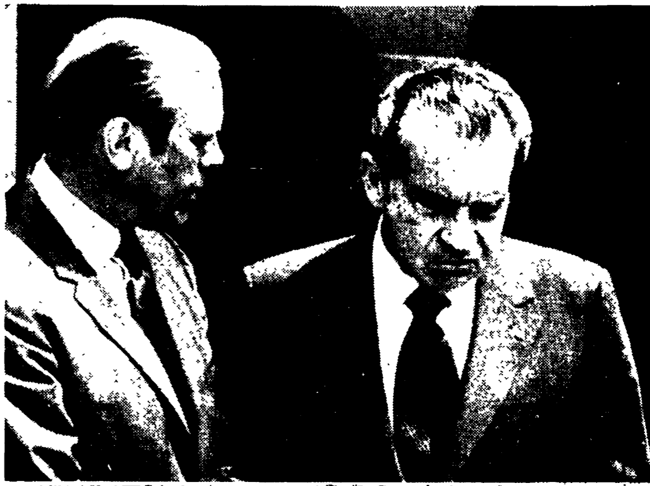
WASHINGTON — Il Presidente Nixon — assieme al suo vice Gerald Ford (nella foto) — si trova a San Clemente dove sta trascorrendo un periodo di vacanza. Egli sta meditando sul futuro dopo la condanna del suo ex consigliere Ehrlichman e la presentazione della relazione sul caso Watergate. Le quotazioni di Nixon sono estremamente basse. Un'indagine svolta dall'Istituto Gallup afferma che se domani si svolgessero le elezioni il senatore democratico Edward Kennedy vincerebbe su Ford, mentre Nixon sarebbe completamente fuori causa avendo raggiunto il più basso livello di popolarità mai toccato finora nella sua carriera.