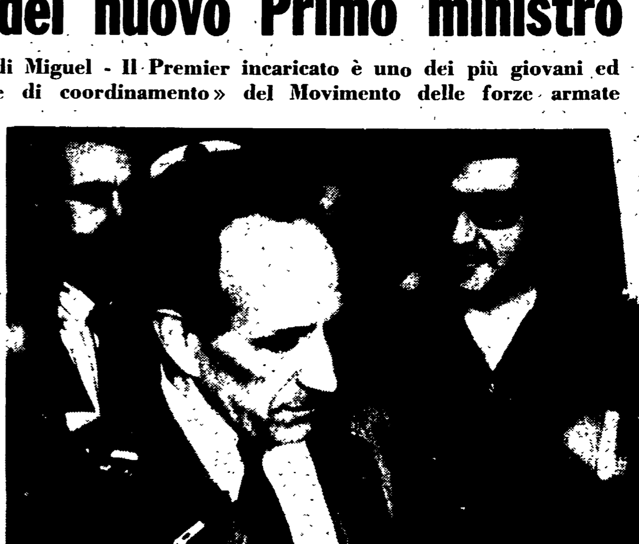
LISSBONA — Il nuovo Primo ministro Goncalves attorniato dai giornalisti.

TRIESTE, 14 luglio. Si è conclusa oggi, dopo cinque giorni di intenso dibattito, la Conferenza europea sulle minoranze che si è svolta in questa città. Il ministro del Tesoro Colombo (dichiarazione alla Stampa) ha detto di augurarsi che il Parlamento si «attesti sulle posizioni».