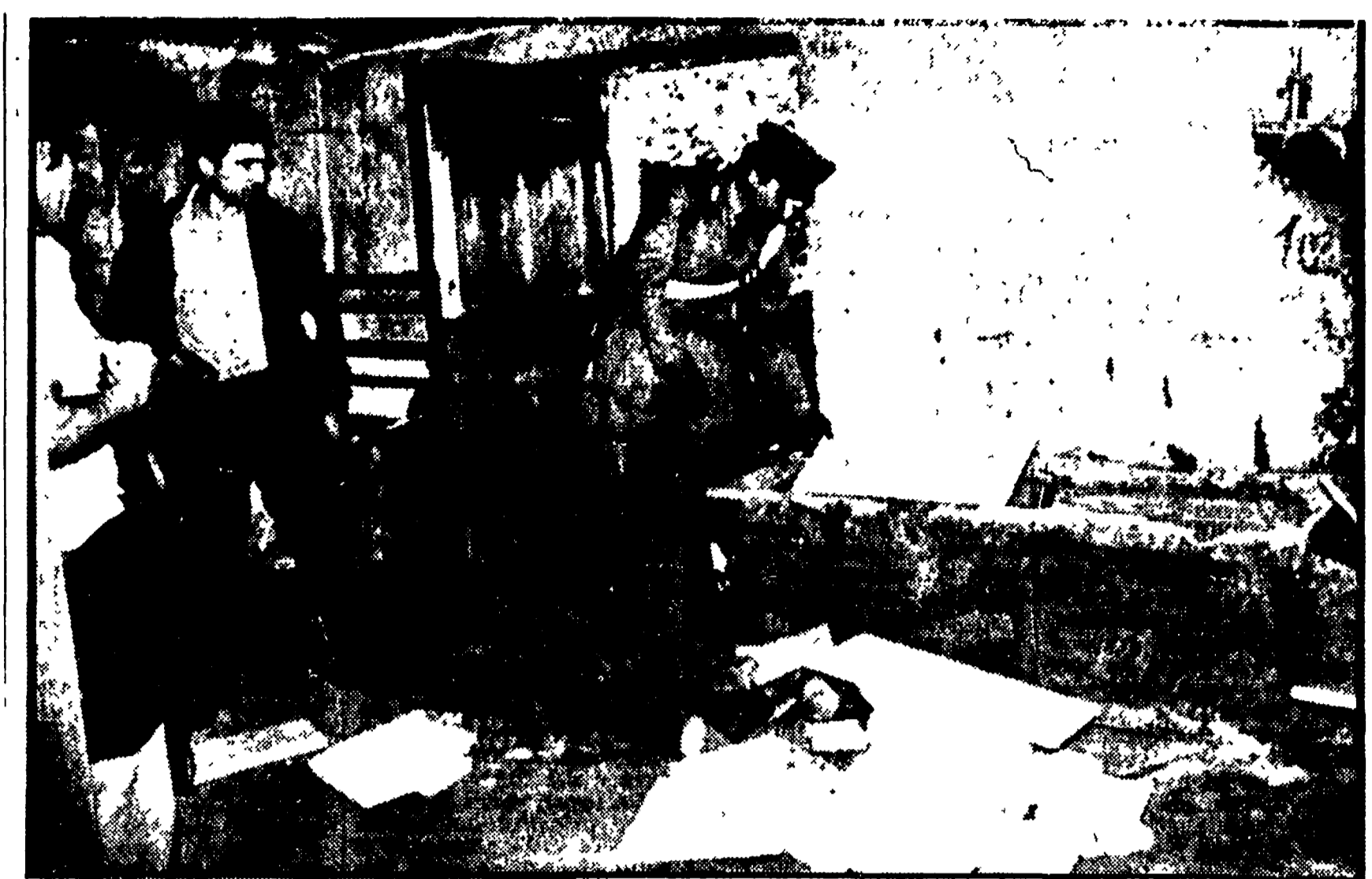
L'ARSENALE DI VAL DI SUSA. Il casolare scoperto in Val di Susa adibito a deposito di esplosivo e di armi dai fascisti era quasi sicuramente fa parte di una vasta ramificazione di rifugi che da anni i dinamitardi stanno preparando nella zona, ma anche altrove. Recenti scoperte d'altra parte confermano l'esistenza di decine di queste basi, dislocate in punti strategici. Ad esempio nel linee dell'alta tensione e acquedotti, tutti possibili obiettivi di Val di Susa, nella caspanca è stata trovata la dinamite