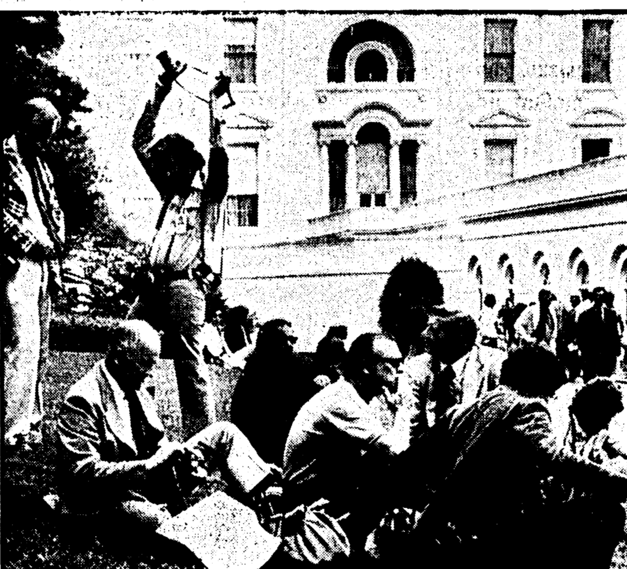
WASHINGTON - Giornalisti e fotografi in attesa sul prato di fronte alla Casa Bianca dove si svolge la riunione dei ministri presieduta da Nixon