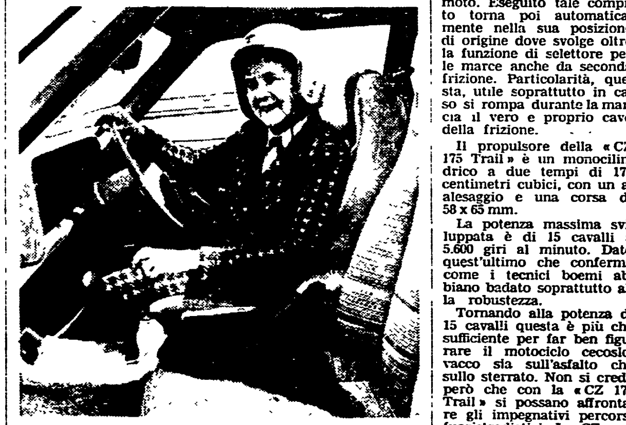
Mary Grannie Bruce — detentrici di 27 record mondiali prima che, quasi mezzo secolo fa, si ritirasse dalle corse — voleva a tutti i costi provare una macchina moderna su un circuito moderno; e così le è stata offerta la possibilità di guidare una «Capri II Gha 3 litri» a Thruxton, in Inghilterra.

La linea della «CZ 175 Trail» è tozza e pesante ma, proprio osservando questa sua forma massiccia, ci si rende conto come i tecnici boemi che l'hanno ideata abbiano voluto costruire per prima cosa una motocicletta robusta, capace di resistere a tutti i tipi di usura, sia in termini di chilometraggio che in termini di costo.