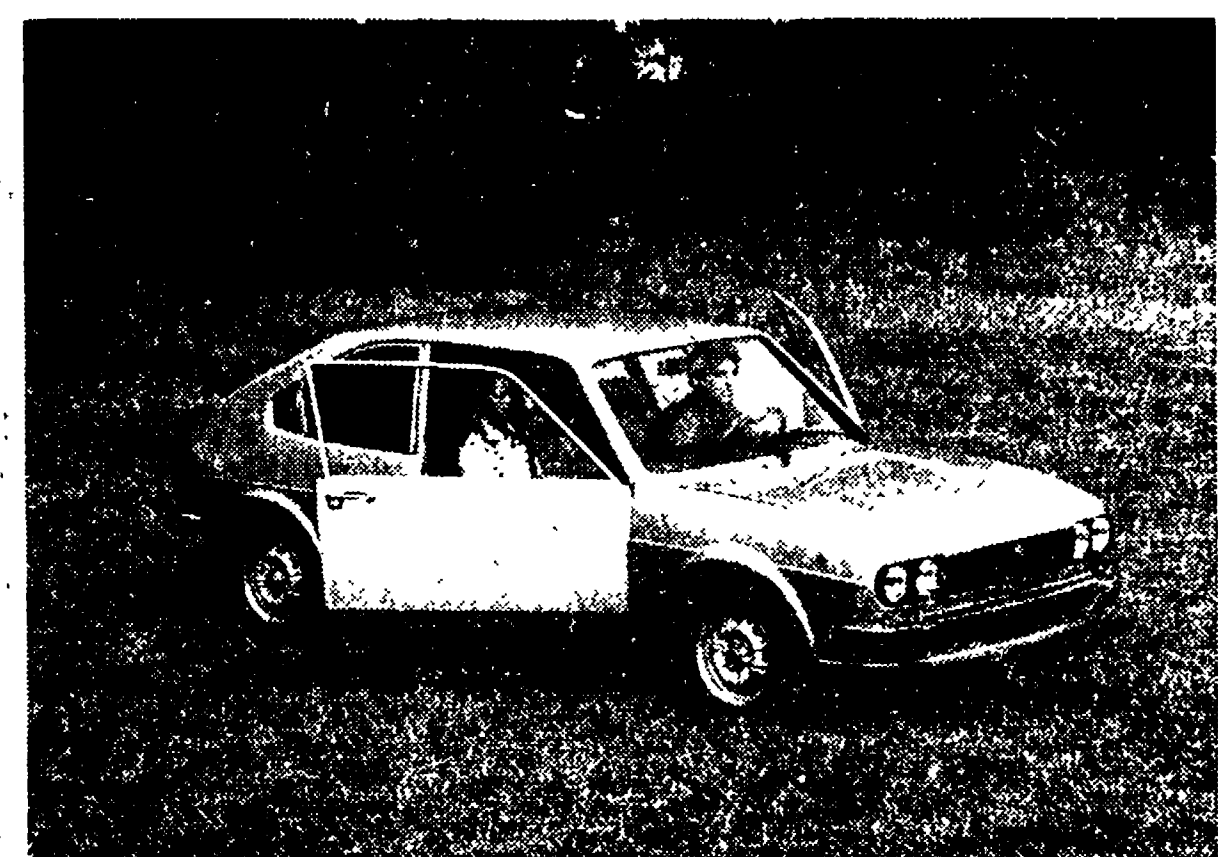
L'«Alfasud TI»: anche la sua aerodinamica contribuisce a contenere i consumi di carburante.