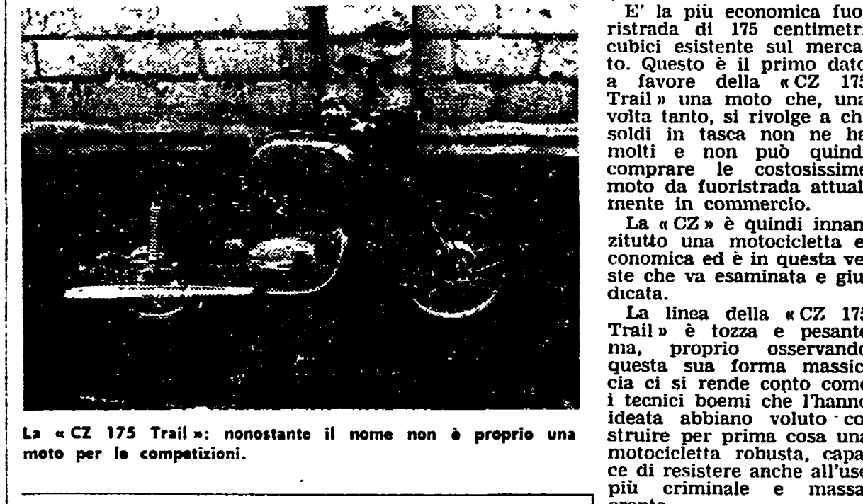
La «CZ 175 Trail»: nonostante il nome non è proprio una moto per le competizioni.

E' la più economica fuoristrada di 175 centimetri cubici esistente sul mercato. Questo è il primo dato a favore della «CZ 175 Trail» una moto che, una volta in moto, si rivolge a chi solida in tasca non ne ha molti e non può quindi comprare le costosissime moto da fuoristrada attualmente in commercio.