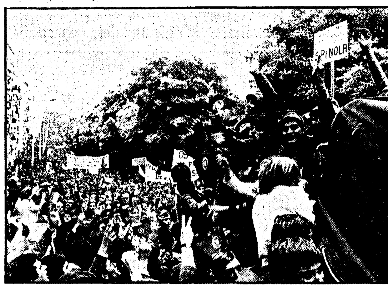
Portogallo nascita della libertà: con questo documentario cinematografico di Luigi Perelli, regista e operatore...

Il documentario di Luigi Perelli, realizzato dalla Unitefilm, ha avuto la sua prima visione pubblica al Festival nazionale dell'«Unità»