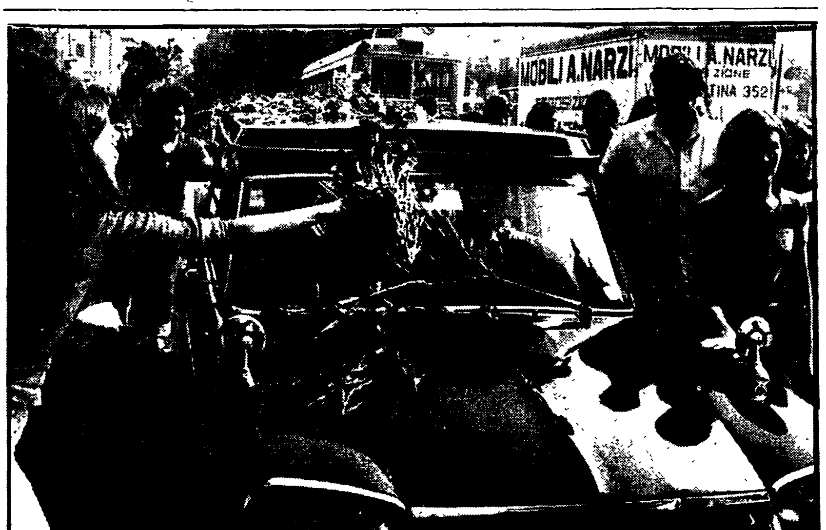
Un momento dei funerali di Fabrizio Ceruso

Continuano a ritmo serrato gli incontri per assicurare l'urgente reperimento dei 500 alloggi richiesti dal movimento democratico - Già a disposizione un primo blocco di 130 appartamenti - Ieri riunione della commissione capitolina per l'edilizia popolare - Presa di posizione del SUNIA