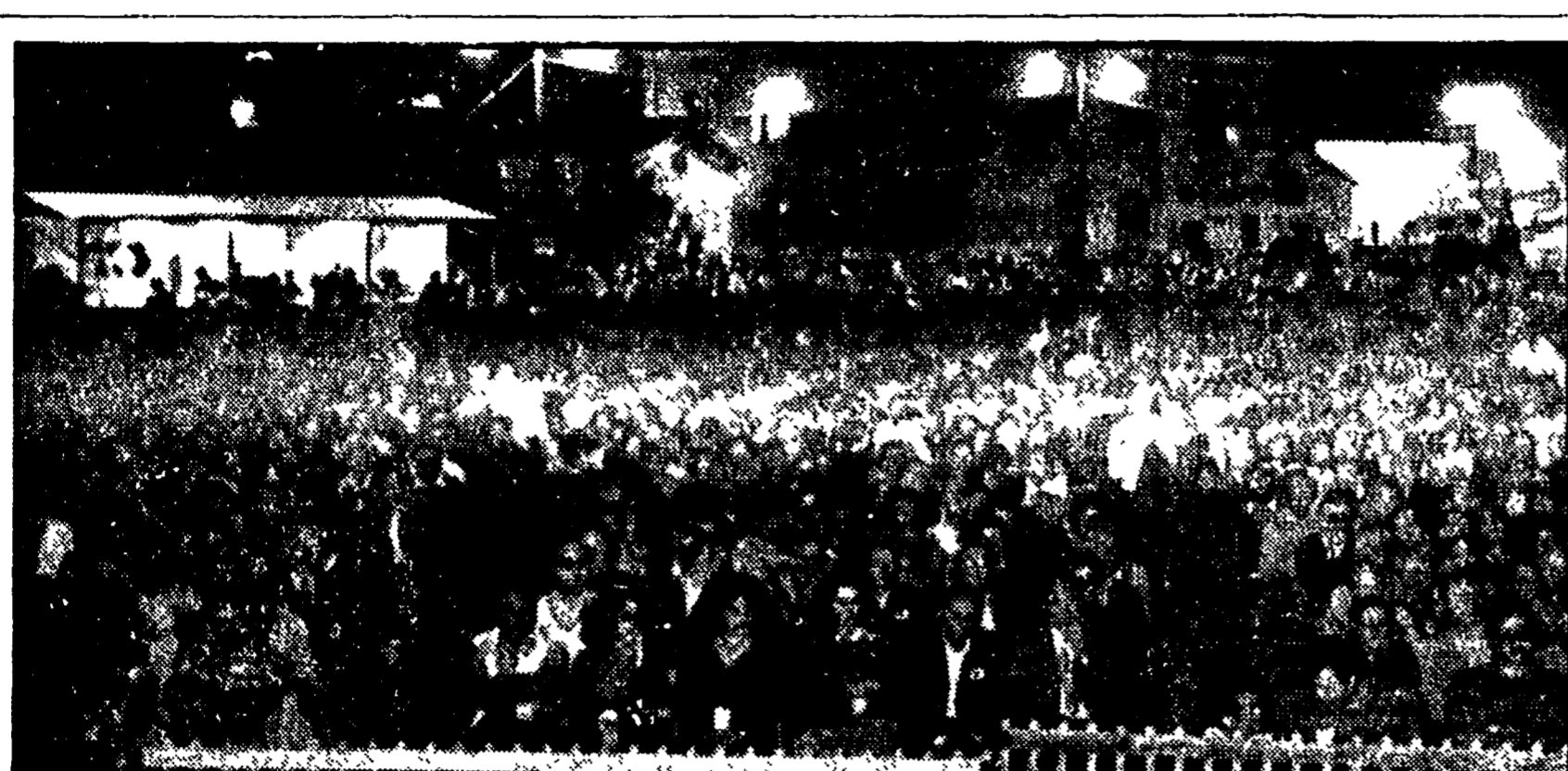
Una grande folla ha gremito ieri sera il teatro all'aperto del Festival partecipando ad una commossa manifestazione di solidarietà con il popolo cileno...