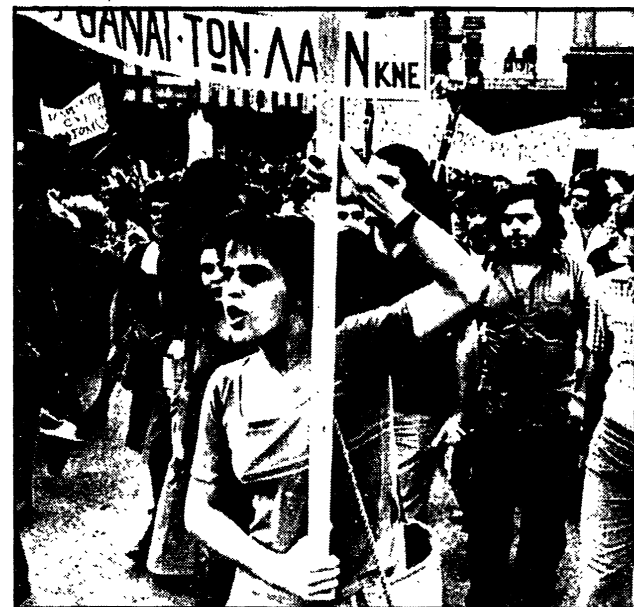
ATENE - Migliaia di giovani hanno manifestato davanti all'università recando cartelli di critica alla politica statunitense e di solidarietà con il popolo cileno

eratica, ecc.) e dalle maggiori organizzazioni internazionali della gioventù (Unione internazionale della gioventù democratica cristiana, Unione internazionale degli studenti, Movimento internazionale degli studenti per le Nazioni unite, Unione internazionale della gioventù socialista, Federazione mondiale della gioventù democratica) i cui rappresentanti sono presenti all'incontro.