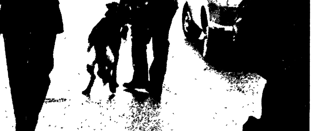
MILANO - Un posto di blocco dei carabinieri istituito subito dopo la sparatoria in banca

Arrestato in un ospedale dove si era fatto ricoverare - Una ragazza e una « infermiera » in carcere per favoreggiamento - Domani i funerali del giovane milite assassinato