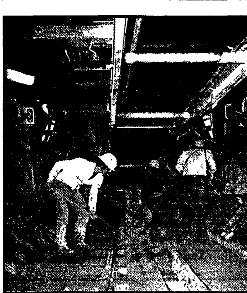
Per il metrò solo «previsioni»