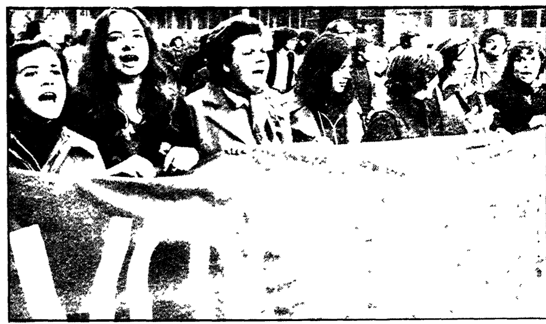
Anche se gli striscioni e i cartelli sono stati riposti, ancora ieri nei luoghi di lavoro si è tornato a discutere sulla grande giornata di lotta che giovedì ha visto scendere in piazza centinaia di migliaia di lavoratori per un diverso sviluppo economico e la difesa della democrazia. L'alto grado di mobilitazione e maturità che ha caratterizzato lo sciopero generale...