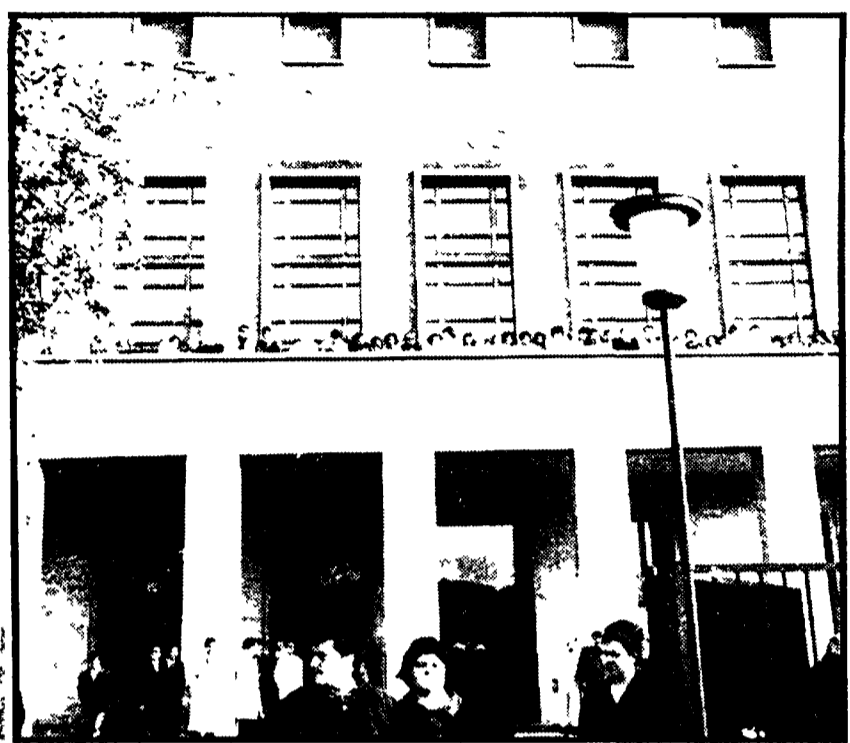
L'ingresso del Sant'Eugenio, dove sono avvenuti gli sconcertanti episodi

Diagnosi senza visite e controlli appropriati - Ingiustificabili e prolungate assenze dei medici di turno - Illecita e sfacciata propaganda a favore di centri di cura privati - La denuncia del gruppo comunista alla Regione - Necessaria una rigorosa indagine