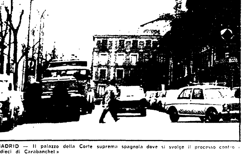
MADRID — Il palazzo della Corte suprema spagnola dove si svolge il processo contro «dieci di Carabanchel» del tribunale supremo, dove è stato ripreso l'esame del corso del processo 1001. Aspetti: dieci processi, che hanno dato una risposta definitiva e di gran lunga più scolorita della fame nella prospettiva della sentenza del nuovo.