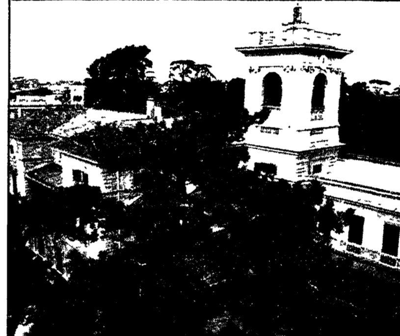
Una veduta del parco di Villa Mirafiori acquistata dall'Università

La giunta non ha ancora ratificato la convenzione tra la III circoscrizione e l'ateneo, che ha acquistato il complesso nella Nomentana - Secondo gli accordi il parco avrebbe dovuto essere concesso al Comune, ma la giunta continua a tacere - In pericolo la realizzazione dell'asilo-nido nell'edificio