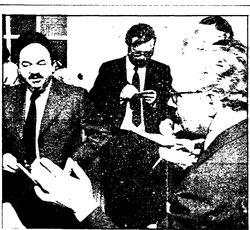
CRISI POLITICA DANESE Il primo ministro danese, Poul Harting, capo del partito radicale, ha annunciato ieri a Copenhagen (nella foto) che rinuncia a costituire un nuovo governo. Per tanto, la regina Margrethe ha affidato l'incarico ad Anker Joergensen, capo del Partito socialdemocratico. Ex-primo ministro, Joergensen dovrebbe formare, a quanto ci si attende, un governo di minoranza costituito soltanto da socialdemocratici.

delegazione allargata è durata due ore e mezzo ed è stato quindi interrotto per una nuova colazione di lavoro. Le parti sono poi tornate a sedere al tavolo della trattativa alle 15, mentre per le 18.30 è fissata una audizione del Capo dello Stato Ezer Weizman. Domani Kissinger avrà un nuovo incontro con i dirigenti israeliani prima di partire per il Cairo, dove è previsto dal presidente Sadat. Egli tornerà poi al secondo colloquio in Israele giovedì sera dopo le sue visite al Cairo e a Damasco.