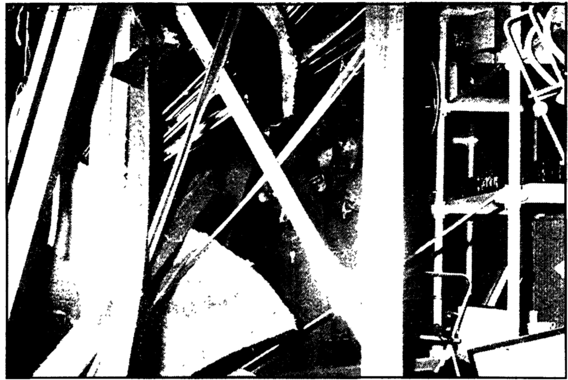
VIAREGGIO - I danni all'interno del negozio preso di mira dai fascisti