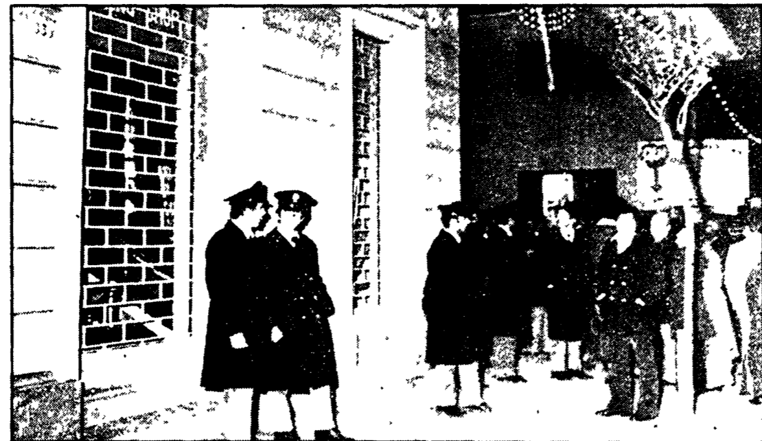
Sono ormai otto gli attentati fascisti a Viareggio. La scorsa notte, come è noto, due bombe cariche sono state fatte esplodere...