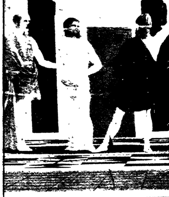
URBINO. 11 - Le indagini per far luce sul più clamoroso furto d'arte che mai si sia verificato in Italia...