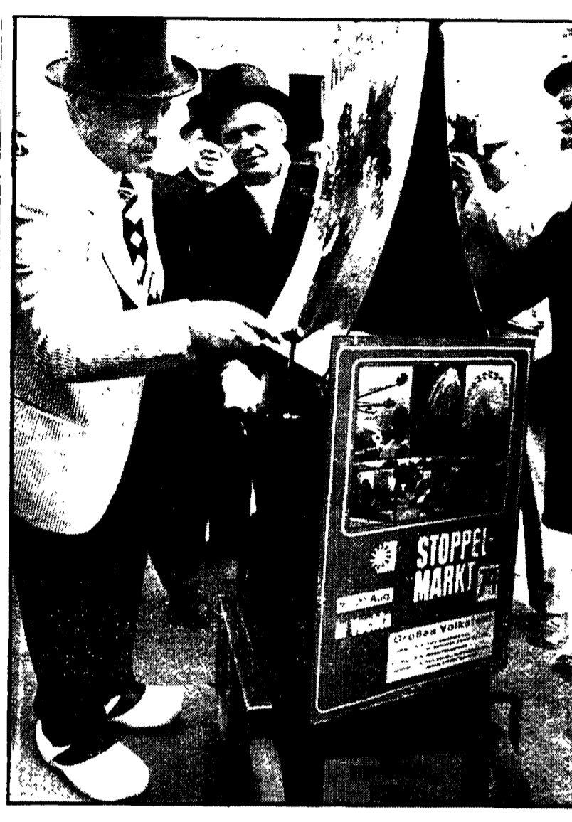
BONN — Helmut Schmidt, colto in una singolare tenuta, mentre riceve in regalo un organo a manovella da una banda di musica folkloristica che gli ha suonato una serenata sotto le finestre della Cancelleria

Malgoverno. Nel dopoguerra, la classe dirigente, i governi e le amministrazioni, dominate dalla Democrazia Cristiana, hanno voluto che Roma restasse una città di sempre.