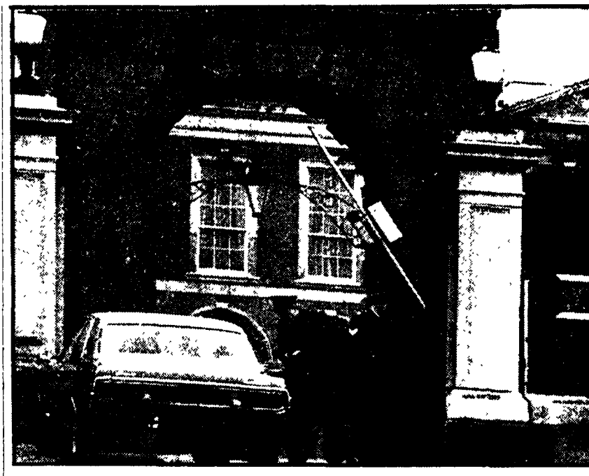
Rigorosi controlli all'ingresso del Castello di Dublino, per la riunione dei capi di governo dei ministri degli esteri della CEE