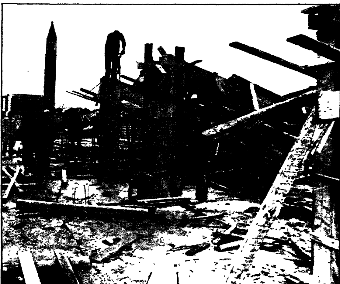
Alcuni operai mentre demoliscono uno dei palazzi abusivi in via Mantegna

I primi colpi di piccone sul tetto di uno degli edifici in via di completamento - Rientrata, dopo l'impegno del rappresentante del Campidoglio, la protesta dei dipendenti del cantiere che temevano di perdere il posto di lavoro - L'abbattimento motivato da un groviglio di irregolarità e di abusi, dall'occupazione di suolo comunale, alla violazione della cubatura e dei piani originari