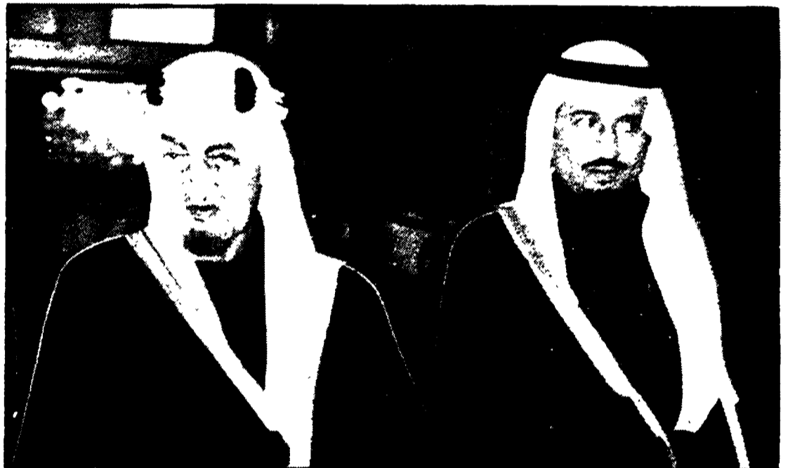
Una recente foto di re Feisal (a sinistra) insieme al suo successore, Khaled Ben Abdel Aziz

L'omicida avrebbe agito «di sua iniziativa» - Khaled, fratello dell'ucciso, nuovo sovrano - Emozione e sgomento nel mondo arabo - Ford: perdita di un «amico intimo»