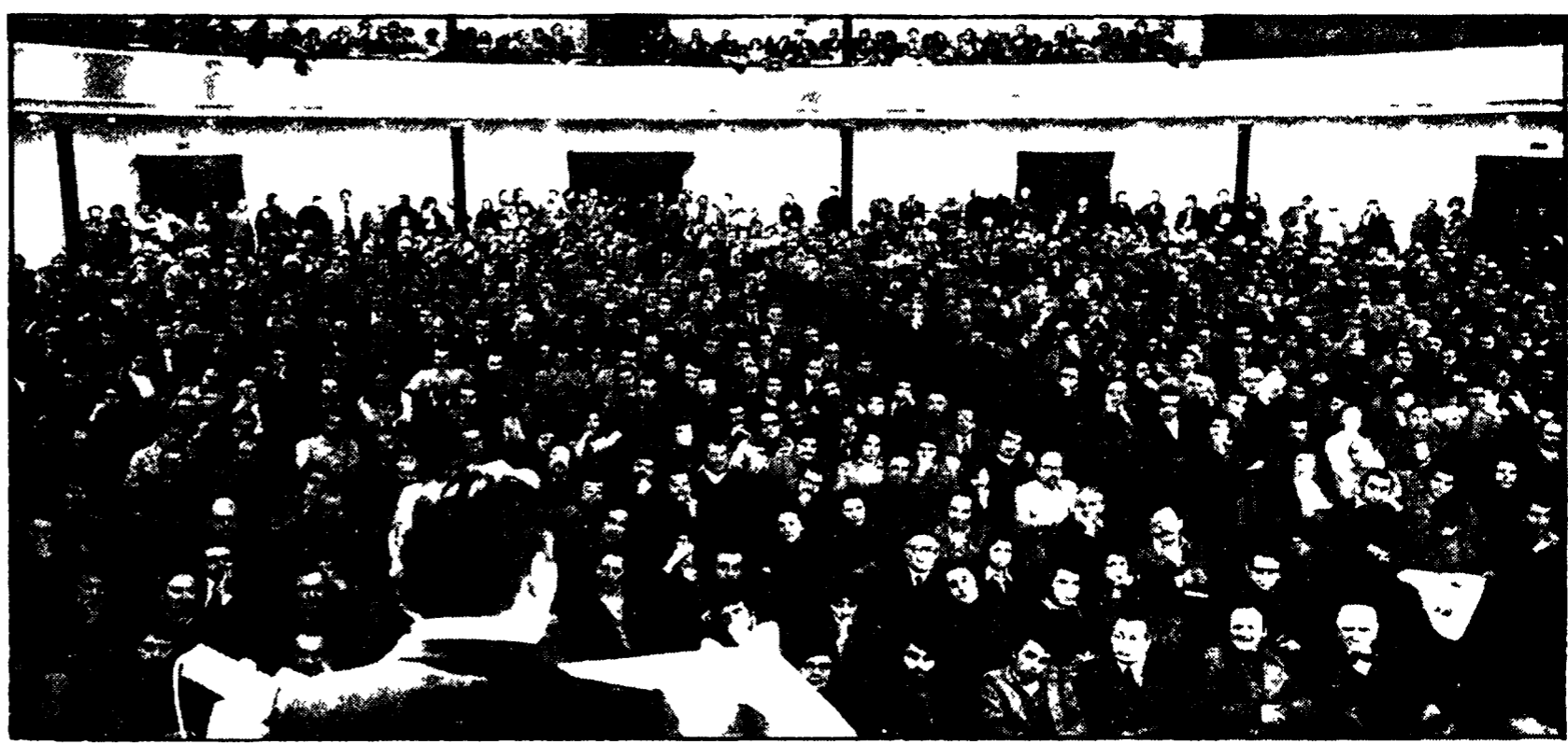
La grande assemblea unitaria contro il fascismo che si è svolta ieri sera al cinema Adriano, nel corso della quale è stata lanciata la petizione popolare