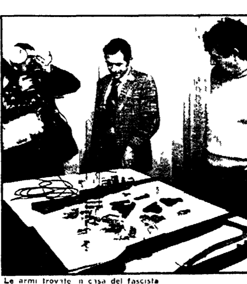
Le armi trovate in casa del fascista

Per accelerare la demolizione della costruzione abusiva. La società che subentra si impegna a garantire l'occupazione per i prossimi tre anni a rispettare tutti gli accordi sindacali stipulati nel corso degli ultimi mesi. Questo punto molto importante che dovrà essere gestito da una commissione di lavoro.