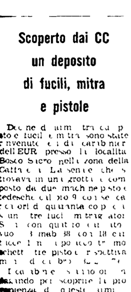
Le armi trovate in casa del fascista

La grande assemblea unitaria contro il fascismo che si è svolta ieri sera al teatro Adriano, nel corso della quale è stata lanciata la petizione popolare. In alto: il momento della lettura delle firme. In basso: i discorsi degli esponenti politici e sindacali.