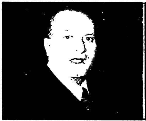
Il generale Vito Miceli

Parere favorevole alla revoca del mandato di cattura per cospirazione spiccato dal giudice Tamburino di Padova - La procura romana contro la scarcerazione per il favoreggiamento nel golpe Borghese e contro la libertà provvisoria - Ma per decorrenza dei termini l'ex capo del SID uscirebbe entro brevissimo tempo